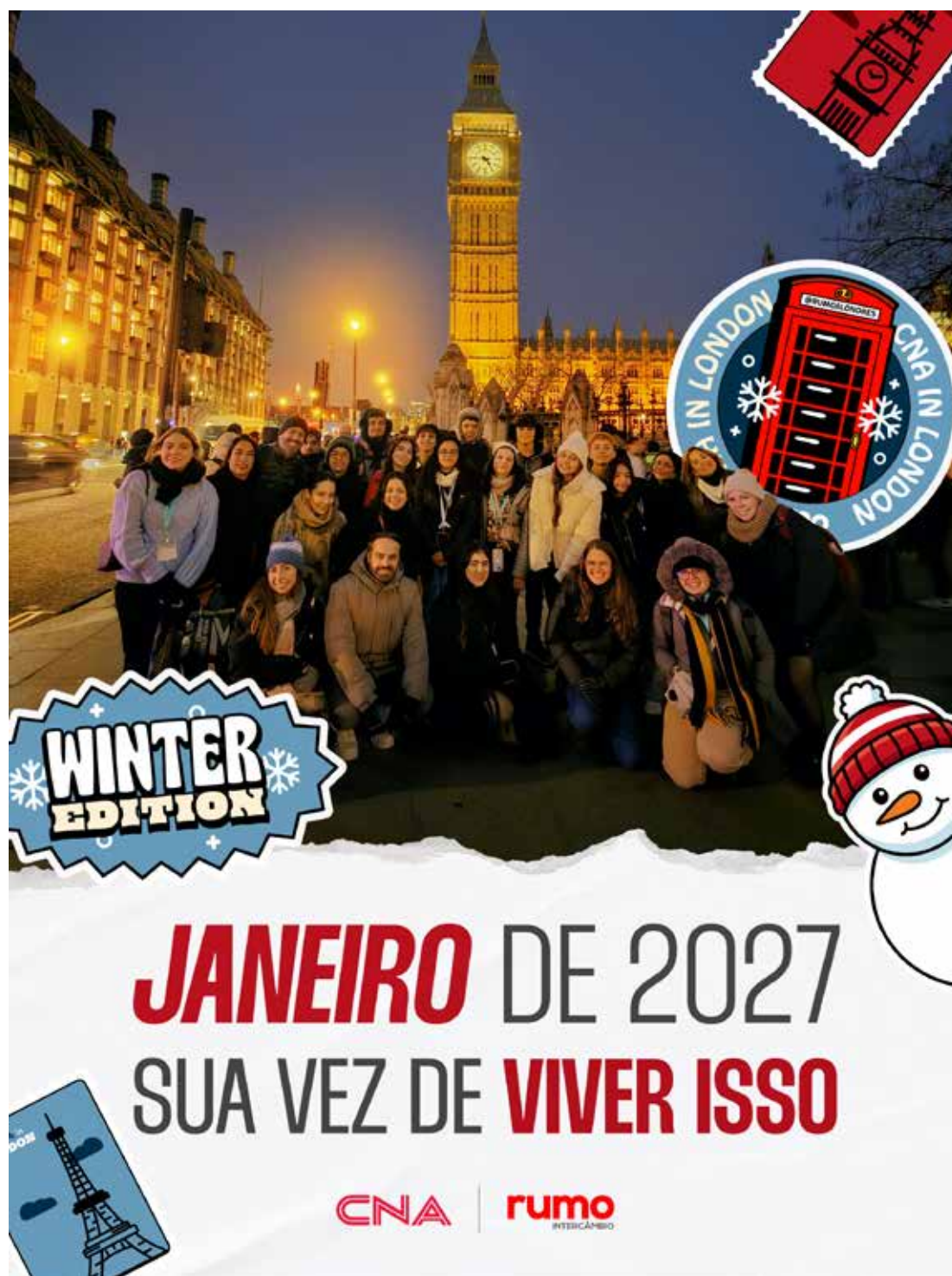
Os roteiros e o suporte operacional foram desenhados exclusivamente para a comunidade do CNA

Por questões de alinhamento pedagógico e segurança logística, o programa é restrito a alunos regulares do CNA. A exigência garante o nivelamento necessário para que o grupo aproveite ao máximo a experiência no exterior.