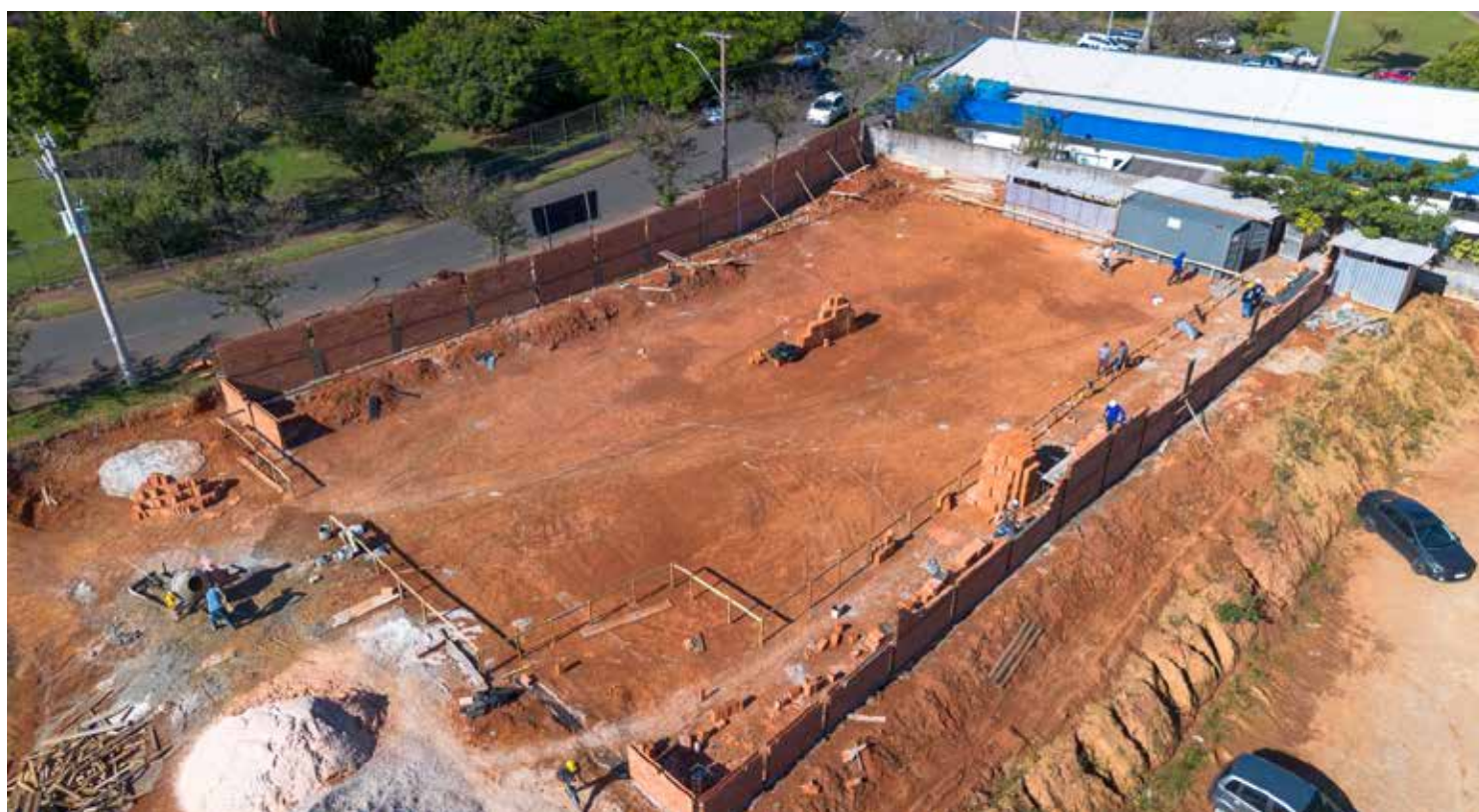
O Centro de Parto Normal será planejado para garantir um ambiente acolhedor

O novo equipamento contribuirá para ampliar a capacidade de atendimento, reduzir intervenções desne-