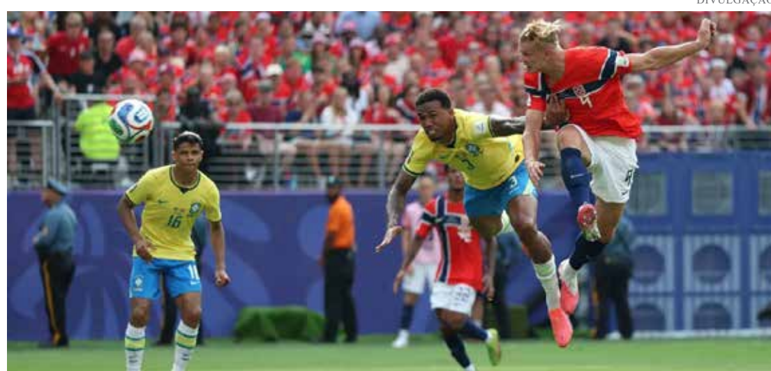
A Noruega apresentou maior controle da posse de bola durante boa parte do jogo e conseguiu transformar esse domínio em vantagem

Agora, a equipe brasileira inicia um novo ciclo de preparação visando a Copa do Mundo de 2030, com o desafio de reconstruir o elenco e retomar o protagonismo no cenário internacional.