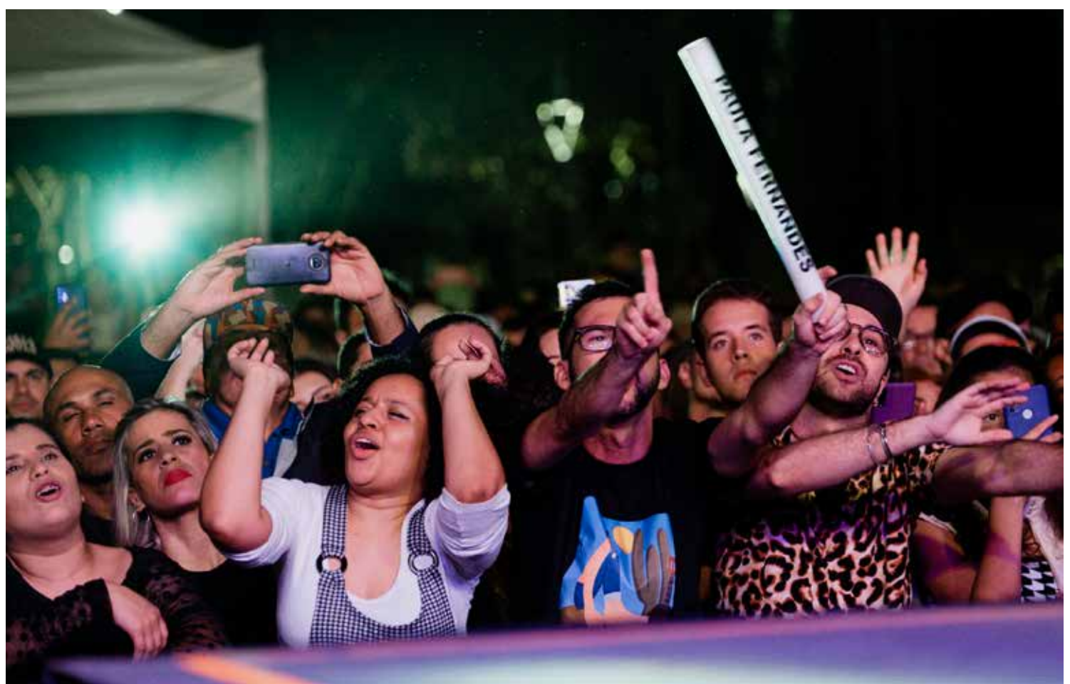
Tradicional no calendário turístico da região, o evento atrai milhares de visitantes

Tradicional no calendário turístico da região, o evento atrai milhares de visitantes de cidades do Circuito das