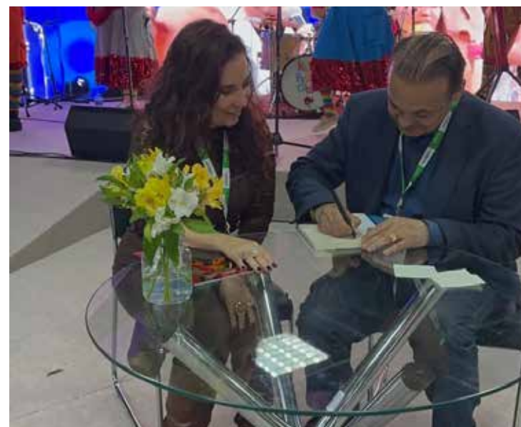
Lançamento do livro do ex-secretário de Turismo