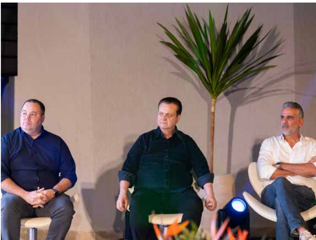
Com a contagem regressiva para as eleições, pré-candidatos intensificam agendas, articulações e apresentações de propostas à população