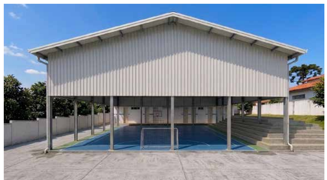
Projeto prevê quadra coberta, arquibancadas, vestiários e acessos cobertos para ampliar a estrutura destinada aos estudantes