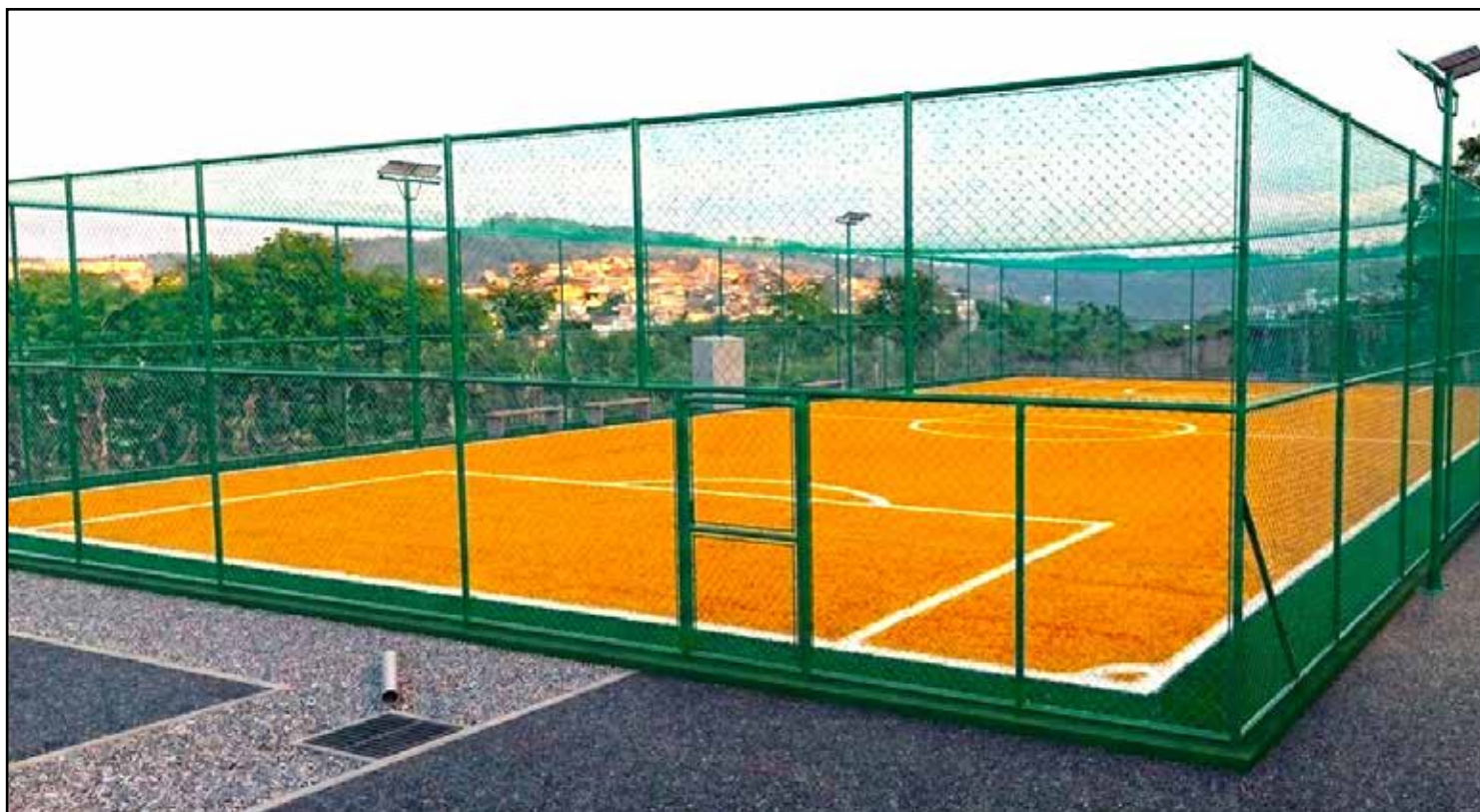
A quadra terá 800 mts 2 e contará com grama importada

A mais nova escola de futebol da cidade terá como colaboradores/patrocinadores as