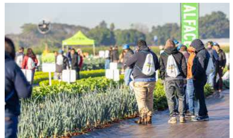
Feira é considerada a principal de horticultura da América Latina

A programação da feira inclui exposição de produtos, demonstrações de tecnologias, lançamentos do setor e oportunidades de networking entre profissionais da cadeia produtiva da horticultura.