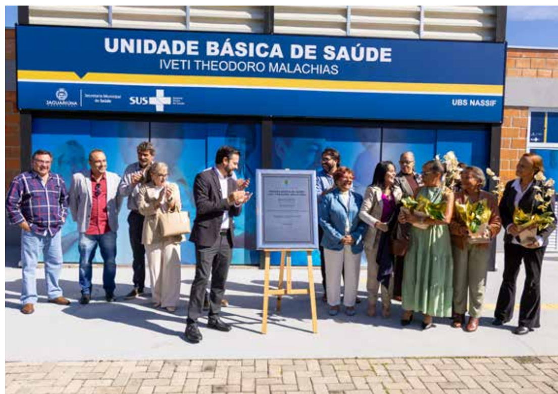
Esta é a 13ª UBS em funcionamento no município

“Ver o nome da nossa mãe nesta UBS é como presenciar todo o amor, cuidado e dedicação que ela espalhou pela vida continuarem vivos entre