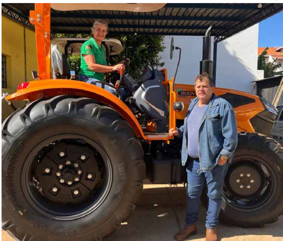
Equipamento adquirido por meio de convênio com o Ministério da Agricultura vai reforçar os serviços de preparo do solo e manejo agrícola no município

A Prefeitura de Artur Nogueira, por meio da Secretaria de Agricultura, adquiriu um novo trator para reforçar os serviços prestados aos produtores rurais do município. O equipamento foi conquistado através de convênio firmado junto ao Ministério da Agricultura e Pecuária.