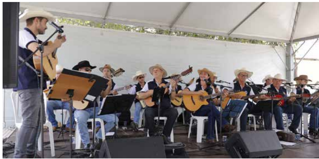
Programação conta com a apresentação da Orquestra Violeiros do Jaguary

O Centro de Cultura Caipira de Jaguariúna, na Estação de Guedes, volta a receber mais uma edição do Café com Viola. O tradicional evento acontecerá neste domingo, 31, das 9h às 12h, com entrada gratuita.