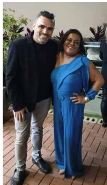
Joe, o anfitrião

Jundiaí recebeu um elegante coquetel de networking com menu degustação de comida japonesa, promovido pela Joe Sushi, parceiro do Cerimonial Assessoria. O evento reuniu convidados em uma experiência marcada por gastronomia, conexões e momentos especiais.