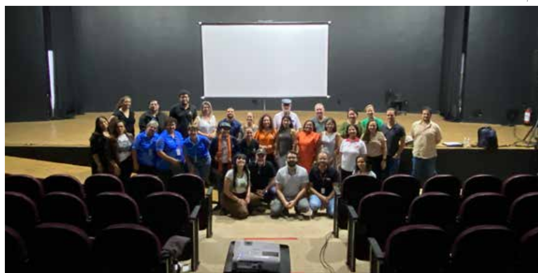
Evento reuniu empresários, representantes de conselhos municipais, associações e moradores

A Prefeitura de Holambra, por meio do Departamento Municipal de Turismo e Cultura, promoveu nesta semana, no Teatro Municipal, a Consultoria Diagnóstica de Estruturação da Gestão do Turismo, ação integrante do programa Cidade Empreendedora, em parceria com o Sebrae Aqui. O encontro reuniu empresários do trade turístico, representantes de conselhos municipais, associações e moradores interessados no desenvolvimento do setor.