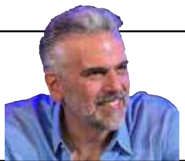
Gustavo Reis, ex-prefeito de Jaguariúna *