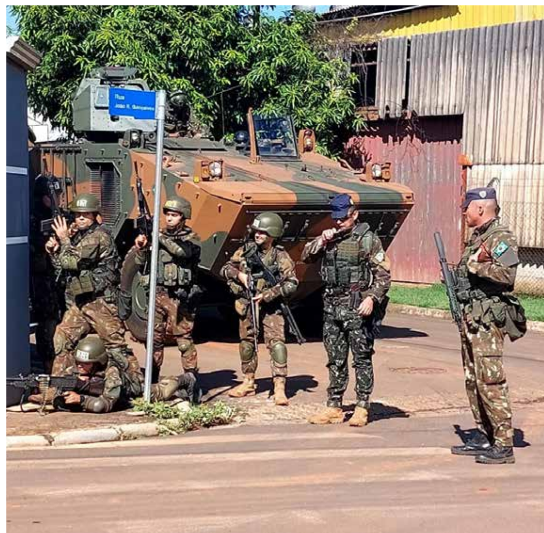
Atividade reúne militares de diferentes organizações do país

A realização da atividade fortalece a integração entre instituições e comunidade local, além de contribuir para a preparação das Forças Armadas em cenários de atuação urbana e humanitária.