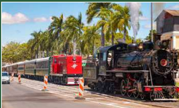
A programação será realizada ao longo da próxima semana

A Prefeitura de Jaguariúna, por meio da Secretaria Municipal de Desenvolvimento Econômico, Turismo e Agronegócio, realiza entre os dias 11 e 17 de maio a Semana do Turismo, uma iniciativa estratégica composta por uma programação diversificada e ações voltadas à promoção e ao fortalecimento do setor turístico no município. Página 4