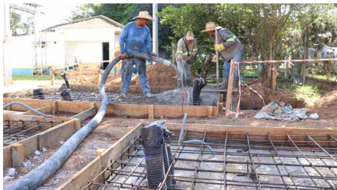
Estação recebe investimento de cerca de R$7 milhões

A Prefeitura de Jaguariúna deu início à primeira etapa da obra de revitalização e aumento de capacidade e eficiência energética da estação de captação de água do Rio Jaguari, localizada na Rodovia João Beira (SP-095).