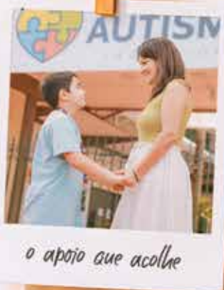
o apoio que acolhe