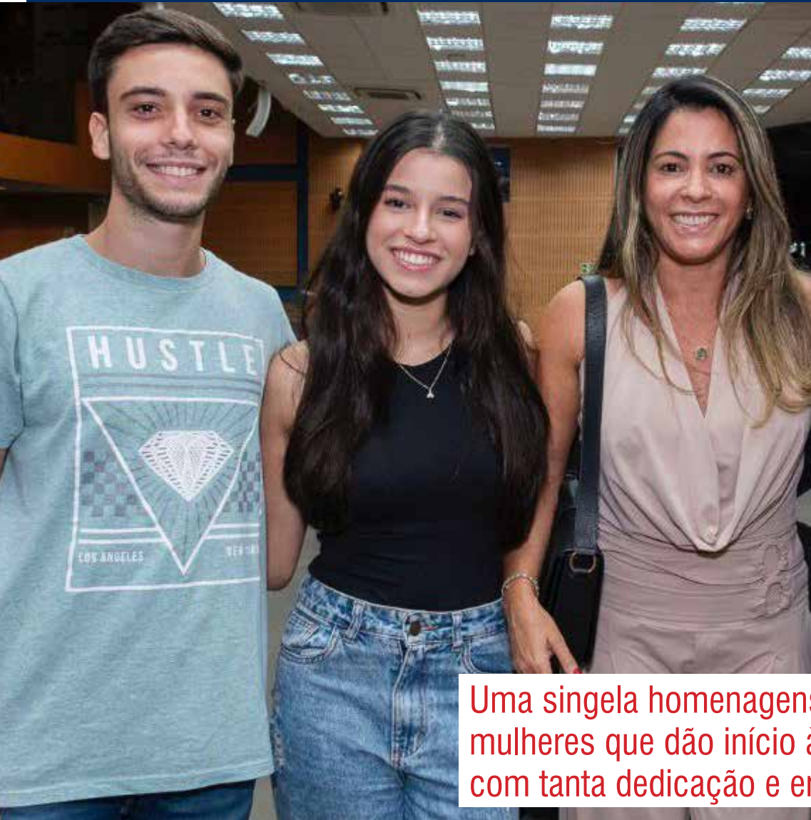
Uma singela homenagens as mulheres que dão início à vida com tanta dedicação e entrega