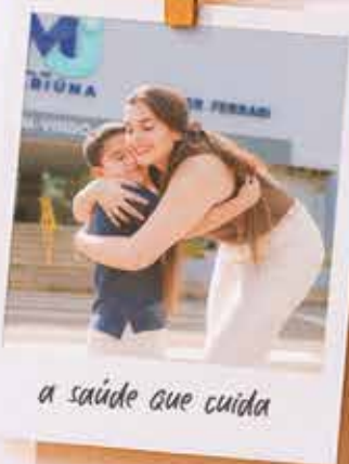
a saúde que cuida