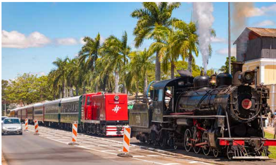
A programação será realizada ao longo da próxima semana

A Prefeitura de Jaguariúna, por meio da Secretaria Municipal de Desenvolvimento Econômico, Turismo e Agronegócio, realiza entre os dias 11 e 17 de maio a Semana do Turismo, uma iniciativa estratégica composta por uma programação diversificada e ações voltadas à promoção e ao fortalecimento do setor turístico no município.