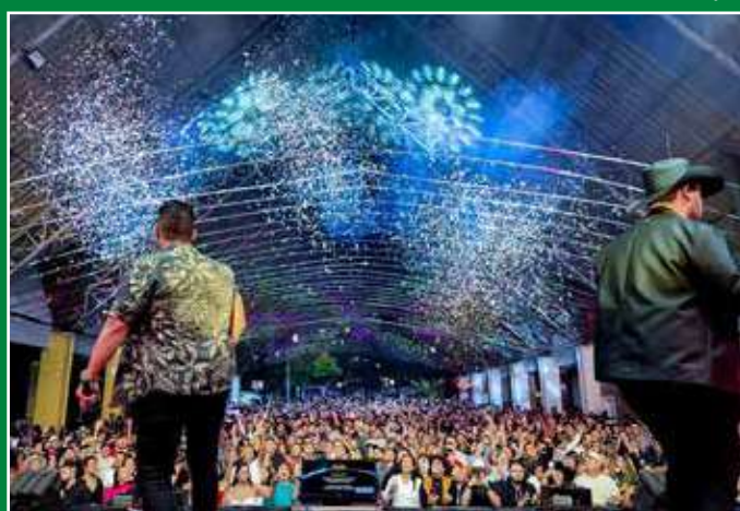
Festa do Trabalhador em Holambra

A Holambra recebe neste sábado, 09, a programação especial da Festa do Trabalhador, promovida pela Prefeitura Municipal na Rua da Amizade, conhecida como Rua Coberta. O evento tem entrada gratuita e atrações musicais para celebrar a data ao lado da população. Página 5