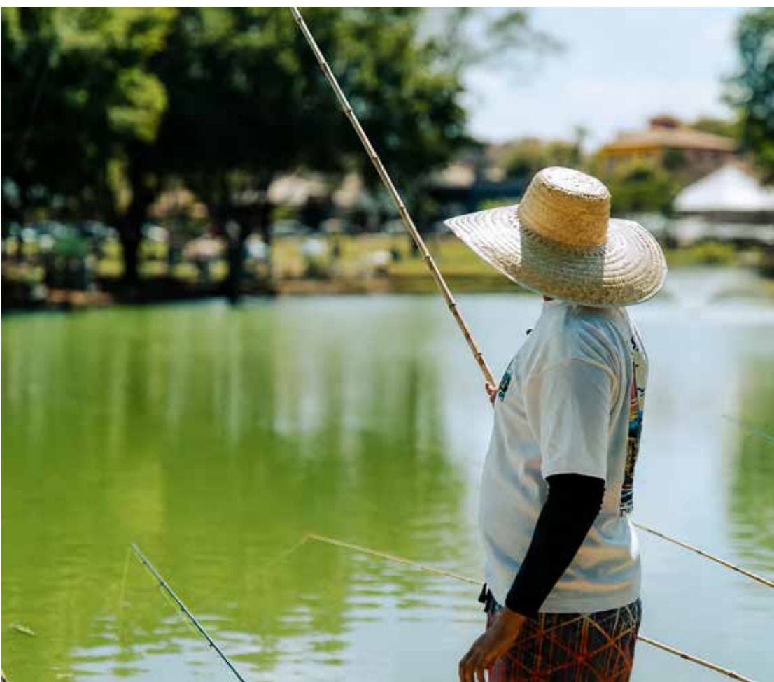
Mudança segue até 30 de maio

A Prefeitura de Artur Nogueira informa que, a partir desta sexta-feira, 08, o horário para pesca na Lagoa dos Pássaros será ampliado até às 22h. A atividade segue liberada para o público em geral até o dia 30 de maio.