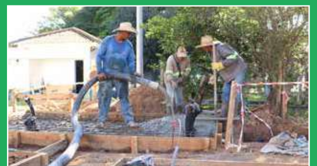
Estação recebe investimento de cerca de R$7 milhões

A Prefeitura de Jaguariúna deu início à primeira etapa da obra de revitalização e aumento de capacidade e eficiência energética da estação de captação de água do Rio Jaguari, localizada na Rodovia João Beira (SP-095). Segundo o Serviço Autônomo de Água e Esgoto de Jaguariúna (SAAE-JA), a obra conta com investimentos de cerca de R$7 milhões. Página 4