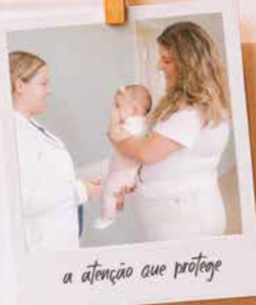
a atenção que protege