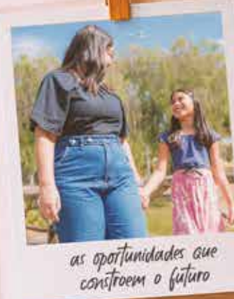
as oportunidades que constroem o futuro