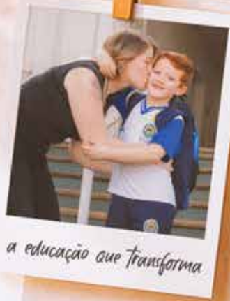
a educação que transforma