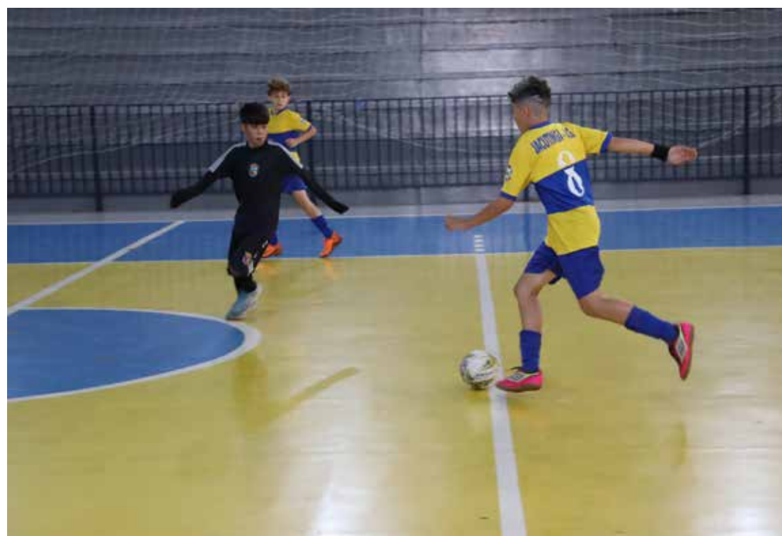
Aulas esportivas gratuitas em Santo Antônio de Posse

Mais informações podem ser obtidas junto ao Departamento de Esportes e Lazer pelo telefone (19) 3896-4762.