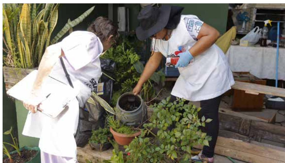
Prefeitura trabalha na conscientização dos moradores

A secretaria informa ainda que novas ações como essa serão realizadas em outras regiões da cidade, de acordo com o monitoramento epidemiológico, com o objetivo de ampliar a prevenção e garantir mais proteção à população.