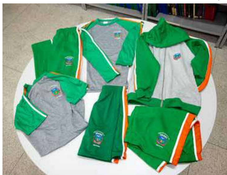
A entrega representa investimento direto nas famílias e no fortalecimento da educação pública

A Prefeitura de Holambra está entrando os novos uniformes escolares para estudantes da rede municipal de ensino. Ao todo, 2.288 alunos serão contemplados, desde crianças atendidas no berçário até estudantes da Educação de Jovens e Adultos.