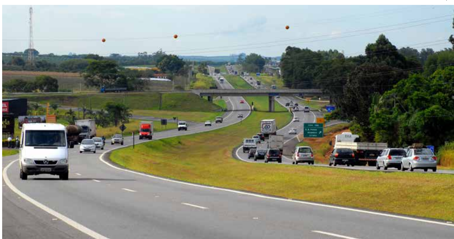
Toda movimentação nas rodovias será monitorada por meio das 95 câmeras do Centro de Controle Operacional (CCO) da Concessionária

Antes de pegar a estrada, é importante que se faça a ma-