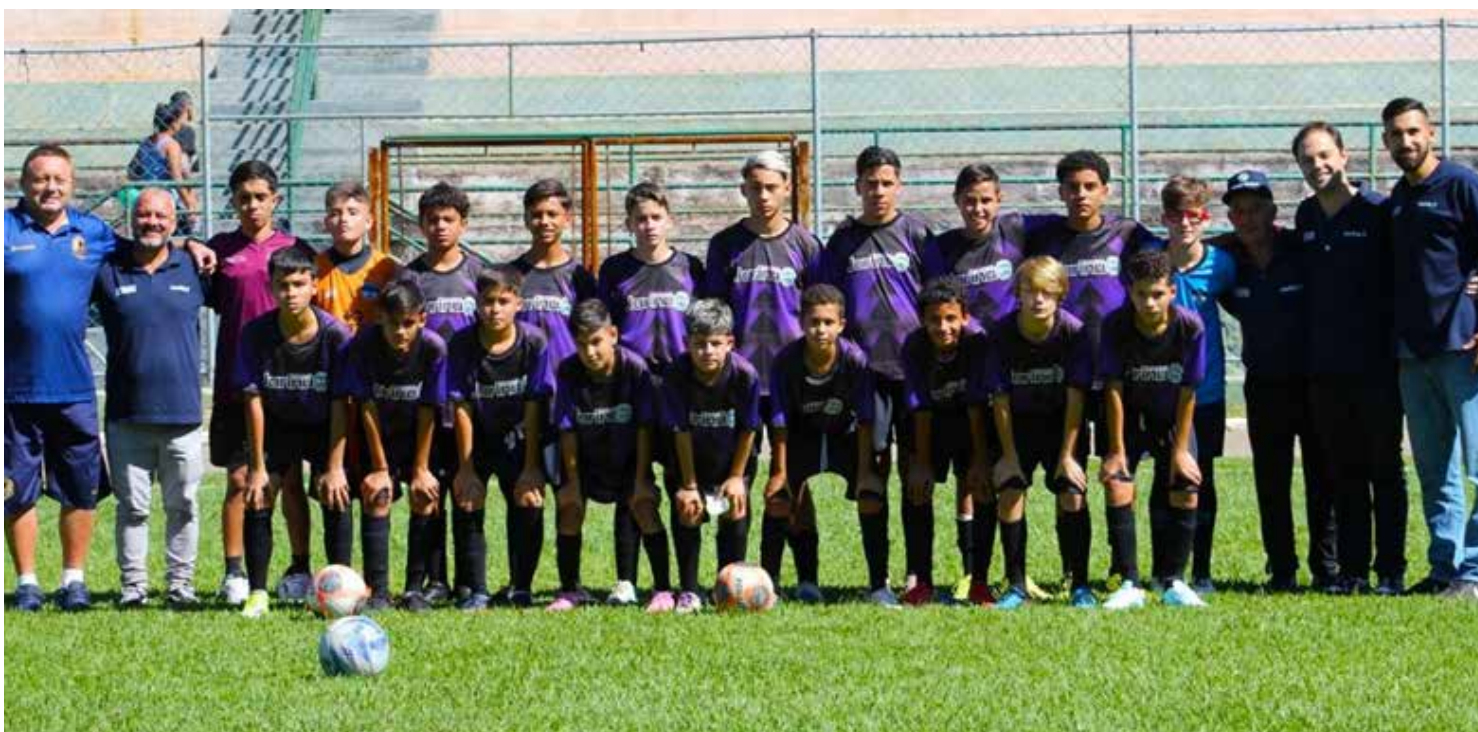
Equipe sub 13 de Jarinu – Campeã do grupo de São Paulo