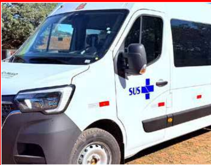
A van possui capacidade para até 15 passageiros

A Prefeitura de Jaguariúna conquistou, por meio do Governo do Estado de São Paulo, uma nova van destinada ao transporte de pacientes da rede municipal de saúde. A chegada do veículo aconteceu nesta quarta-feira, 15.