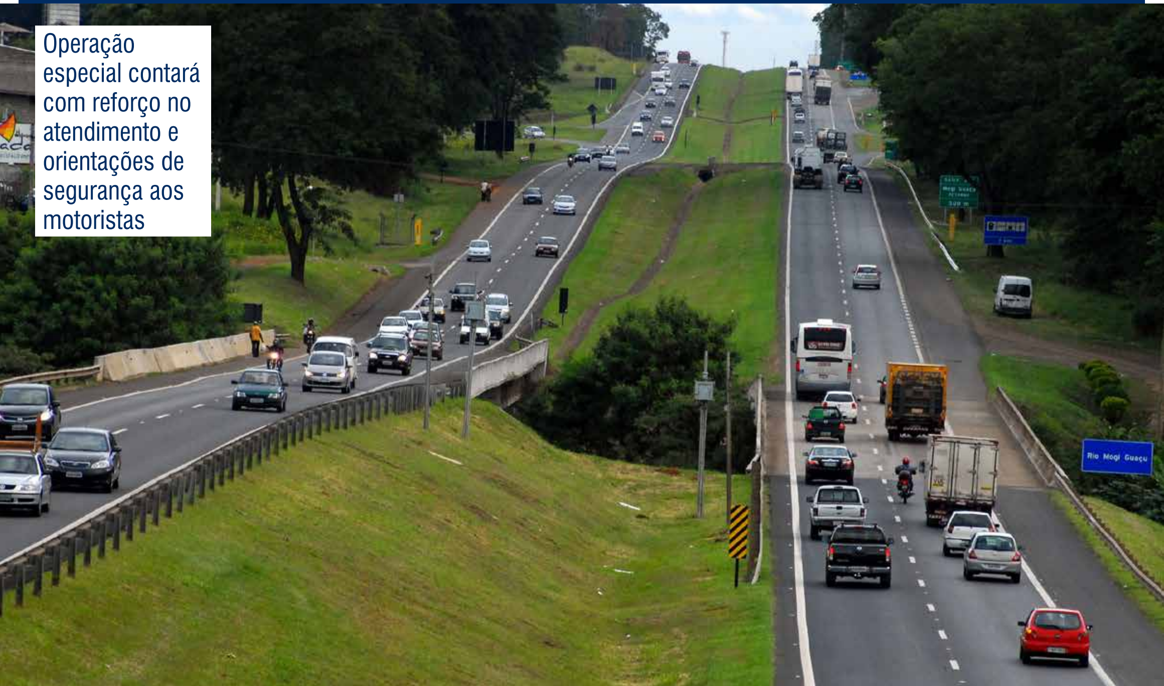
Durante todo o período, haverá atendimento 24 horas pelo telefone 0800 055 9696, além de telefones de emergência instalados ao longo das rodovias, a cada quilômetro

Operação especial contará com reforço no atendimento e orientações de segurança aos motoristas