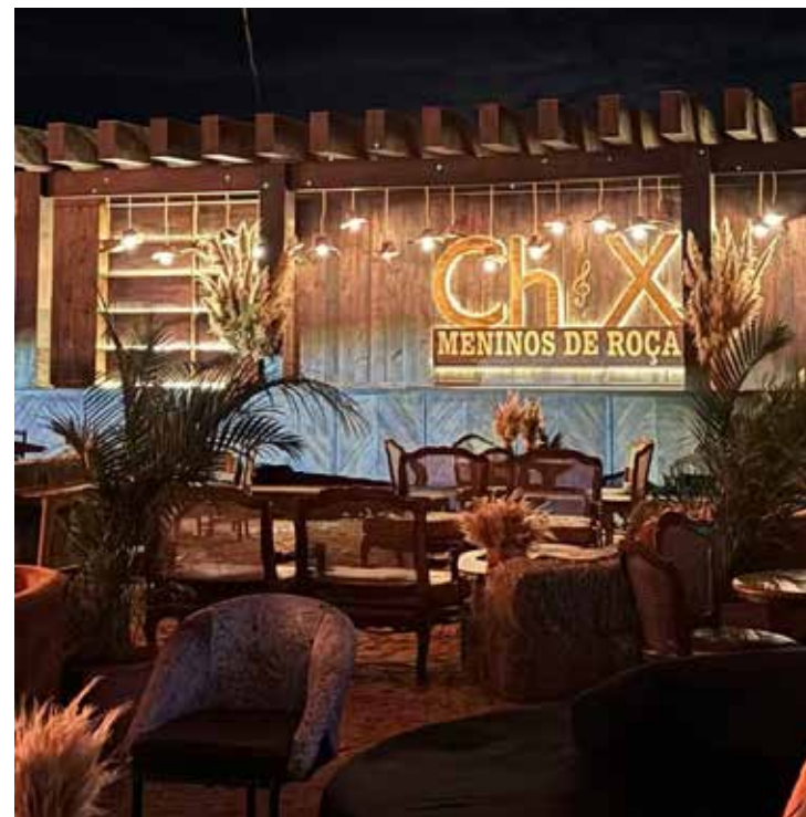
A ambientação busca criar a sensação de um show feito em uma casa rústica

A gravação também contou com participações especiais de artistas consagrados, reforçando o caráter colaborativo e celebrativo do novo trabalho.