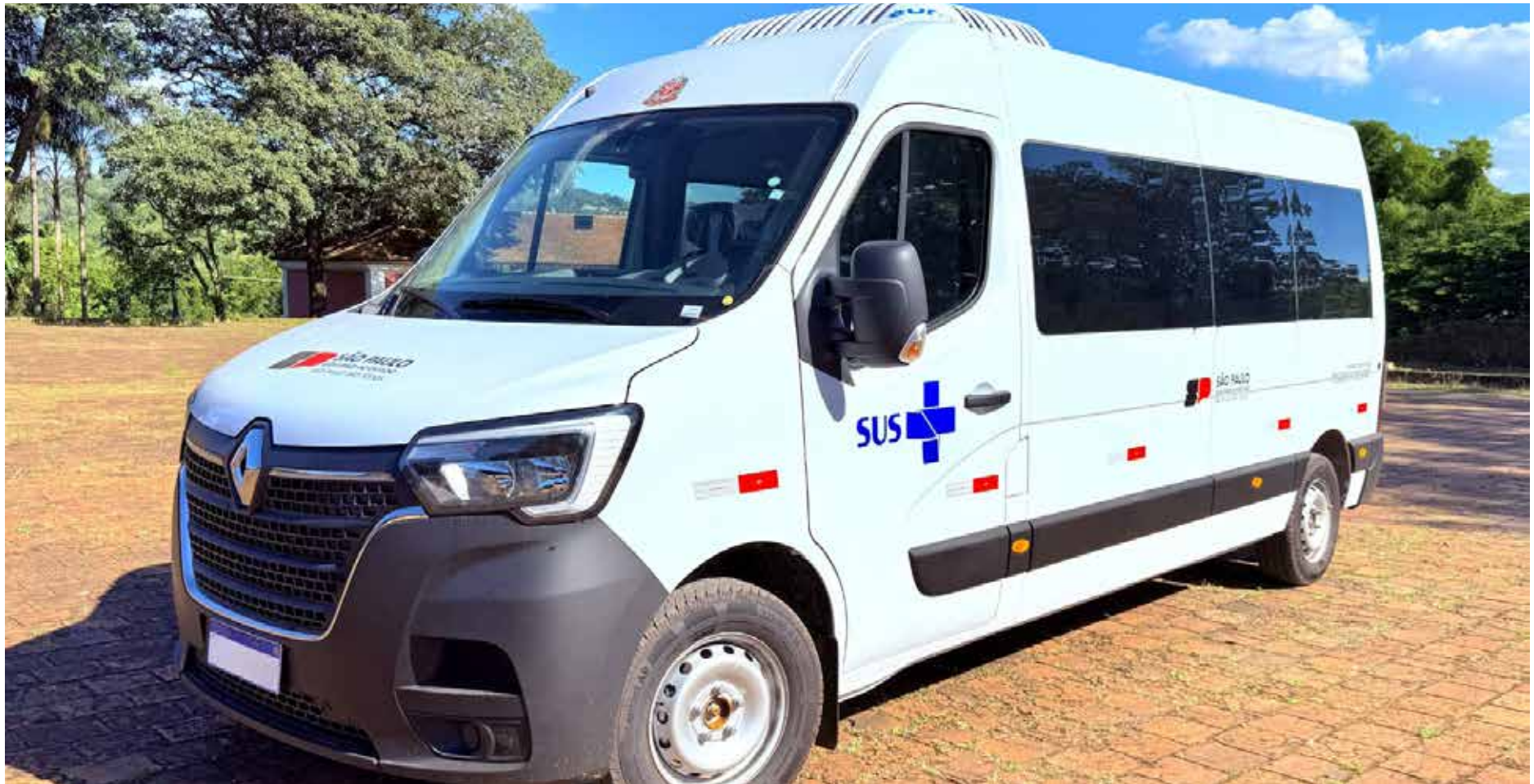
A van possui capacidade para até 15 passageiros

O novo veículo passa a integrar a frota da Secretaria Municipal de Saúde, ampliando a capacidade de atendimento e garantindo mais eficiência no deslocamento de pacientes que necessitam de consultas, exames e tratamentos em outras unidades e municípios.