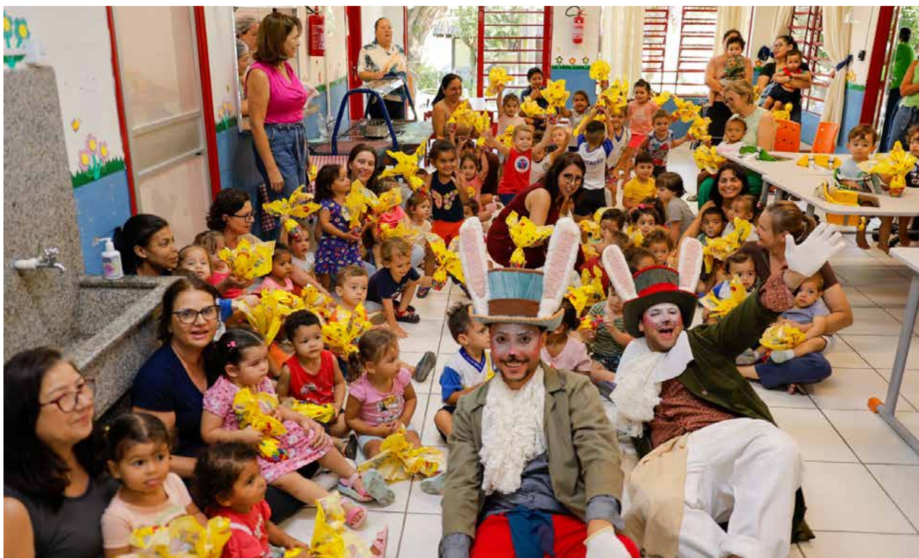
O clima nas escolas foi marcado por sorrisos

A ação, coordenada pela Secretaria Municipal de Educação, teve início no dia 25 de março e seguiu até o dia 31, percorrendo todas as unidades escolares do município. Ao longo dos dias,