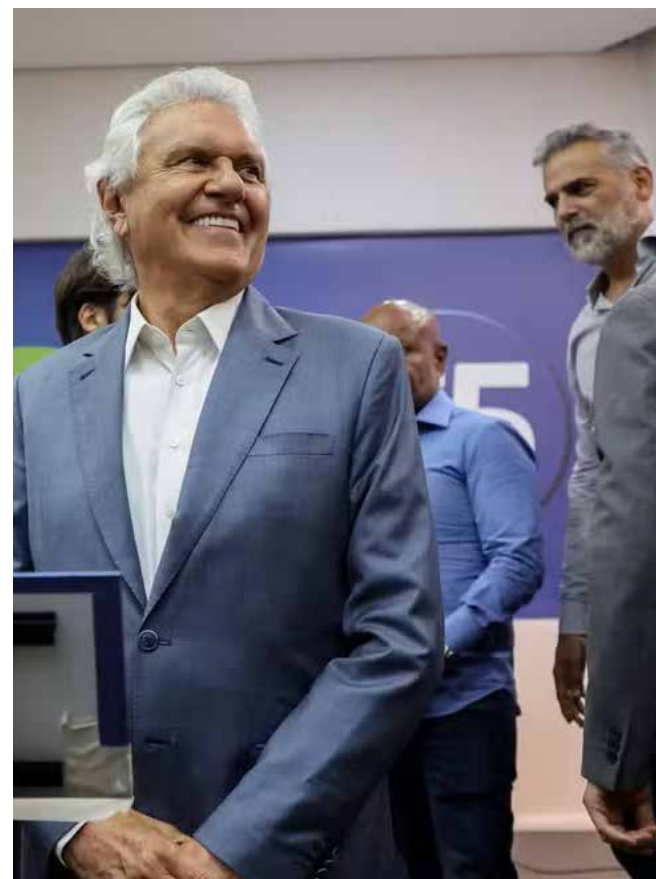
O governador de Goiás teve sua pré-candidatura à Presidência da República

O anúncio foi feito pelo presidente nacional da legenda, Gilberto Kassab, durante coletiva