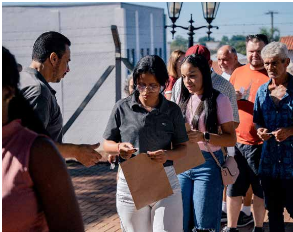
A ação reuniu dezenas de moradores

A 3ª edição do Emprega Holambra, realizada no último sábado, dia 28 de março, na Escola Municipal Imigrantes,