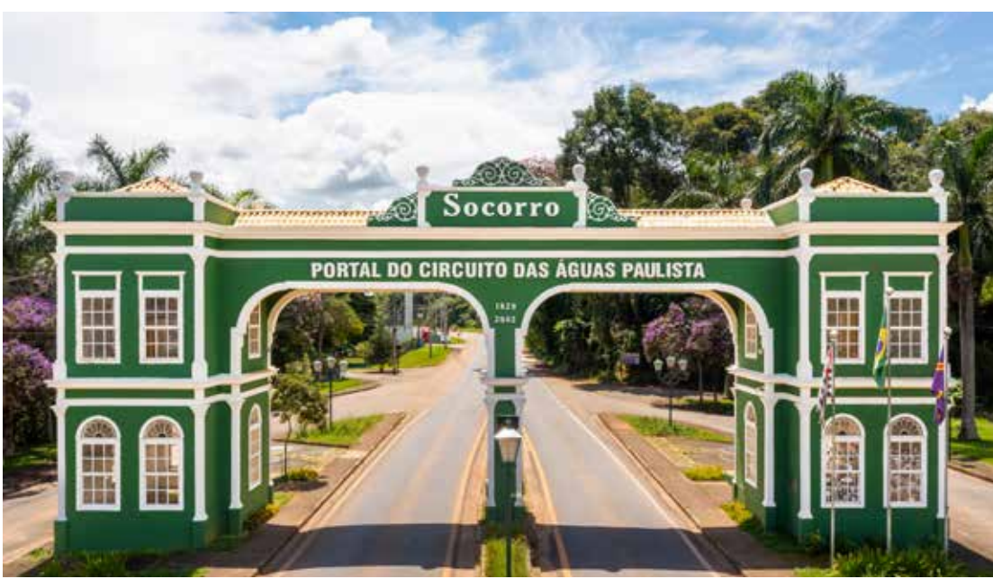
A cidade do Circuito das Águas Paulista destaca o Ecoturismo, Turismo de Aventura e Contato com a Natureza em evento que acontece durante o 68º Congresso Estadual de Municípios

A 1ª edição do Expo Turismo Paulista, organizada pela Associação das Prefeituras das Cidades Estância do Estado de São Paulo (Apresesp), em parceria com a Associação Paulista de Municípios (APM), acontece entre os dias 06 e 08 de abril, no Parque Anhembi, na capital paulista, dentro da programação do 68º Congresso Estadual de Municípios.