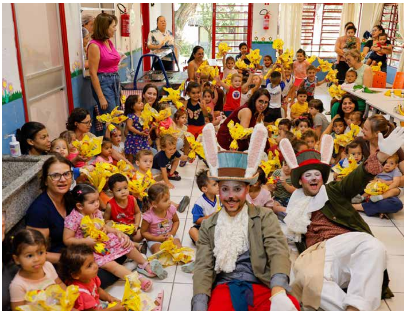
O clima nas escolas foi marcado por sorrisos