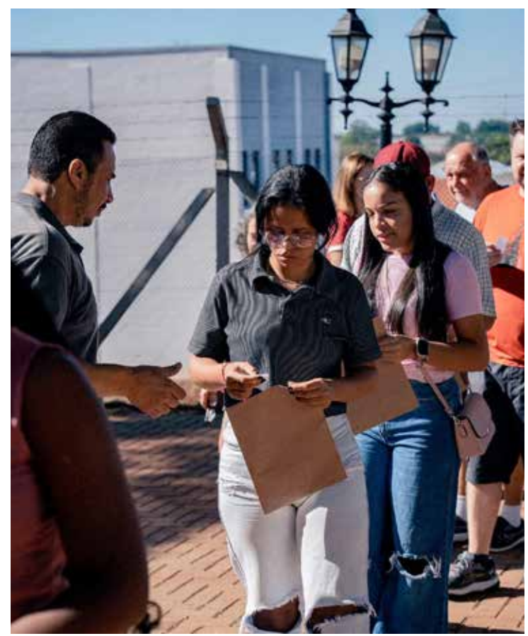
A ação reuniu dezenas de moradores

A ferramenta também permite a geração de um currículo em formato padrão, pronto para impressão. O acesso pode ser feito pelo site da Prefeitura, na aba Serviços, ou diretamente pelo endereço http://pat.holambra.sp.gov.br .