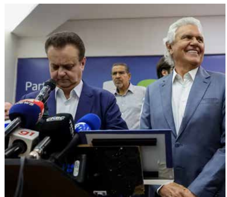
O governador de Goiás, Ronaldo Caiado, teve sua pré-candidatura à Presidência da República oficializada pelo PSD

Recém-filiado ao PSD, Caiado foi escolhido após uma disputa interna com outros nomes da sigla, como os governadores Eduardo Leite e Ratinho Júnior, que desistiu da corrida na semana anterior.