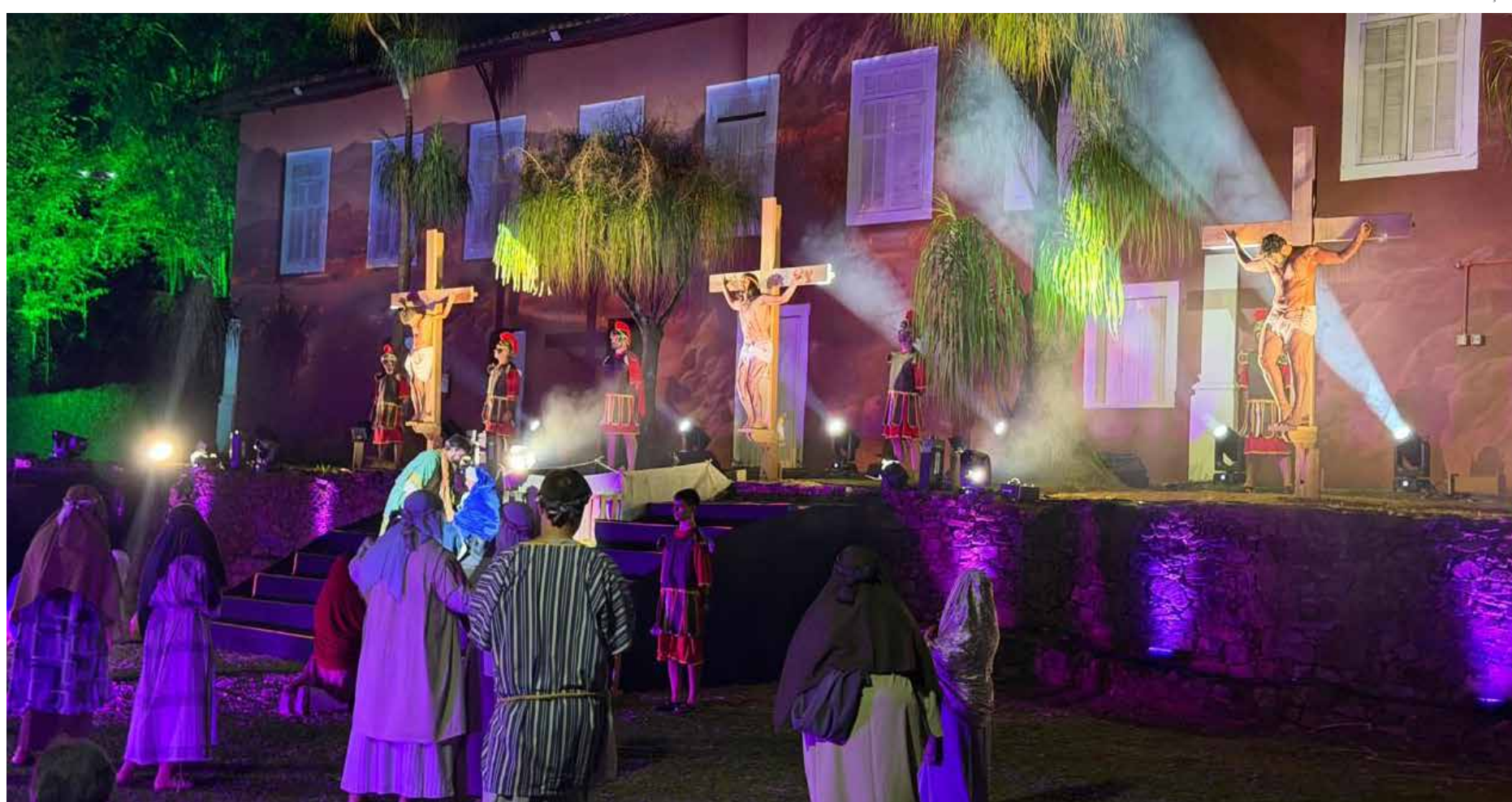
A entrada é gratuita e aberta a toda população