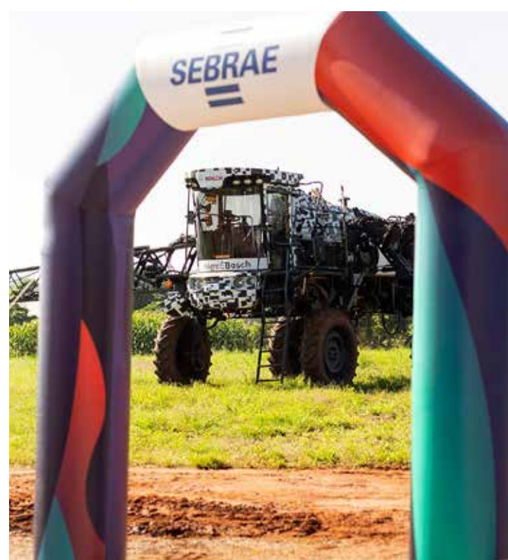
Evento foi promovido pelo Sebrae em quatro cidades da RMC