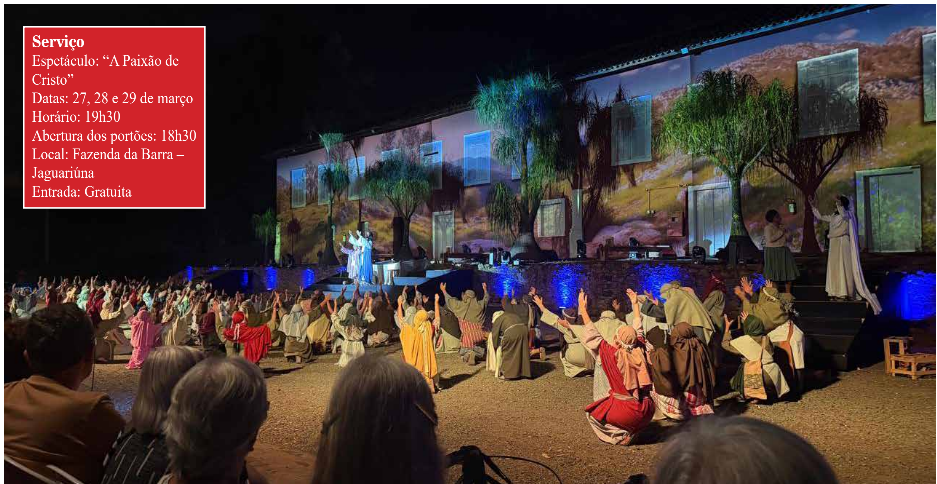
A entrada é gratuita e aberta a toda população