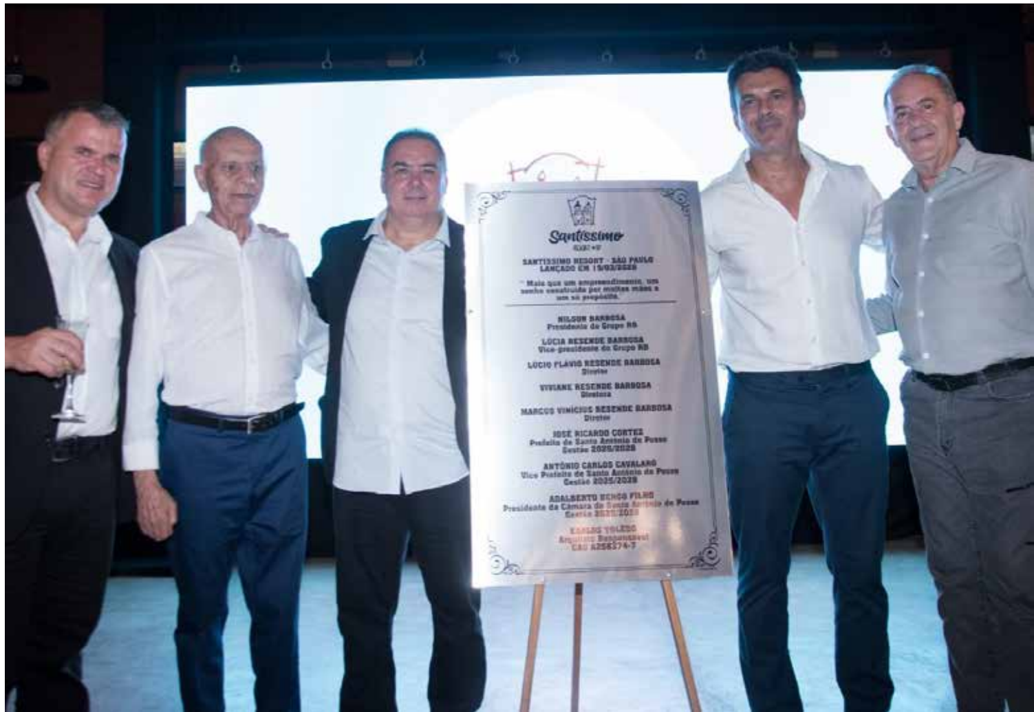
Evento da pedra fundamental ocorreu no Rancho Pegorari, em Santo Antônio de Posse

O projeto também prevê a integração com fornecedores locais, especialmente da cadeia agroalimentar, fortalecendo a economia regional. Produtores rurais do município já são incentivados a se preparar para atender à futura demanda do resort.