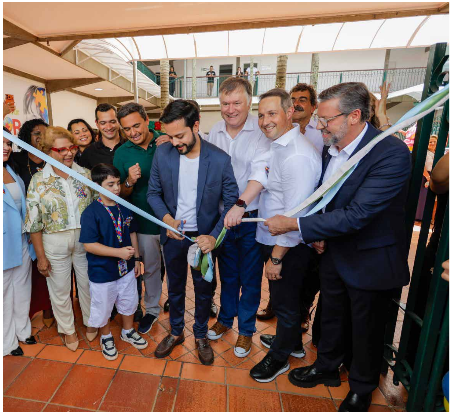
O espaço é dedicado ao cuidado, desenvolvimento e acolhimento de crianças e suas famílias