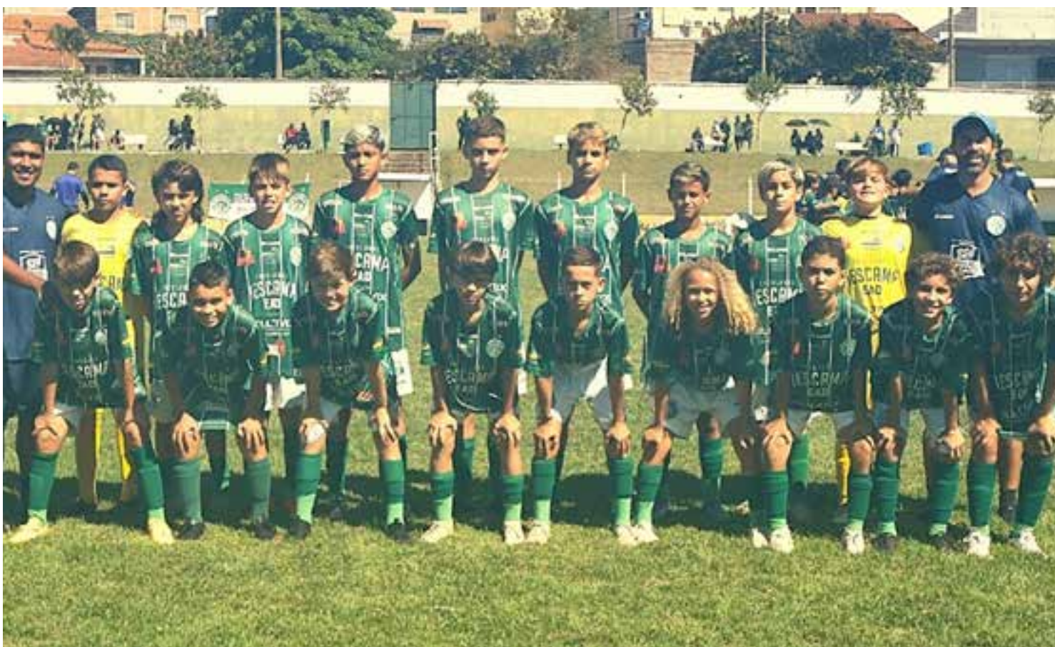
Equipe sub 12 foi a única que venceu o Macabi Holambra