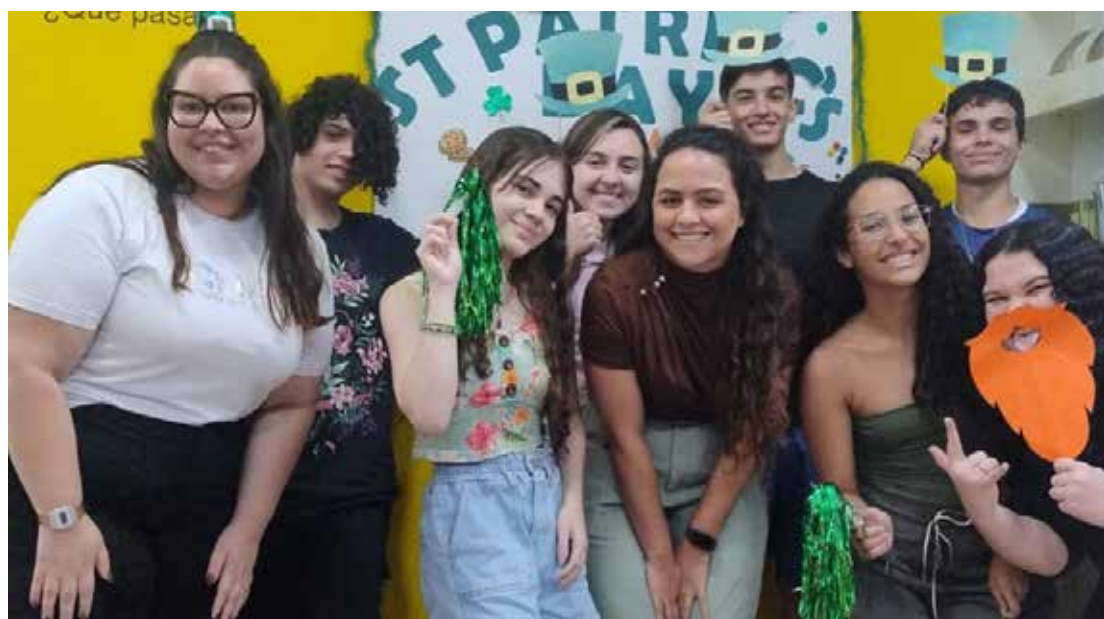
St. Patrick's Day no CNA Jaguariúna

As salas de aula foram ambientadas para o tema e sob a orientação dos professores, os alunos descobriram a trajetória de St. Patrick e o significado dos símbolos irlandeses, como o trevo e o pote de ouro. Com os rostos pintados e muita animação, as crianças participaram de dinâmicas que estimularam a