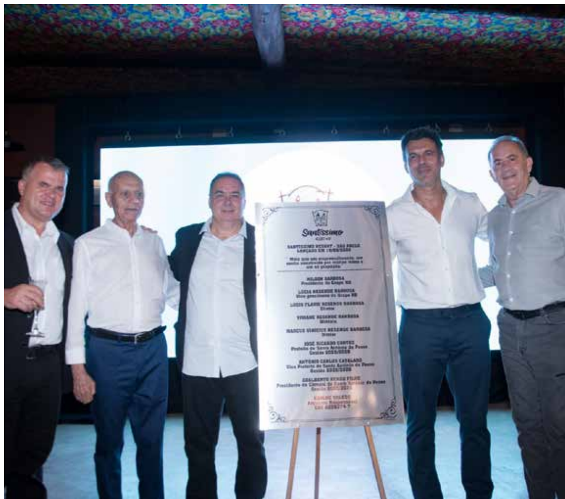
Investimento privado de R$100 milhões marca novo ciclo de desenvolvimento turístico e econômico

Santo Antônio de Posse viveu um momento histórico nesta semana. Em um evento marcado pela harmonia e pela presença de proprietários e representantes do empreendimento, além de