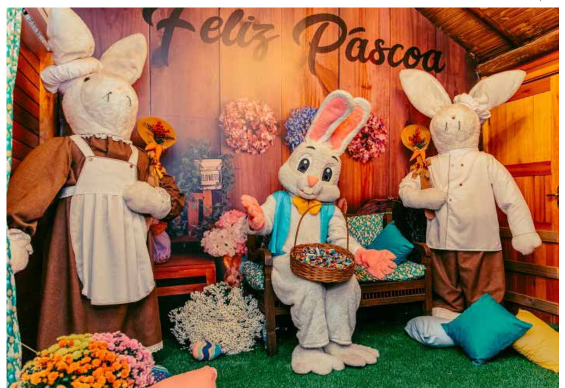
Moradores e visitantes podem participar da programação preparada pela prefeitura

Para encerrar a programação, no sábado, 4 de abril, das 9h às 12h, o Parque Cidade das Crianças recebe a tradicional gincana de Caça aos Ovos. O evento contará também com pintura facial, brinquedos infláveis, distribuição de pipoca e recreação com personagens. A atividade é exclusiva para moradores de Holambra e exige a apresentação do Cartão Cidadão.