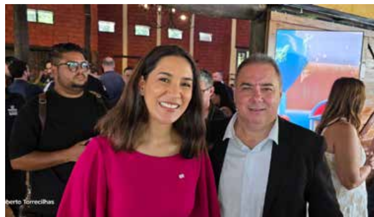
Representante do Estado de São Paulo e o prefeito de Santo Antônio de Posse