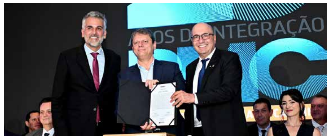
Gustavo Reis, Tarcísio de Freitas e Dário Saadi

O governador de São Paulo, Tarcísio de Freitas, presente na cerimônia, falou sobre o hospital metropolitano, demanda antiga do grupo junto ao governo do estado. "Uma questão fundamental da região é a saúde. O grande pleito dos prefeitos é um hospital regional para a Região Metropolitana de Campinas. Precisa mesmo. E nós vamos fazer", afirma o governador.