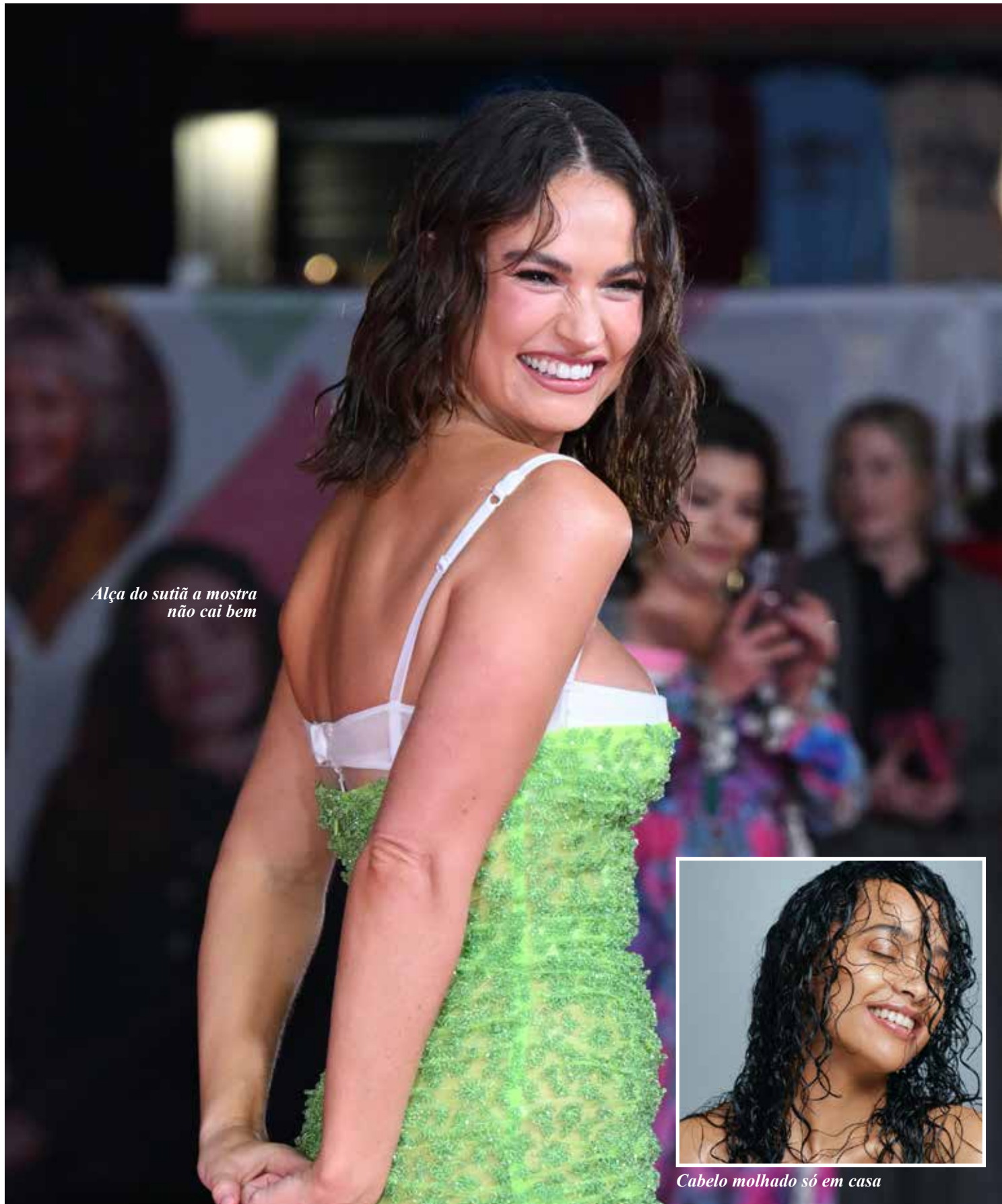
Alça do sutiã a mostra não cai bem