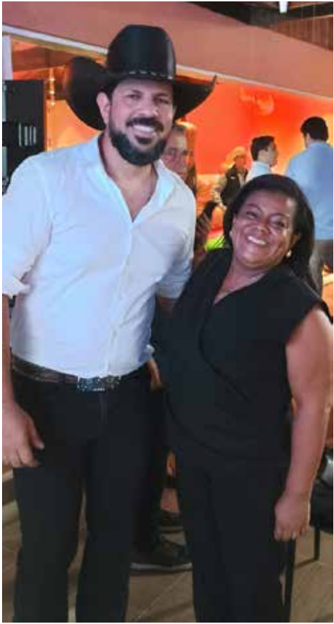
Meu momento fã no click com o cantor Sorocaba

Noite de entrega no Casarão Imperial Eventos onde Léo Sanches, Ricardo Caporossi e o cantor Sorocaba recebem a missão de embaixadores do município.