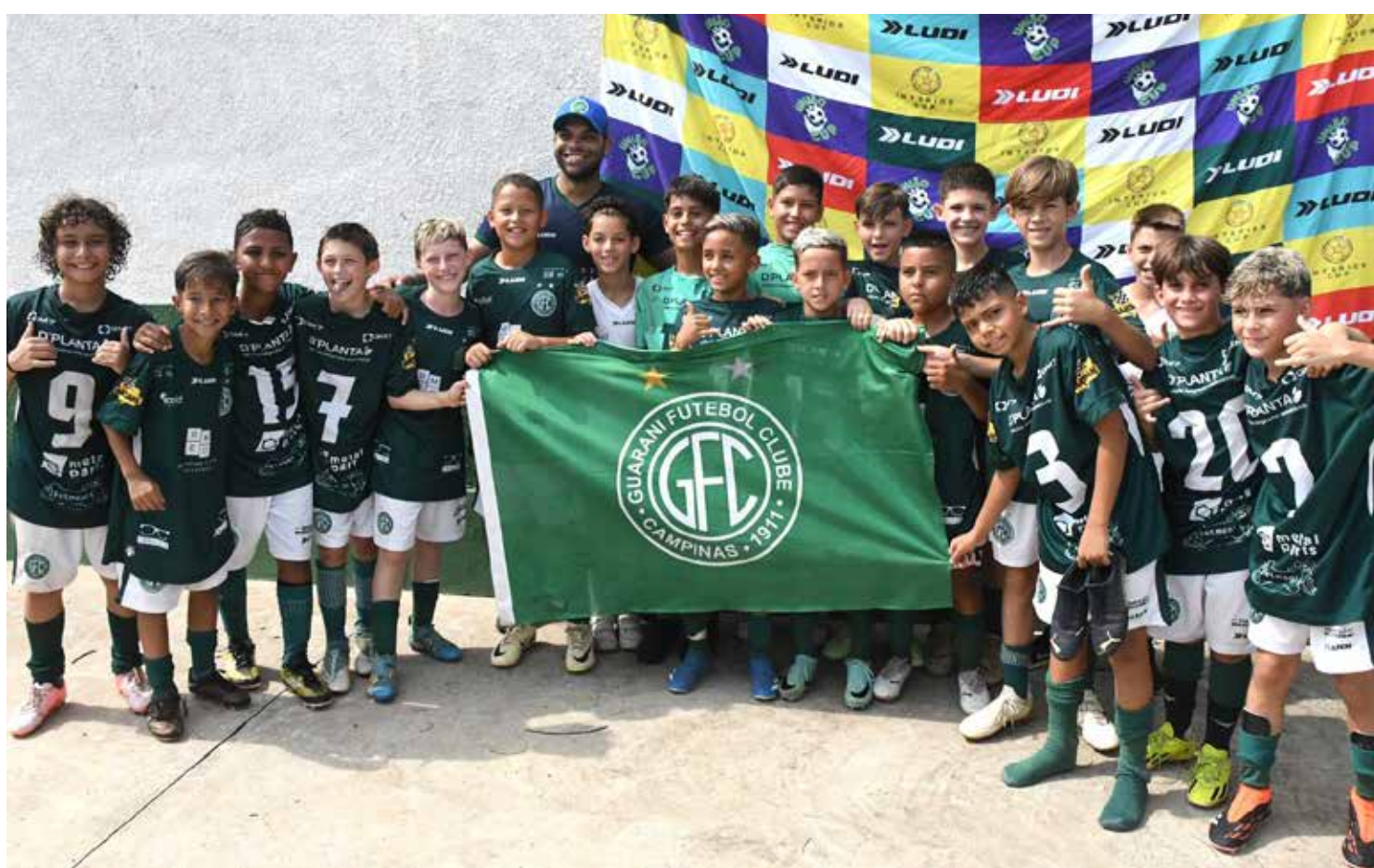
Competição começa na próxima semana com a participação de jovens de 9 a 14 anos

As equipes vencedoras seguem para a próxima fase denominada semifinais, as quais, serão disputadas também no sistema de ida e volta, permanecendo a vantagem das melhores campanhas na classificação geral de decidirem em casa e jogarem por dois resultados iguais, dessa forma, as equipes que forem derrotadas irão disputar as finais da série prata e as equipes vencedoras irão disputar as finais da série ouro. A co-