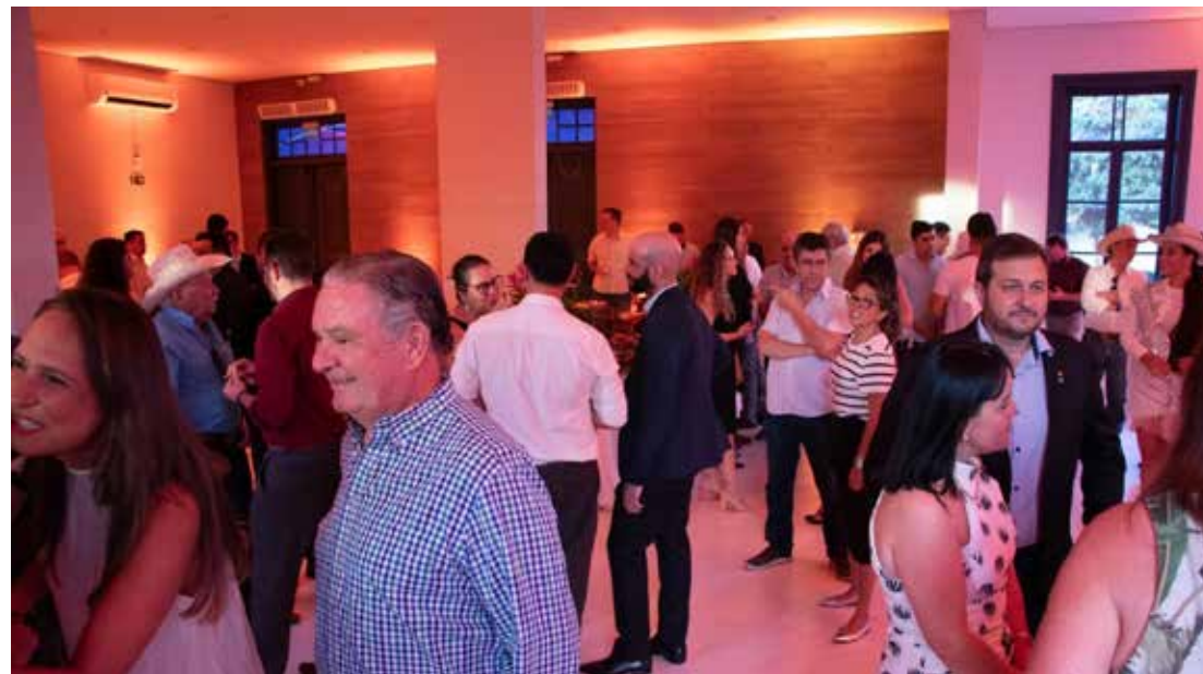
Noite de sucesso sediada no Casarão Imperial Eventos que esse ano comemora 130 anos!