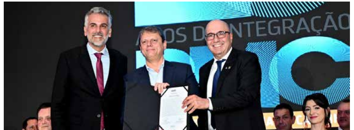
O evento também foi palco do lançamento do livro dos 25 anos da Região Metropolitana de Campinas