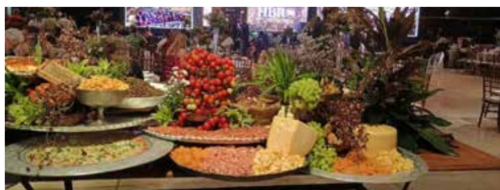
Serviço Buffet Pirola sempre sucesso em nossos eventos