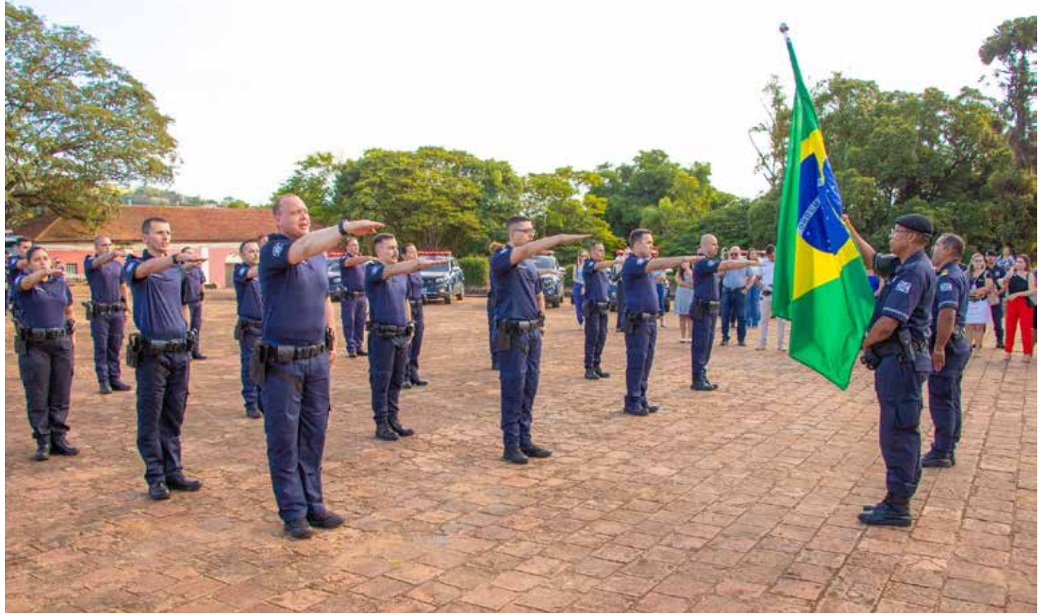
Os novos agentes terão a missão de garantir a ordem e a segurança na cidade

“Hoje é um dia muito especial e de grande significa-