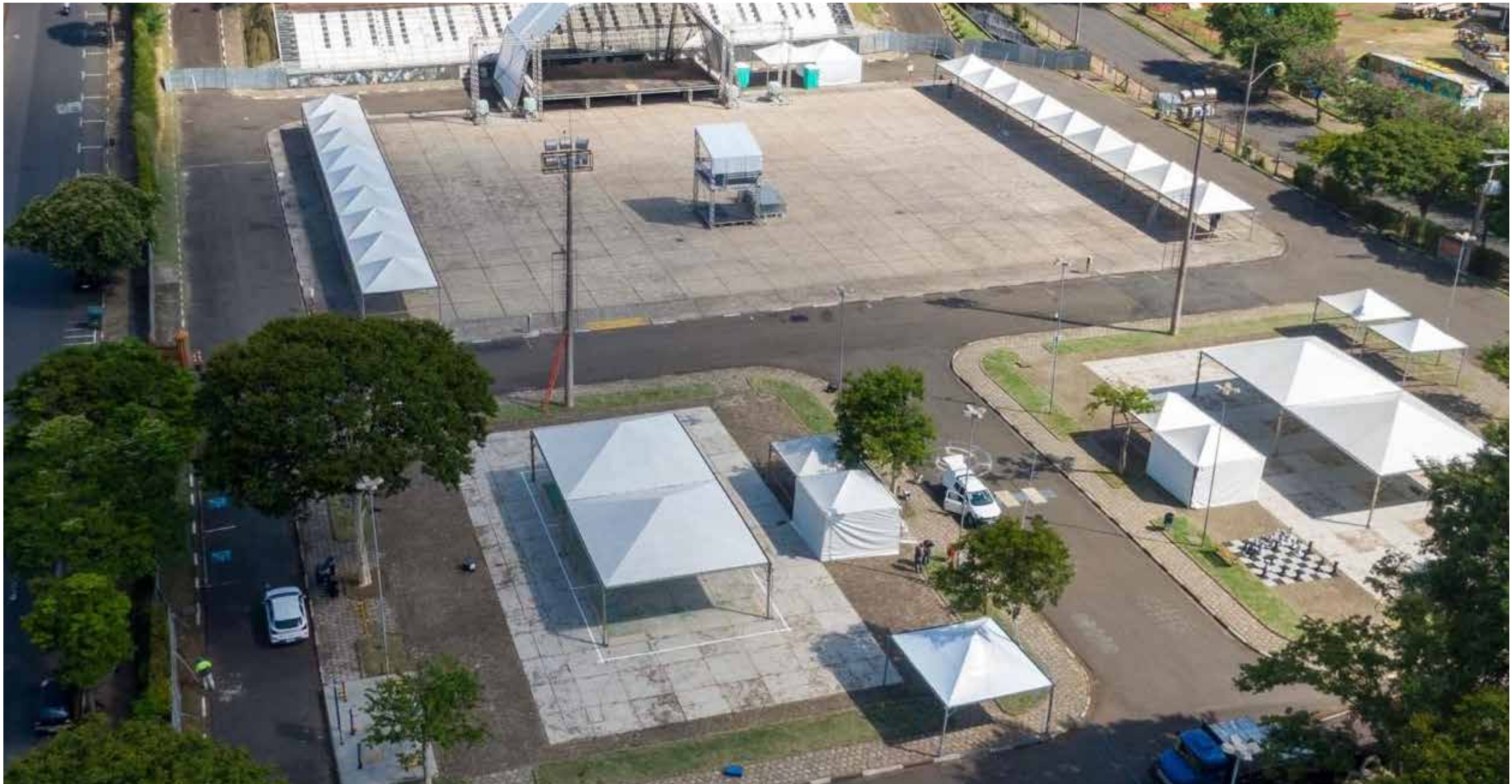
O Carnaval de Jaguariúna vai além da diversão momentânea – ele tem um impacto significativo na economia local, gerando renda para muitas famílias

O CarnaJaguá 2025 chegou com força total e está agitando os foliões em Jaguariúna. O evento, que teve início nesta sexta-feira, 28, segue pelos próximos dias com uma programação extensa, incluindo apresenta-