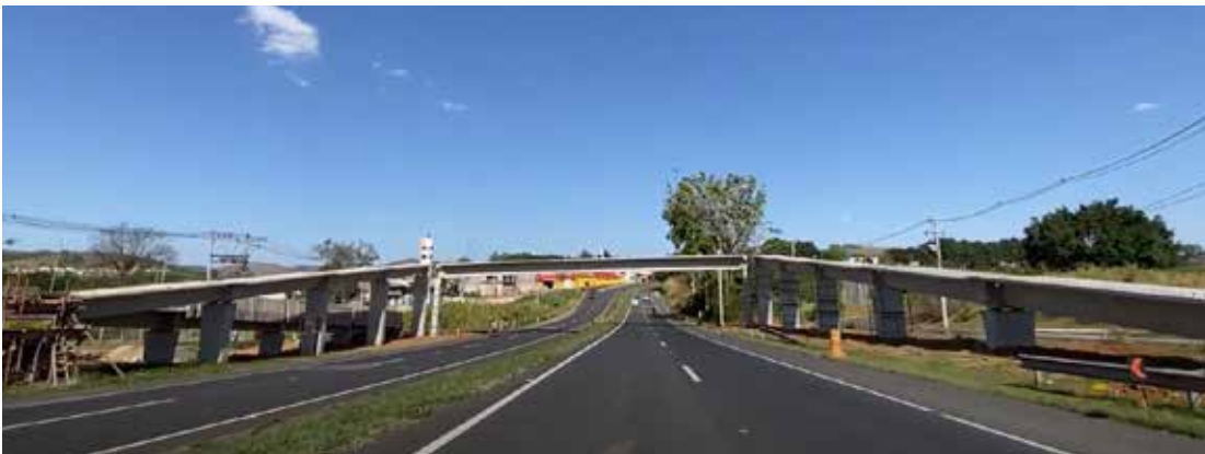
O debate é aberto e ocorre no dia 06 de março, às 19h, no Paço Municipal

A Prefeitura de Amparo realiza no próximo dia 06 de março um debate municipal para apresentar e debater junto à população os