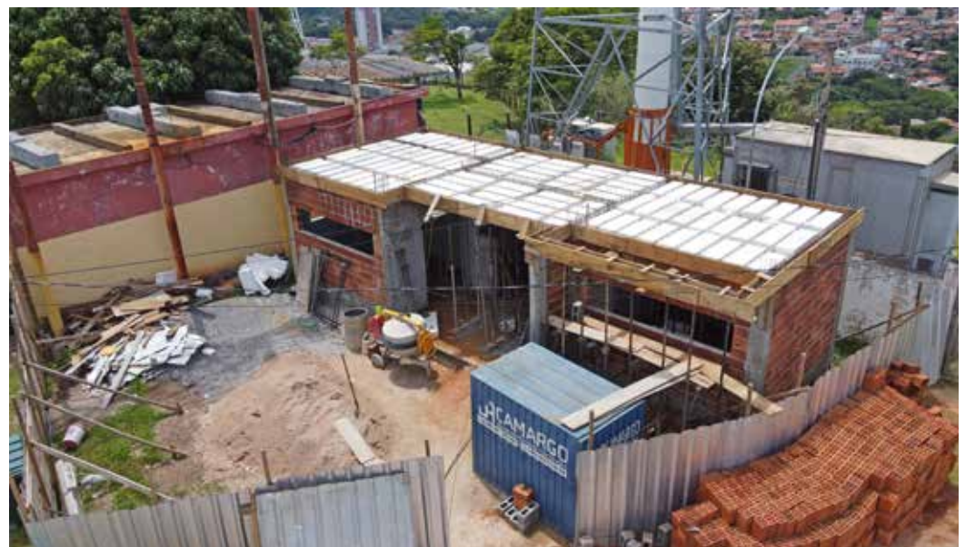
Para a construção destes novos sanitários, com total acessibilidade, serão investidos R$403.446,90

A Prefeitura de Pedreira, representada por suas secretarias municipais de Divulgação e Turismo, e de Planejamento, e o Governo do Estado por meio de sua Secretaria de Turismo e Viagens, estão desenvolvendo a Fase II do projeto de Revitalização do Morro do Cristo.