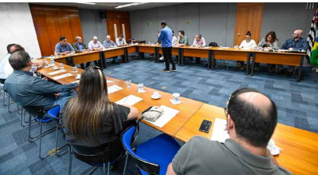
Reunião ocorreu no início desta semana

O Prefeito de Campinas, Dário Saadi, junto com o Secretário de Finanças da cidade, Aurílio Caiado, recebeu nesta semana, representantes de prefeituras de cidades da Região Metropolitana de Campinas (RMC) para discutir a Lei Federal 208/2024, que trata da securitização ou venda dos recebíveis da Dívida Ativa.