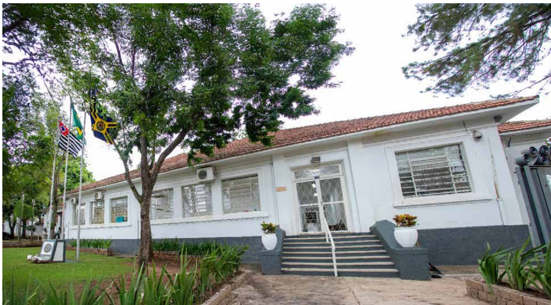
A unidade acolherá 391 alunos do Ensino Fundamental I