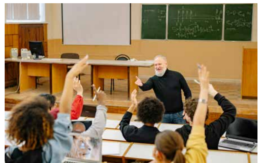
Estudantes passarão por processo seletivo

A Prefeitura de Holambra está com as inscrições abertas para o processo seletivo do ProUni Municipal, programa de bolsas de estudos para alunos de ensino superior