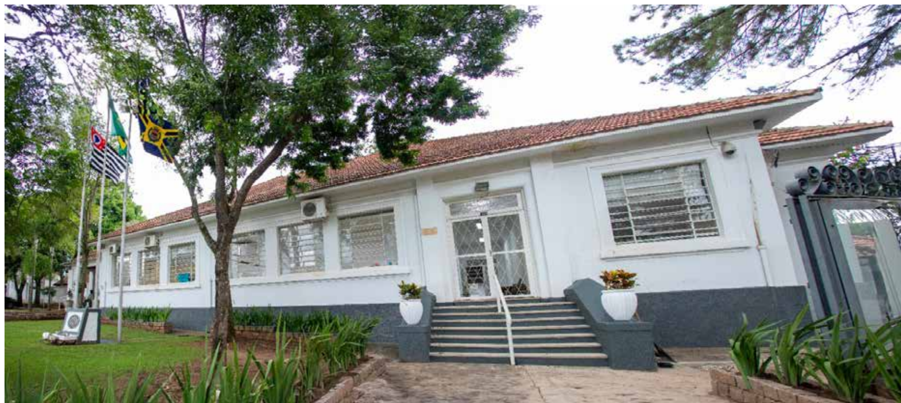
A unidade acolherá 391 alunos do Ensino Fundamental I

A iniciativa traz de volta à educação pública municipal um prédio histórico que por muitos anos foi sede dessa unidade