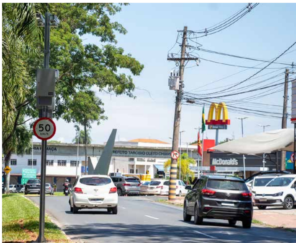
Radares estão próximos ao Mc Donalds

ainda de acordo com a secretaria, é reforçar a segurança viária, coibir o excesso de velocidade e evitar acidentes. Atualmente, o município possui nove equipamentos redutores de velocidade instalados nas principais vias da cidade.