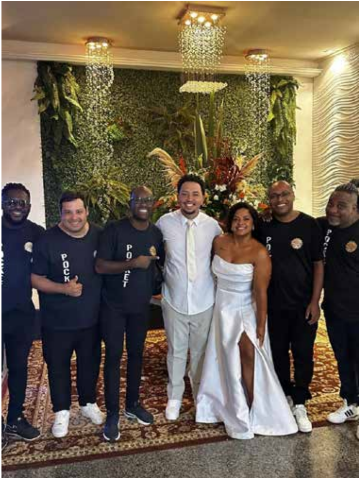
Festa ao embalo da Banda Pocket Samba