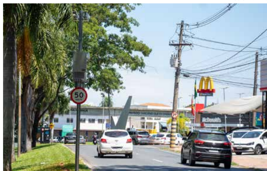
A velocidade máxima permitida nesses locais é de 50 km/h

A Prefeitura de Jaguariúna, por meio da Secretaria Municipal de Mobilidade Urbana, instalou dois pontos de radar fixo na Avenida Prefeito La-