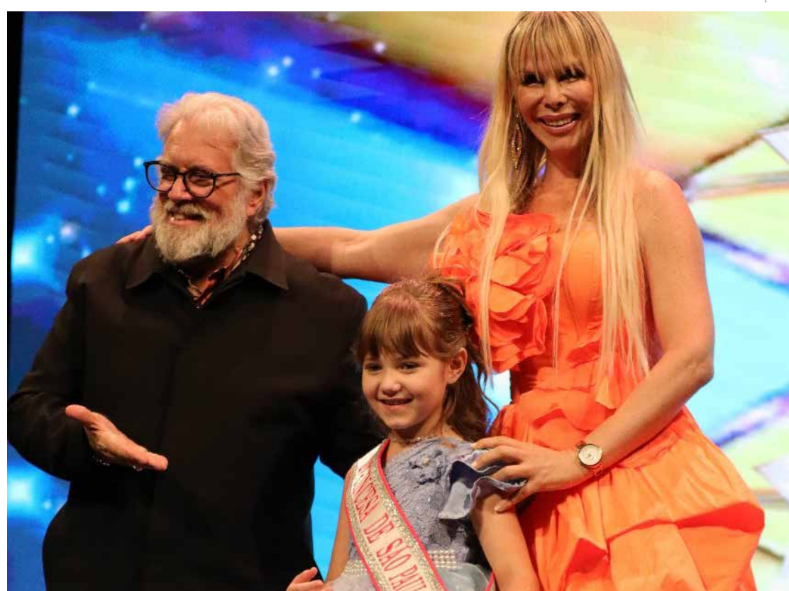
Represente sua cidade no maior e mais luxuoso concurso estadual de miss para crianças e adolescentes

Podem se inscrever jovens de 4 a 25 anos, com a oportunidade de brilhar no concurso e contribuir para uma causa solidária.