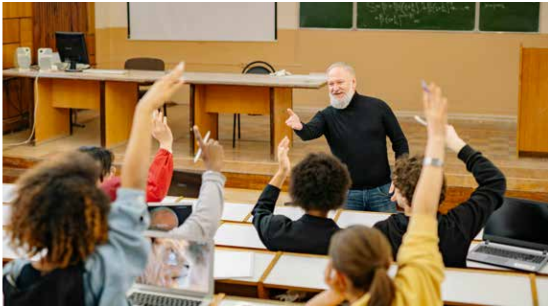
Estudantes passarão por processo seletivo

Estudantes tem até o dia 14 de fevereiro para se inscrever no programa e bolsas de estudo