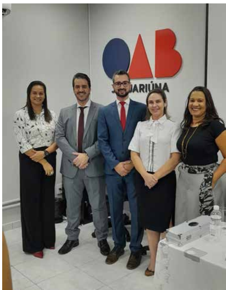
Nova diretoria tem como compromisso valorizar a advocacia e lutar pelos direitos dos advogados e cidadãos