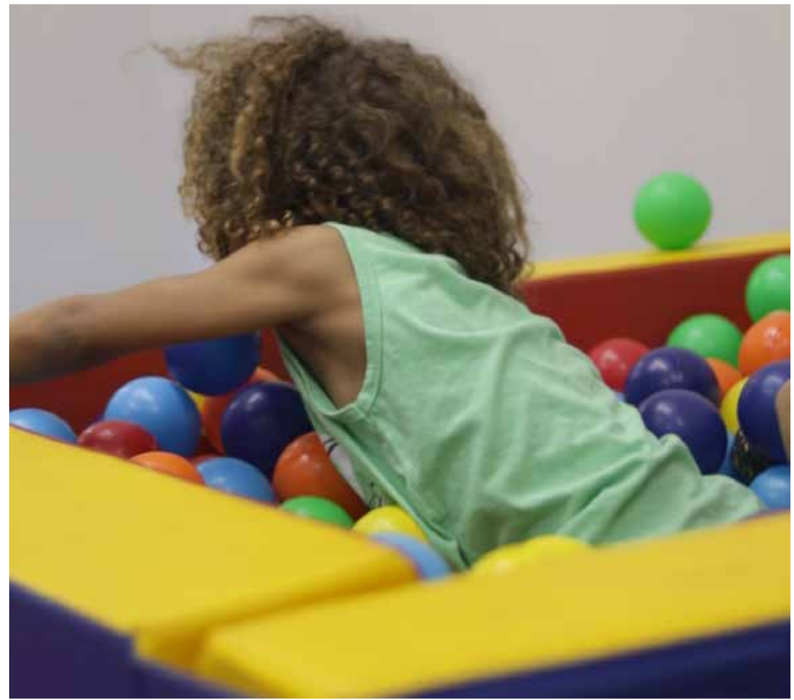
O atendimento especializado ocorre três vezes por semana

No primeiro ano, foram mais de 2.400 atendimentos realizados pelo Centro de Atenção ao Autista, para o público. Além disso, os pais receberam mais de 80 encontros com a equipe contratada pela Prefeitura de Amparo.