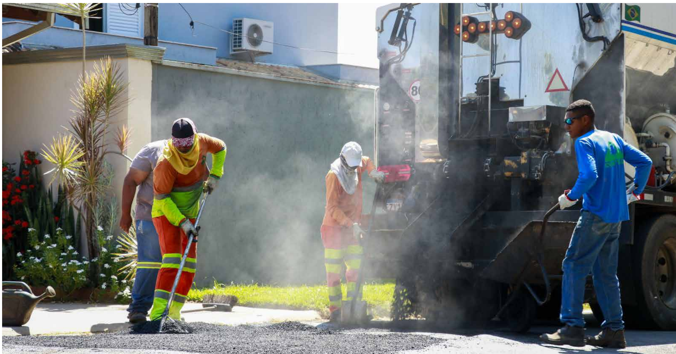
Os trabalhos começaram na Avenida Pacífico Moneda e se estenderão a importantes pontos da cidade

A Prefeitura de Jaguariúna segue com seus esforços contínuos de manutenção e zeladoria urbana.