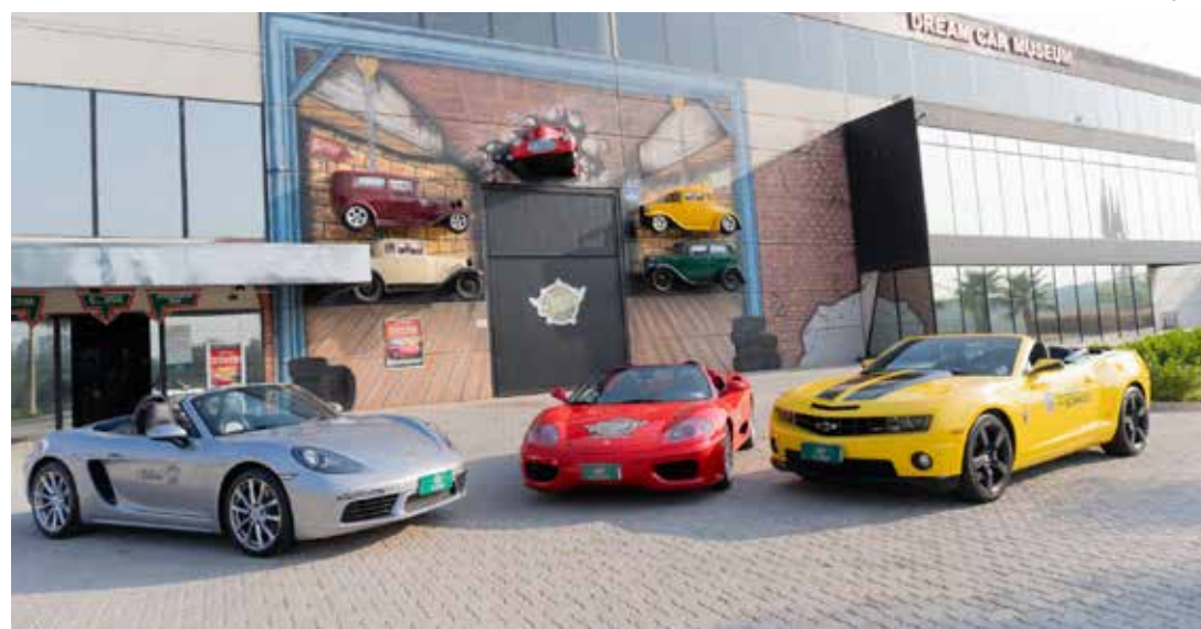
Em janeiro, ocorrerão dois encontros de veículos – neste domingo e no dia 26