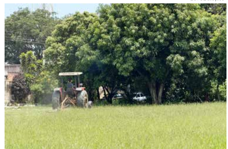
Secretaria de Obras chama atenção para que moradores colaborem, descartando resíduos de maneira correta e respeitando o calendário de coleta

Conforme a Lei Nº3.105, é proibido o descarte de resíduos e entulhos às margens de rodovias estaduais, estradas vicinais, e estradas de servidão, pavimentadas ou não, por meio de veículos pesados. A infração da lei gerará multas acima de R$2.000.