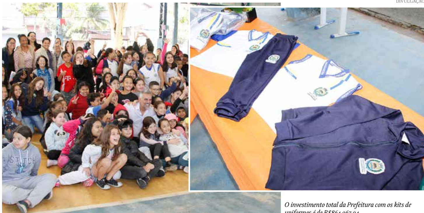
O investimento total da Prefeitura com os kits de uniformes é de R$864.967,94

Segundo a Secretaria de Educação, o investimento total da Prefeitura com os kits de uniformes é de R$864.967,94. Ainda de acordo com a secretaria, a distribuição gratuita do uniforme escolar reforça o compromisso da administração com o ensino público de qualidade na cidade.