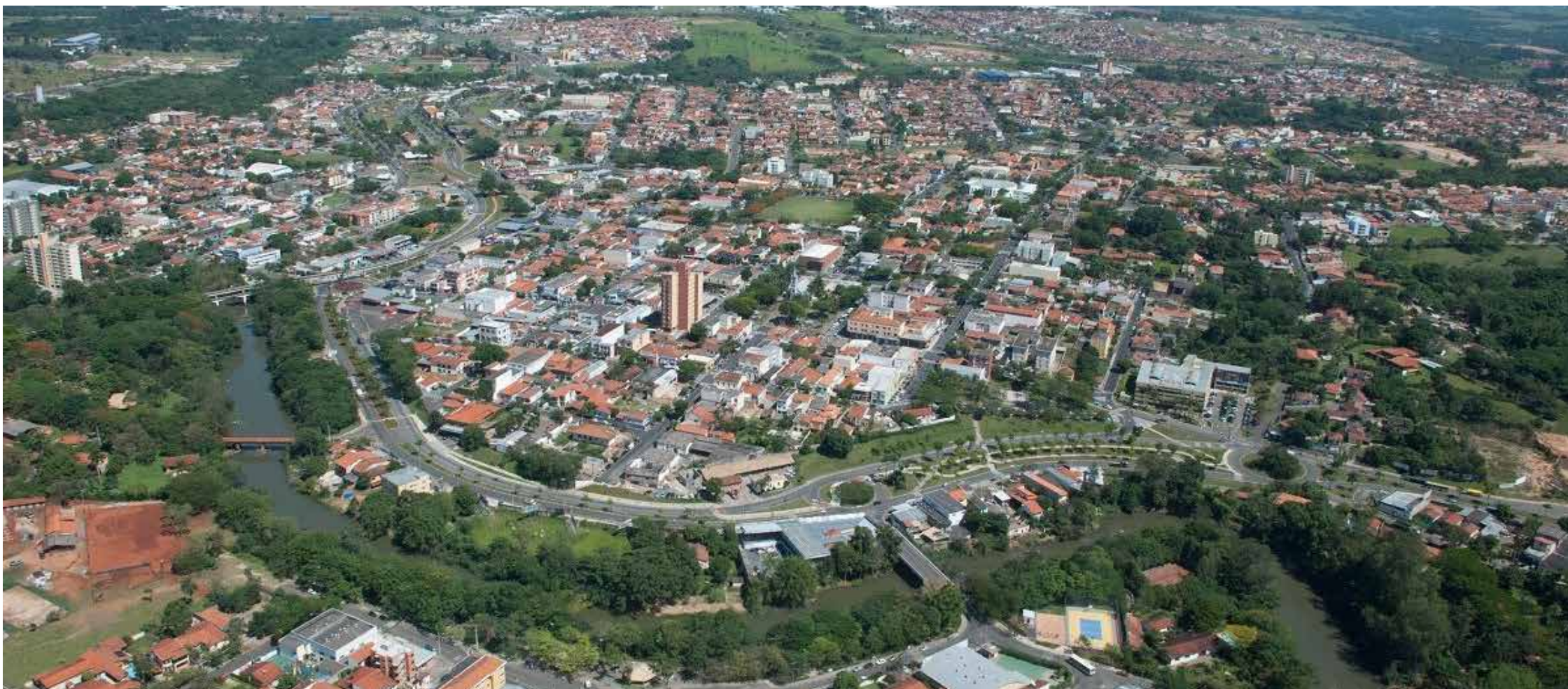
Mais uma vez, Jaguariúna conseguiu o grau de excelência no controle de todos os quesitos avaliados pelo índice Capag

A Prefeitura de Jaguariúna obteve mais uma vez o melhor índice de avaliação da capacidade de pagamento (Ca-