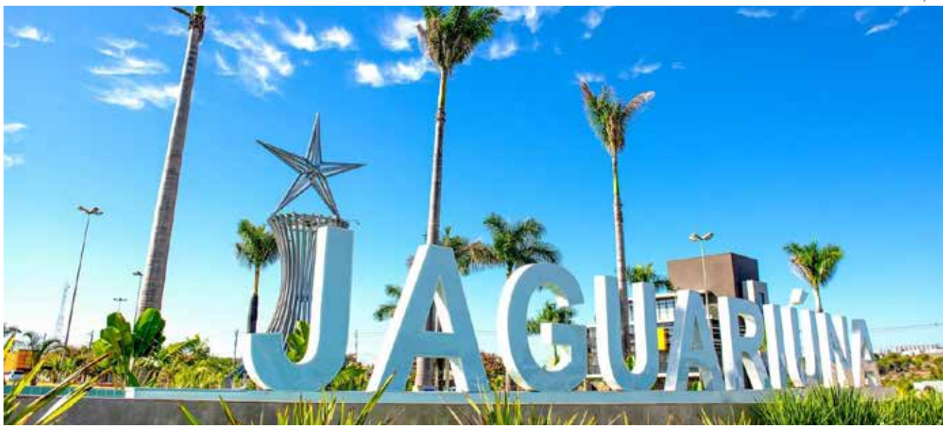
Fórum também certifica Prefeituras Inovadoras na região

Jaguariúna sedia, no dia 10 de julho, o Fórum de Cidades Digitais e Inteligentes da Região Metropolitana de Campinas, en-