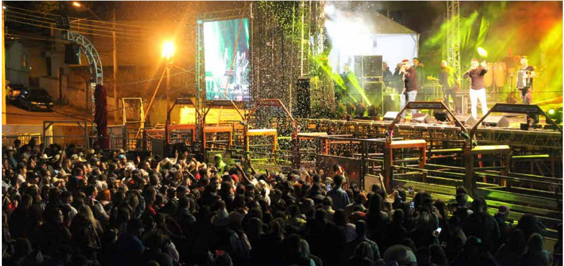
Esta é a 34ª edição da Festa do Peão de Morungaba

Abrindo a série de atrações sertanejas, o show de Leo e Raphael promete agitar a festa com seus hits dançantes. Na noite da sexta-