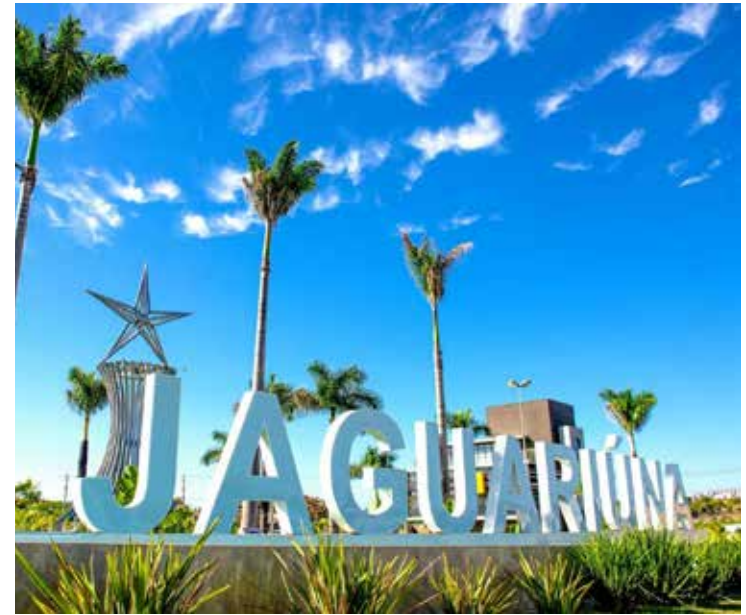
Fórum também certifica Prefeituras Inovadoras na região

Durante o Fórum de Cidades Digitais e Inteligentes, a Rede Cidade Digital também reconhecerá as Prefeituras Inovadoras da