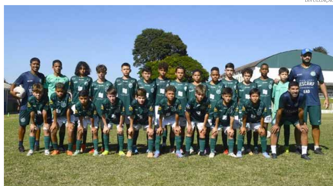
Categoria sub 12