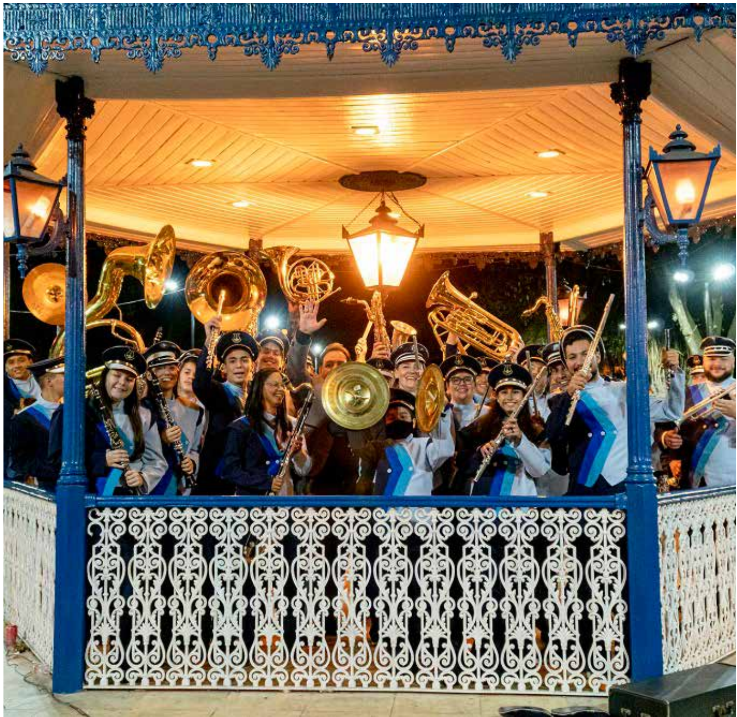
A festa é promovida pela Corporação, com apoio da Prefeitura, por meio da Secretaria de Cultura & Turismo, e da EPTV Campinas

Arraiá Sinfônico Concerto da Orquestra Sinfônica Jovem com participação de grandes nomes do sertanejo Data: segunda-feira, 24 de junho Horário: A partir das 19h Local: Balneário Municipal Realização: Corporação Musical 24 de Junho Apoio: Prefeitura de Artur Nogueira e EPTV Campinas