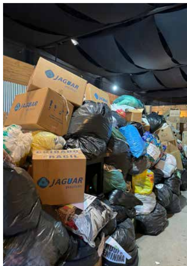
Ao menos sete caminhões carregados com doações já saíram de Jaguariúna com destino ao Rio Grande do Sul