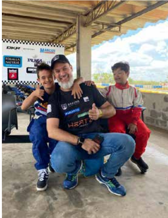
Kart Terapia em Jaguariúna

Os veículos utilizados na terapia são projetados para dois lugares e em diferentes modos de adaptação – como se fossem dois karts