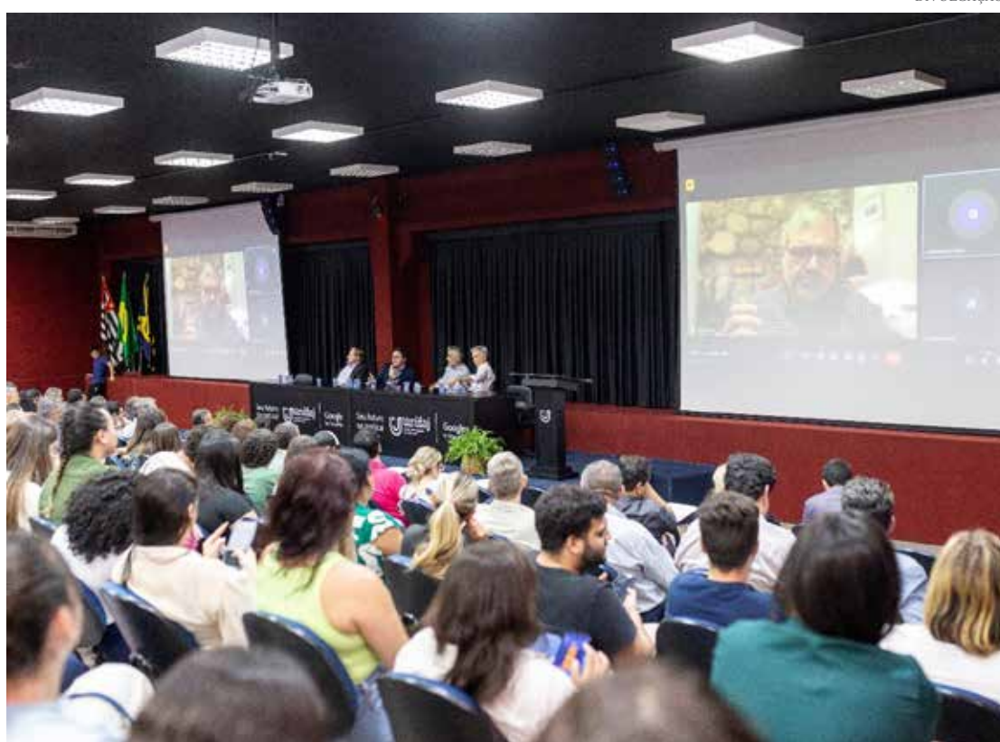
O lançamento do hub marcou as comemorações do aniversário de 25 anos do Grupo UniEduK

O lançamento do hub, que marcou ainda as comemorações do aniversário de 25 anos do Grupo UniEduK, ocorreu na noite de segunda-feira, 06, e contou com a presença de membros do centro universitário e do InovaEduK; além de autoridades locais e profissionais renomados das áreas da saú-