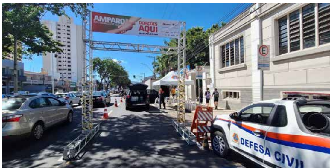
Entregue a sua doação na frente da prefeitura de Amparo, das 7h às 19h

Solidariedade de Amparo às secretarias municipais de Segurança Pública, Defesa Civil e Trânsito e Desenvolvimento Social e Cidadania. Diversos órgãos e entidades se uniram a essa causa, incluindo o Exército Brasileiro, a Rádio Cultura, a Rádio Difusora, Cidades das Águas, Creative Som - 360 Gustavo Botinha Artes Gráficas e a Diocese de Amparo, demonstrando a força e a solidariedade da comunidade amparense.