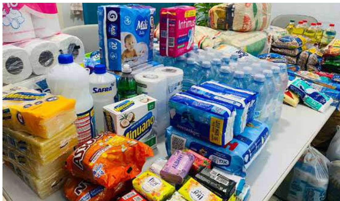
Os itens serão recebidos de segunda a sexta-feira, das 8h às 12h e das 13h às 17h

-Fundo Social de Solidariedade - Rua Nossa Senhora das Dores, 326, Centro -Sede da Guarda Civil Municipal (GCM) - Rua 10 de Abril, 629, Centro -Casa da Agricultura - Rua Nossa Senhora das Dores, 325, Centro -Todos os Postos de Saúde (procure o mais próximo da sua casa)