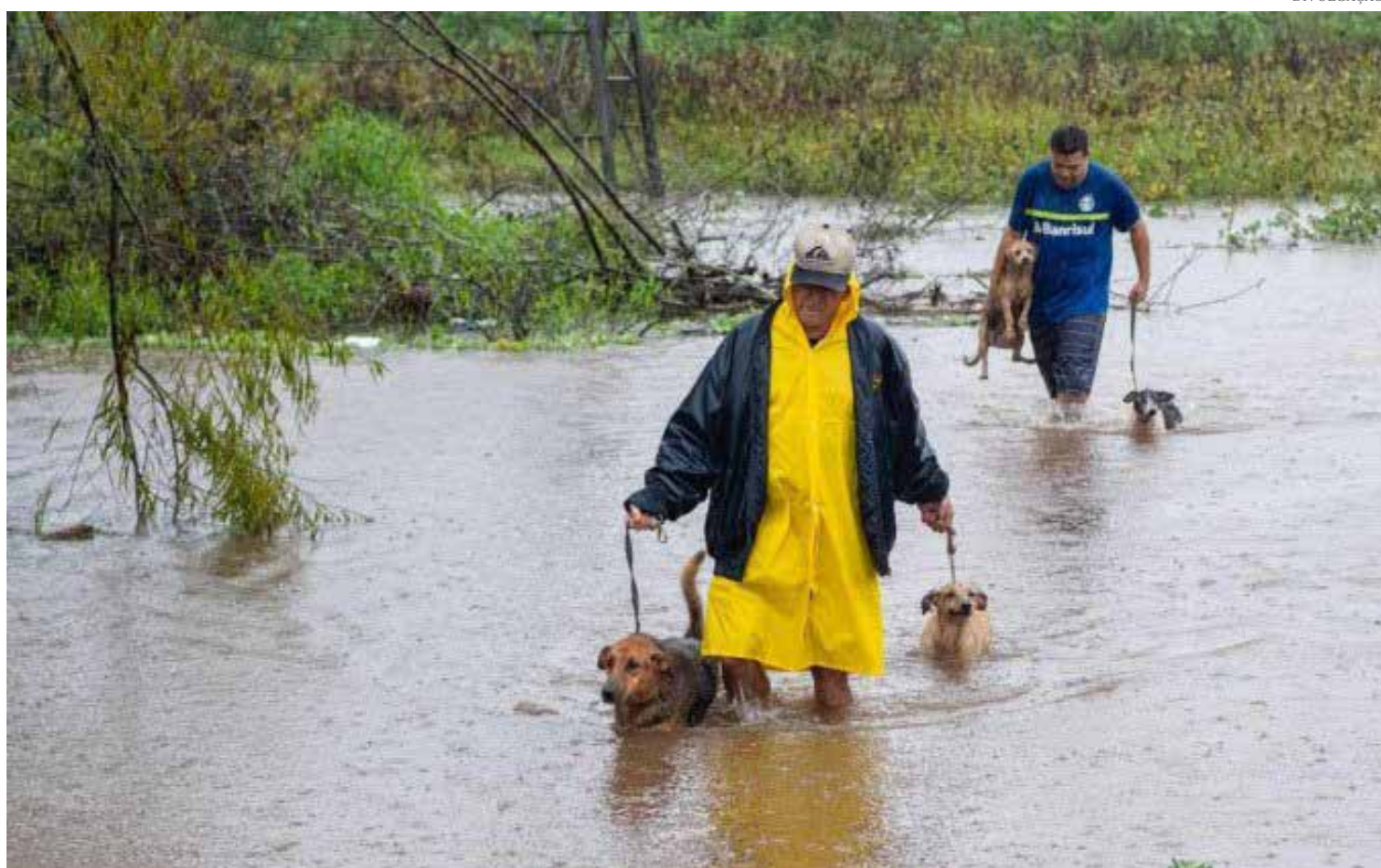
De cães a cavalos: quase 10 mil animais já foram resgatados desde o começo das enchentes no Rio Grande do Sul

Além disso, é importante considerar o bem-estar dos animais durante o resgate, garantindo que sejam manuseados com cuidado e que recebam os cuidados