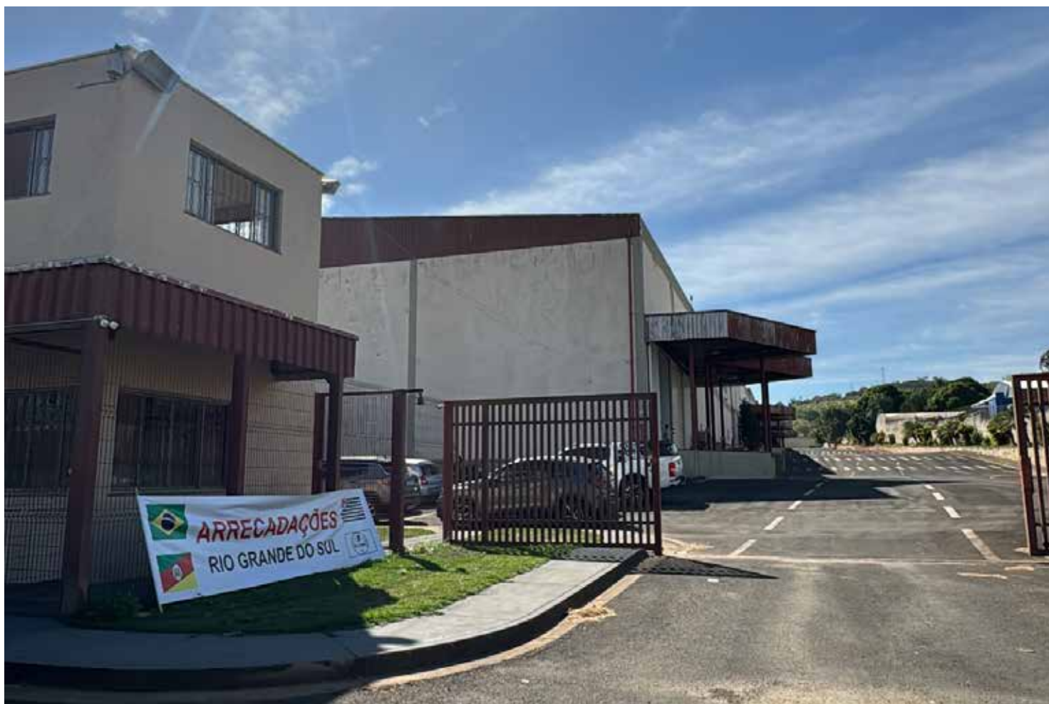
Ponto de arrecadação e distribuição de doações ao RS localizado na Rua Maranhão, nº1465

peza dos abrigos e locais onde a água já abaixou. Fraldas infantis, fraldas geriátricas, absorventes,