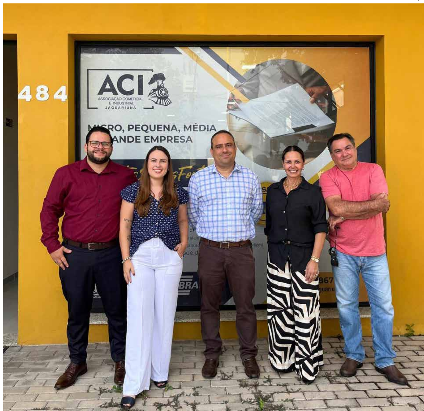
Parceria entre a ACI Jaguariúna e EWM Assessoria

A programação completa do evento "Dia de Rainha" será divulgada em breve nas redes sociais da ACIJ e da EWM Assessoria.