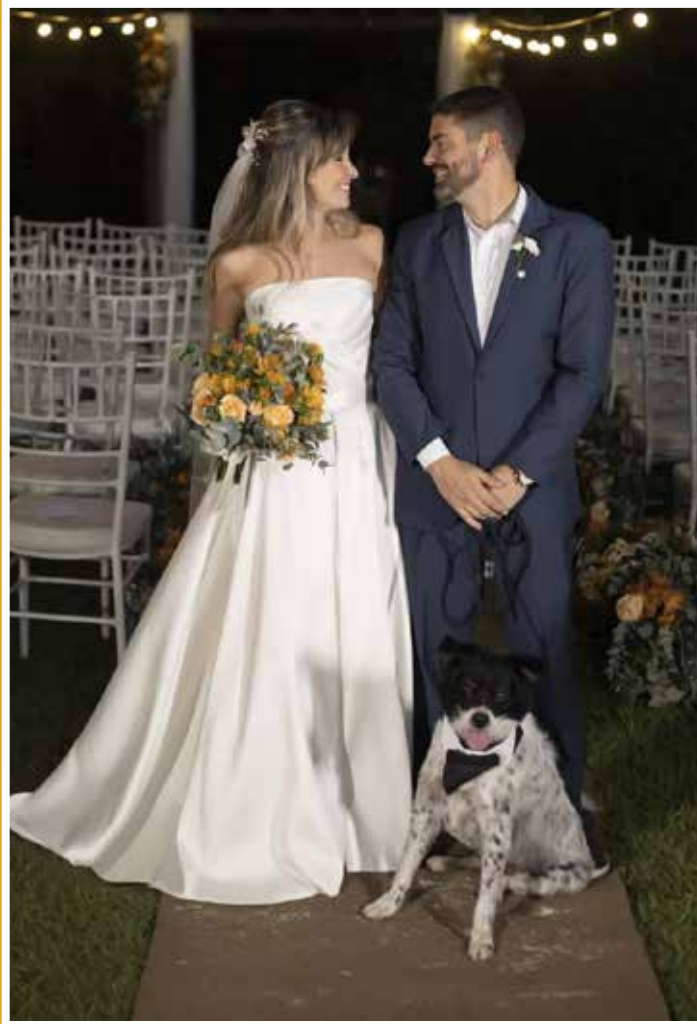
Cerimônia e recepção realizadas em 13/04 no Floriada Eventos por Cerimonial Murer Assessoria ao casal que reside em São Paulo.