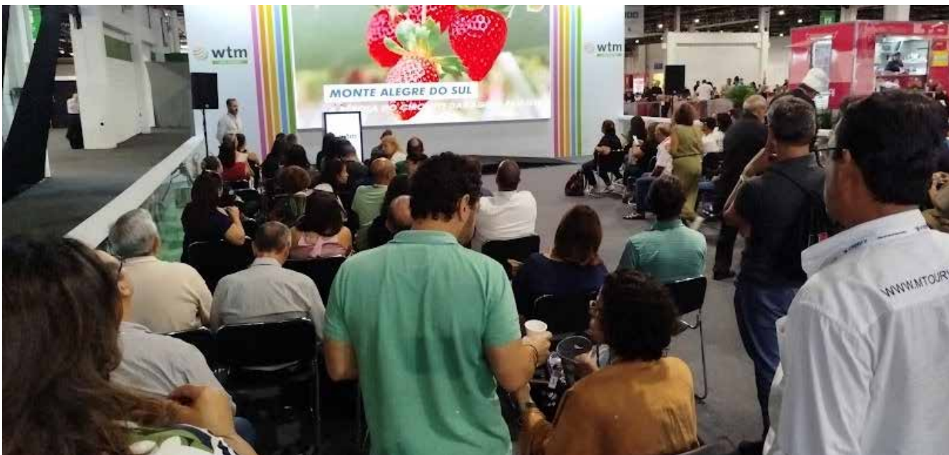
A WTM Latin America recebeu mais de 30 mil profissionais da indústria de viagens

O Consórcio Circuito das Águas Paulista (CICAP) marcou presença na Feira de Viagens e