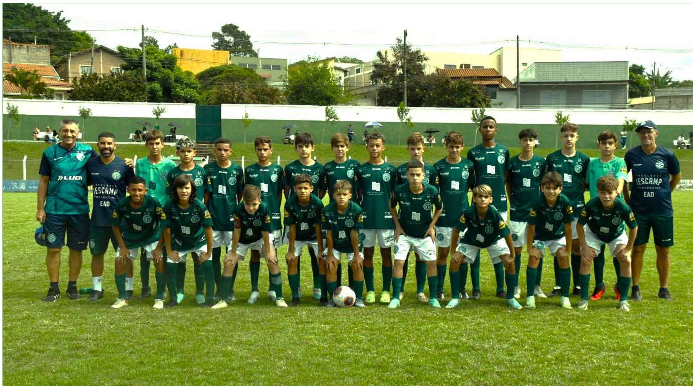
Equipe sub 13 do Guarani FC

No final de semana passado os garotos da base do Guarani FC receberam as equipes do Sociapan/Base no Estádio Leonardo Frare em Morungaba. Na oportunidade, conquistaram excelentes resultados sendo, quatro vitórias e um empate.