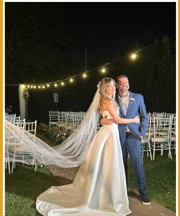
Cerimônia ao ar livre