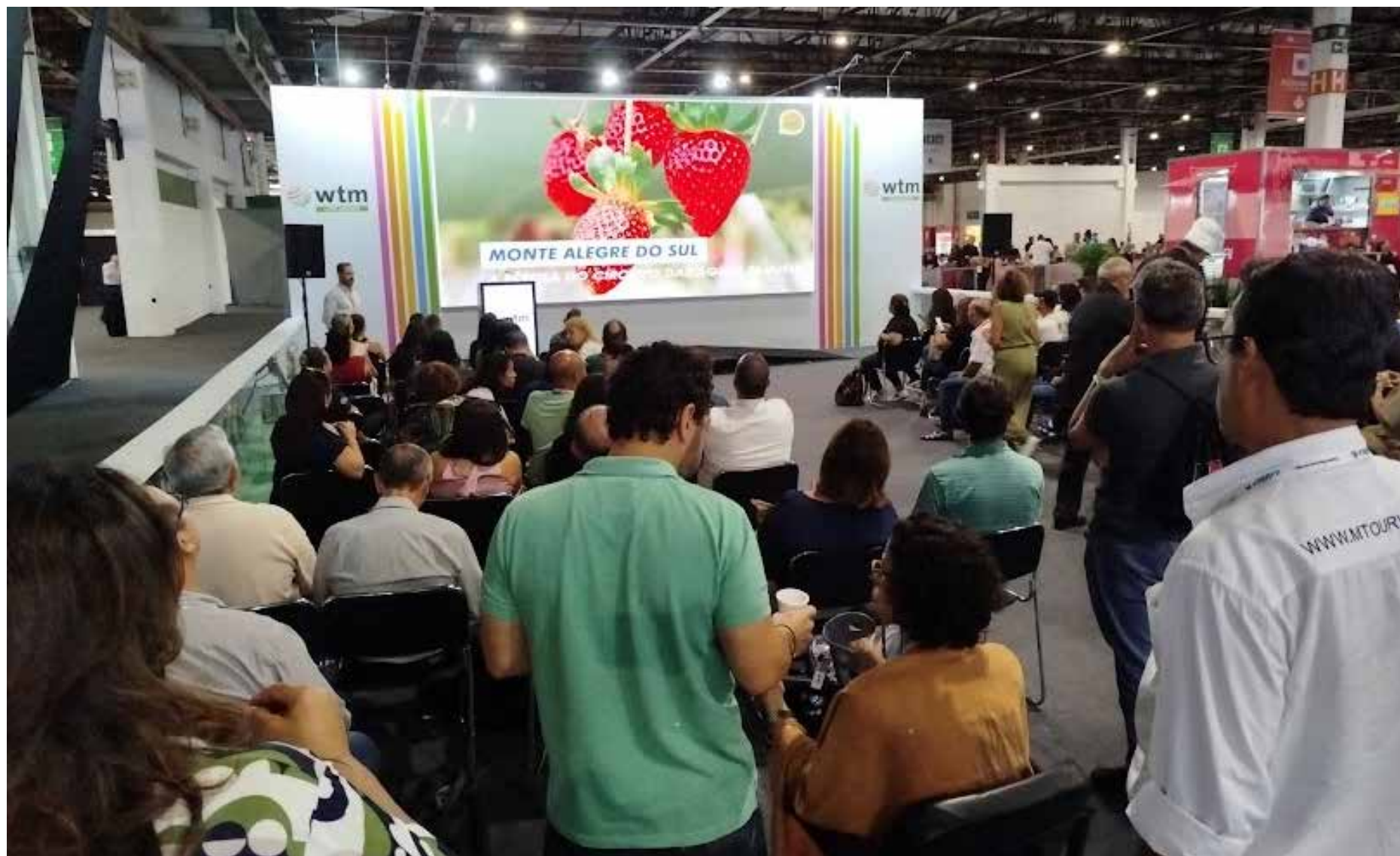
A WTM Latin America recebeu mais de 30 mil profissionais da indústria de viagens

A WTM Latin America recebeu mais de 30 mil profissionais da indústria de viagens entre segunda e quarta-feira (15 e 17/04), proporcionando uma oportunidade para o setor fortalecer a posição da América Latina no cenário global do turismo. O evento ocorreu no Expocenter Norte, em São Paulo. Participaram agentes em viagens aéreas