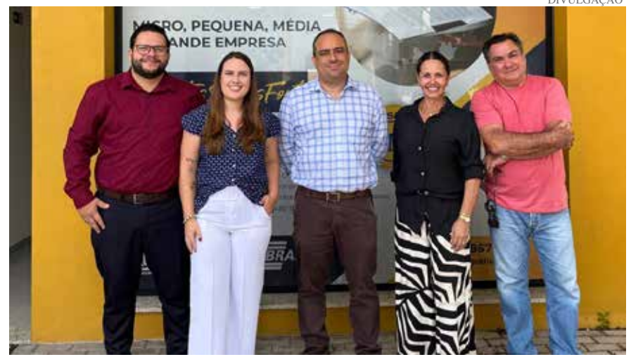
Parceria entre a ACI Jaguariúna e EWM Assessoria

A Associação Comercial e Industrial de Jaguariúna (ACIJ) e a EWM Assessoria anunciaram nesta semana que estão juntas, em uma super parceria de marketing digital. A união