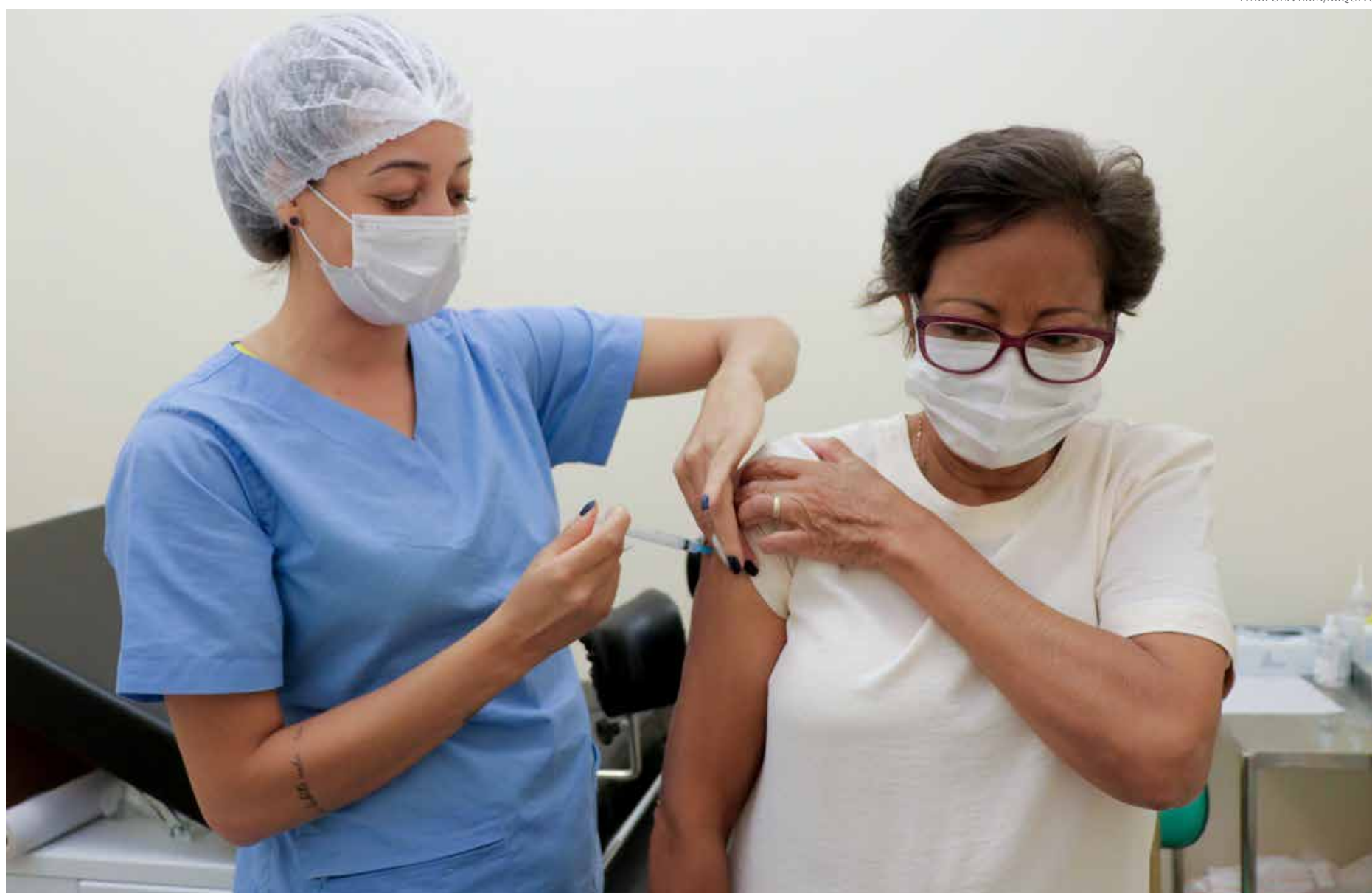
Primeira fase da campanha vai até 31 de maio

Segundo a Secretaria de Saúde de Jaguariúna, “a vacinação contra a influenza é considerada a melhor estratégia de prevenção contra a gripe e possui capacidade de promover imunidade durante o período de maior circulação dos vírus, reduzindo o agravamento da doença, as internações e o número de óbitos, além de reduzir a sobrecarga nos serviços de saúde”.