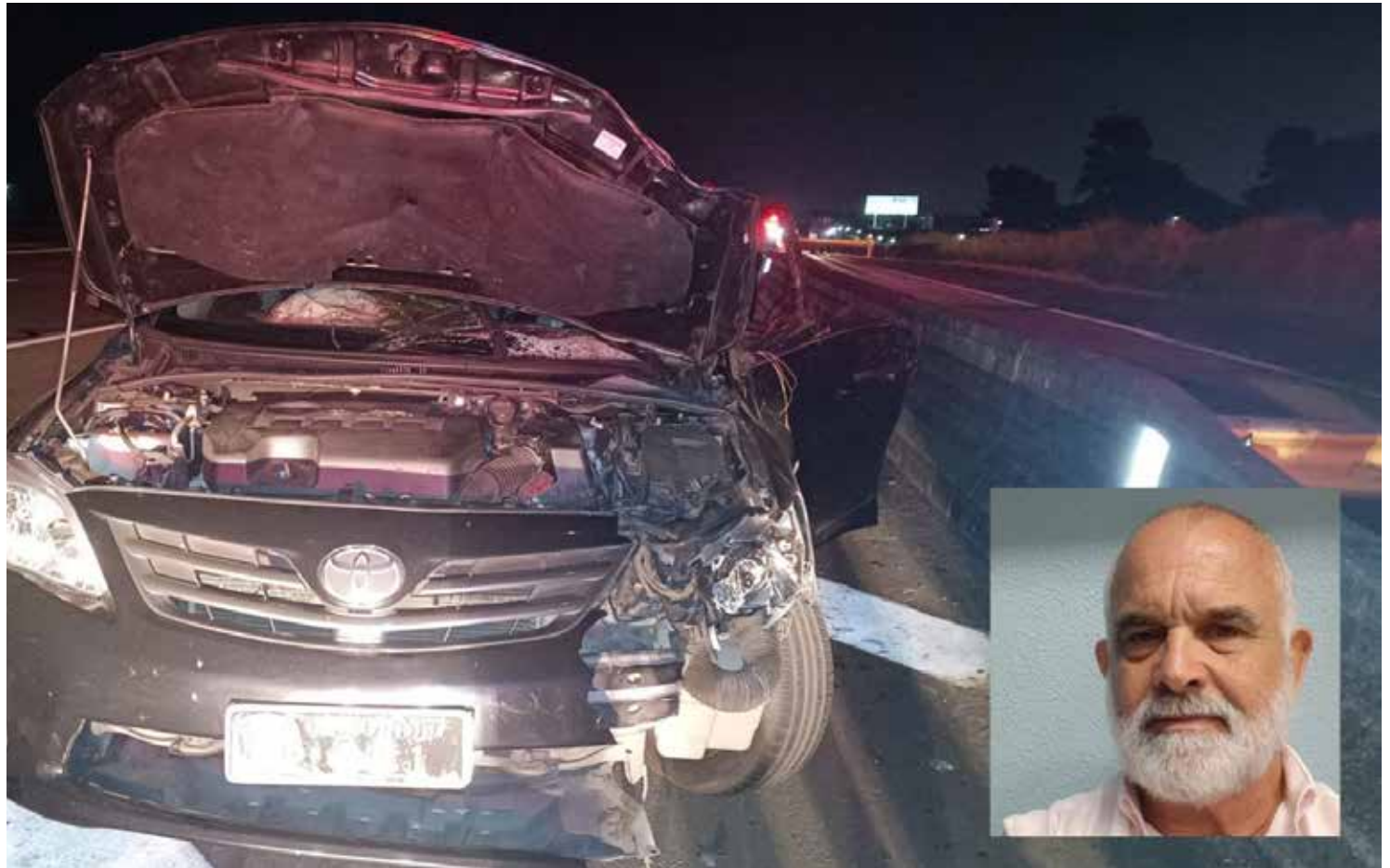
O acidente ocorreu às 21h15 na altura de Hortolândia

Segundo a Polícia Rodoviária, cerca de oito cavalos estavam soltos na pista no