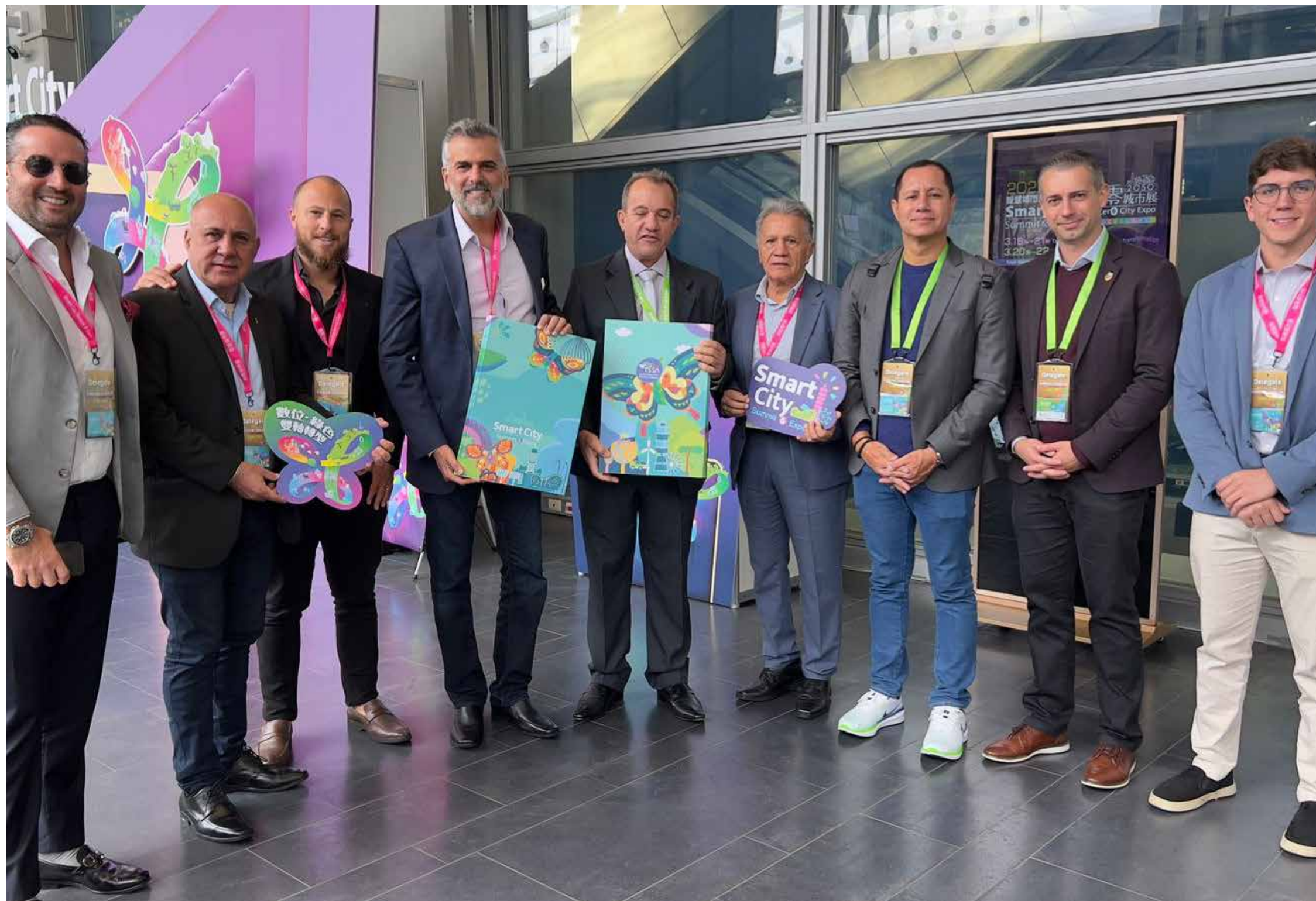
Integraram a missão brasileira prefeitos das 20 cidades que compõem a RMC

Um grupo de prefeitos da Região Metropolitana de Campinas (RMC) participou de um dos maiores eventos de cidades inteligentes do mundo, o Smart City Summit & Expo, realizado de 19 a 21 de março, em Taiwan. Todas as despesas de viagem e estadia dos prefeitos foram custeadas pelo governo de Taiwan.