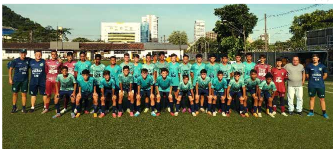
Equipe sub 14 joga contra equipe do Santos FC

ratura acima dos 40 graus em Santos e gramado sintético, os guerreiros bugrinos se saíram muito bem. Foram três tempos muito equilibrados, sendo que o primeiro tempo terminou no 0 a 0, o segundo tempo foi 1 a 1 e o terceiro tempo o peixe venceu por 1 a 0.