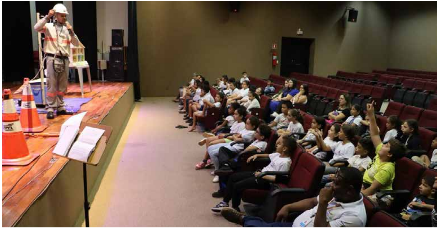
Ação de conscientização sobre a rede elétrica é promovida pela CPFL Paulista em Morungaba

As crianças tiveram acesso ainda a vídeos orientativos e a maquete de uma casa energizada, na qual equipes da CPFL Paulista deram dicas de segurança e ensinaram a economizar energia. Os alunos também conheceram de perto alguns exemplares de EPIs (equipamentos de proteção individual) utilizados pelos profissionais da companhia. Como brinde, foram distribuídos giz de cera e desenhos para colorir aos participantes para que possam compartilhar com amigos e familiares o que aprenderam durante o evento.