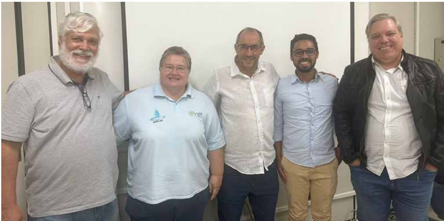
Autoridades e representantes da ADECAP se reúnem com professores da Unicamp

cessidade premente. Mas o que exatamente significa uma cidade ser inteligente? Na essência, trata-se de uma comunidade que utiliza a tecnologia e a inovação para melhorar a qualidade de vida de seus habitantes, promovendo eficiência, sustentabilidade e inclusão. Durante a reunião, os especialistas destacaram a importância de aproveitar os recursos já disponíveis nas cidades como ponto de partida para essa transformação. Desde infraestrutura de comunicação até sistemas de gestão urbana, há uma infinidade de elementos que podem ser otimizados para criar ambientes mais seguros, eficientes e dinâmicos. Para o Dr. Leonardo, uma Cidade Inteligente é aquela que se torna uma "cidade que fala", onde a interconexão e a comunicação fluente entre os sistemas urbanos e os cidadãos são fundamentais para uma gestão eficaz e uma vida urbana de qualidade. Além disso, a presença e