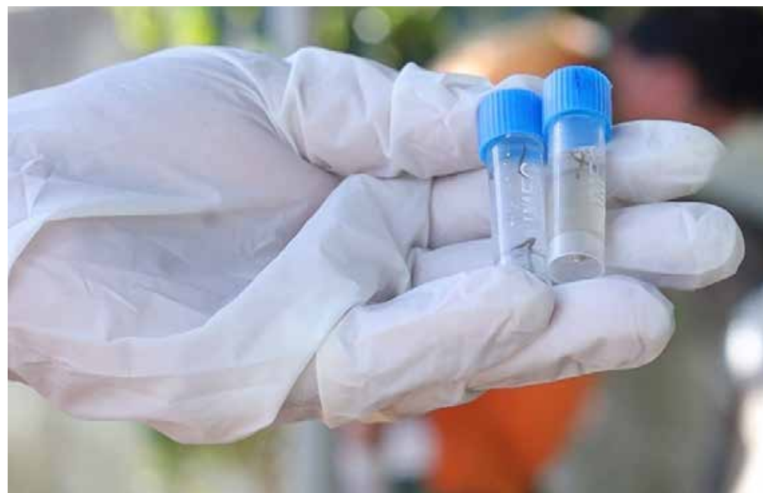
Nas unidades de saúde do município, esse mês, os casos suspeitos dobraram na comparação com janeiro

Agentes do Departamento Municipal de Saúde de Holambra coletaram entre segunda e quarta-feira, dias 19 a 21, 231 larvas do mosquito Aedes aegypti, trans-