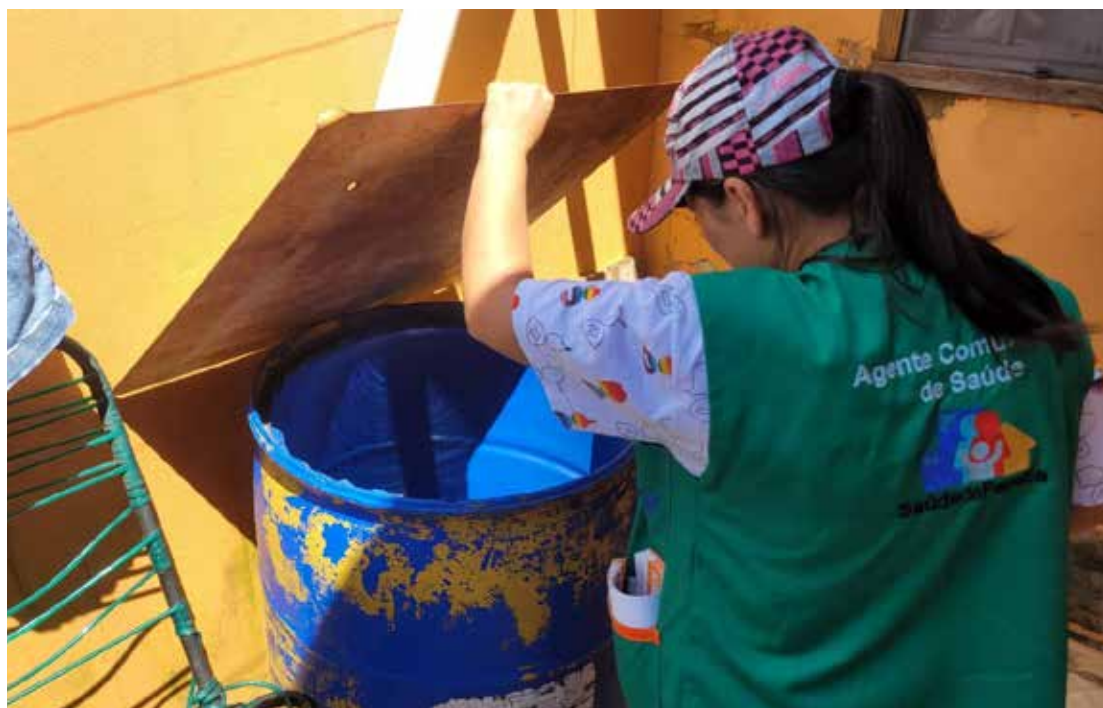
A ação ocorre das 8h às 16h

Neste sábado, 24, a Prefeitura da Estância de Amparo realiza o "Dia D da Dengue" com uma iniciativa voltada para a prevenção e análise do Aedes aegypti no bairro Caman-