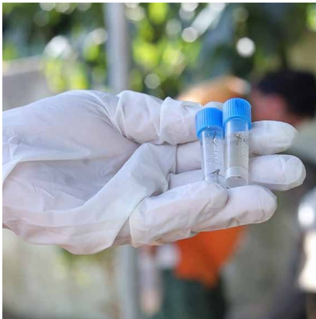
Nas unidades de saúde do município, esse mês, os casos suspeitos dobraram na comparação com janeiro

“Os agentes recolheram nas casas visitadas 243 larvas no total e 231 foram identi-