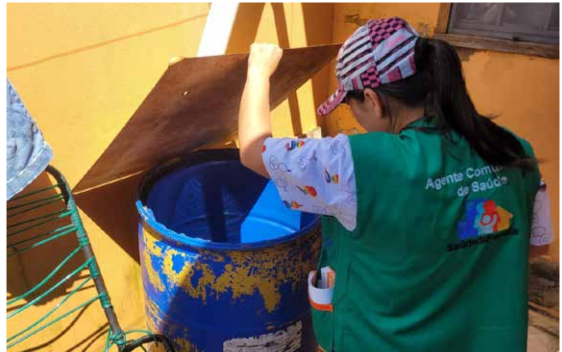
A ação ocorre das 8h às 16h

comunidade é fundamental para o sucesso dessa iniciativa, e as autoridades