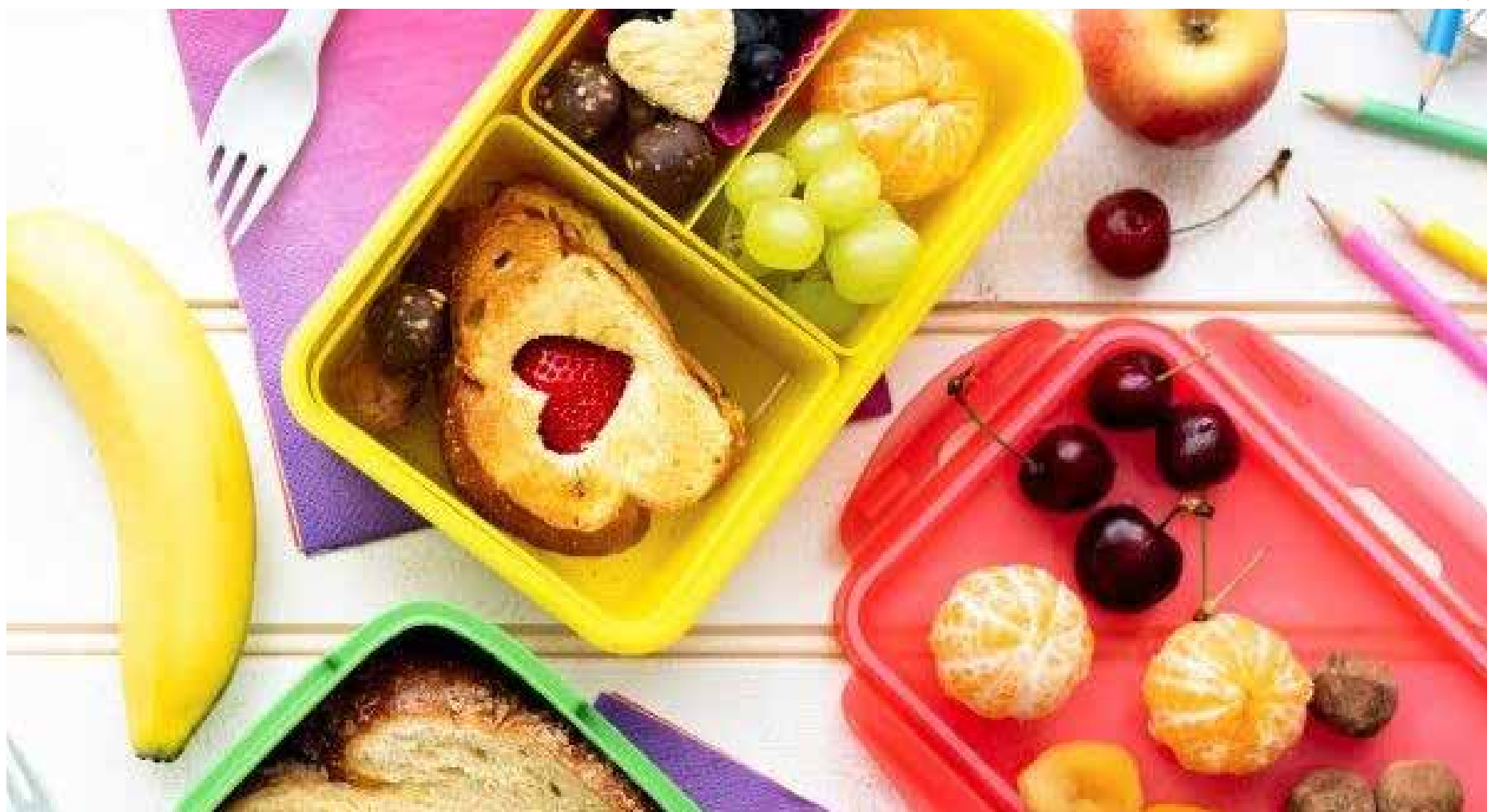
Página 4 O retorno das atividades escolares em 2024 é uma excelente oportunidade para estabelecer uma rotina de alimentação saudável para as crianças e para a família

Com o início do ano letivo muitos pais ficam na dúvida, pela falta de tempo e correria do dia a dia, sobre como preparar a lancheira dos filhos. O lanche da escola contribui muito para a saúde da criança, por isso, a montagem da lancheira deve garantir o bom teor nutricional, boas experiências com a comida, além de praticidade para o dia a dia.