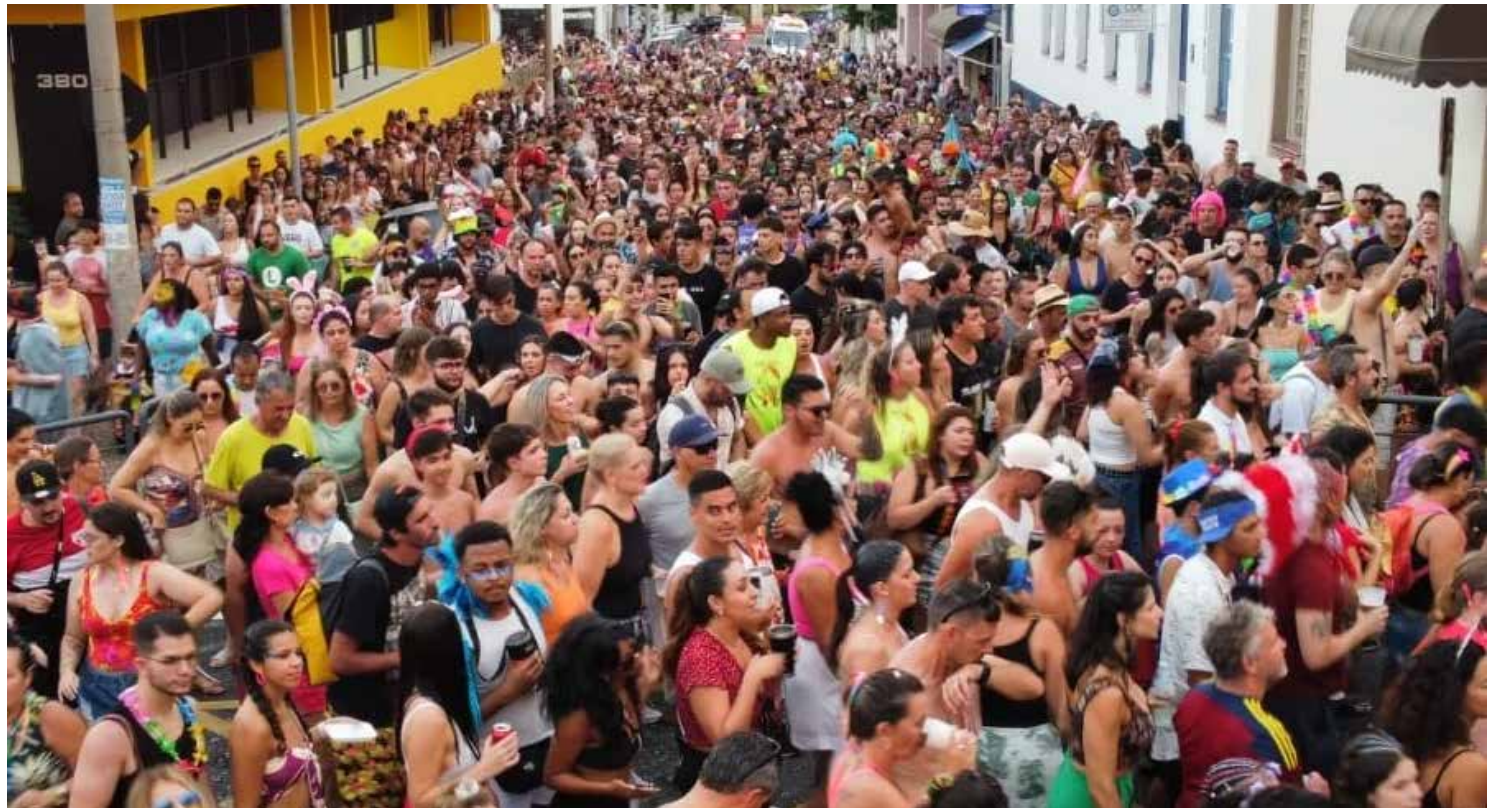
Mais de 400 câmeras de monitoramento em toda a cidade, incluindo 30 no circuito do evento, contribuíram para um ambiente seguro

O Carnaval de Amparo contou com uma programação diversificada que agra-