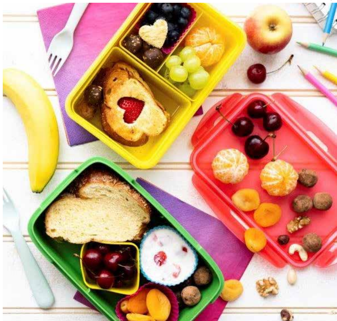
O retorno das atividades escolares em 2024 é uma excelente oportunidade para estabelecer uma rotina de alimentação saudável para as crianças e para a família

A obesidade é uma doença crônica grave que merece muita atenção, principalmente, por estar relacionada ao desenvolvimento de outros problemas graves de saúde. Atualmente, de acordo com o relatório anual Estado da Segurança Alimentar e Nutrição no Mundo,