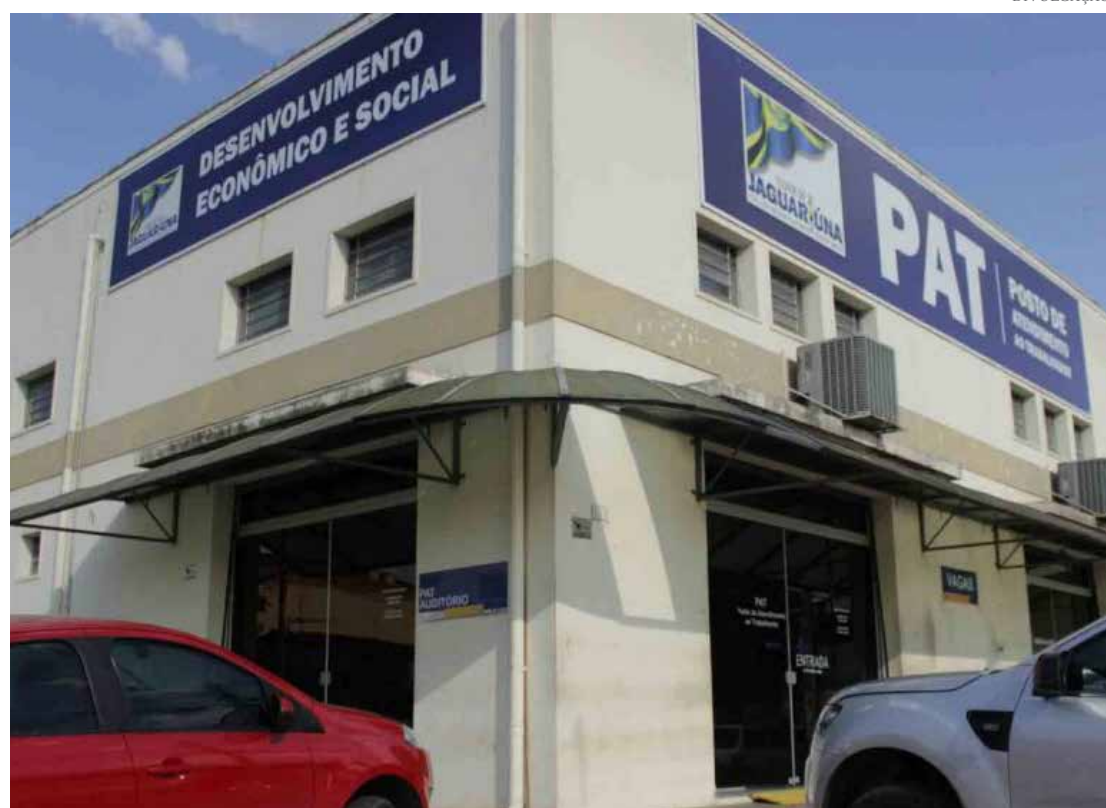
Os números são do Cadastro Geral de Empregados e Desempregados

O número de novas vagas de emprego em Jaguariúna cresceu mais de 50% em 2023, em comparação com 2022. No ano passado, foram gerados na cidade 1.588 novos postos de trabalho com carteira assinada contra 1.033 em 2022, um aumento de 53,7%. Página 6