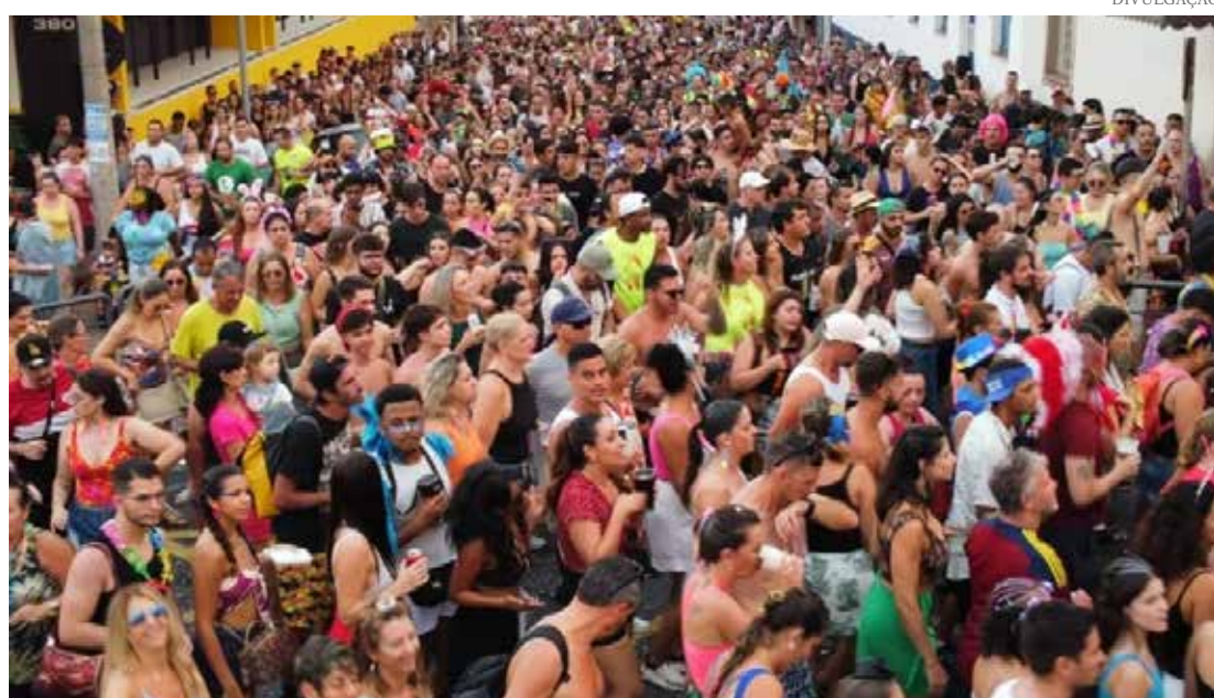
Mais de 400 câmeras de monitoramento em toda a cidade, incluindo 30 no circuito do evento, contribuíram para um ambiente seguro

O Carnaval de Amparo, realizado de 09 a 13 de fevereiro na Praça Pádua Salles e nos distritos da cidade, foi um verdadeiro sucesso, atraindo cerca de 150 mil foliões de diversas cidades do Circuito das Águas Paulista, São Paulo Capital e outros estados. O evento se consolidou como um dos maiores do interior do estado, gerando impactos significativos na economia local e promovendo uma atmosfera de diversão segura e familiar. Página 10