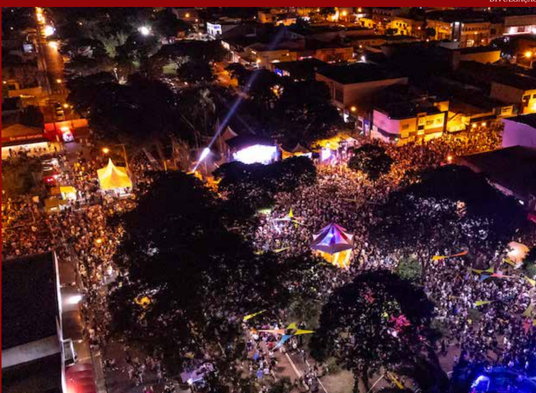
Foliões deram show de solidariedade

Durante os cinco dias do Carnartur 2024, o espírito festivo encheu as ruas de Artur Nogueira com alegria e solidariedade. Este ano, as entidades municipais foram brindadas com um aumento exponencial nas arrecadações, ultrapassando todas as expectativas anteriores.