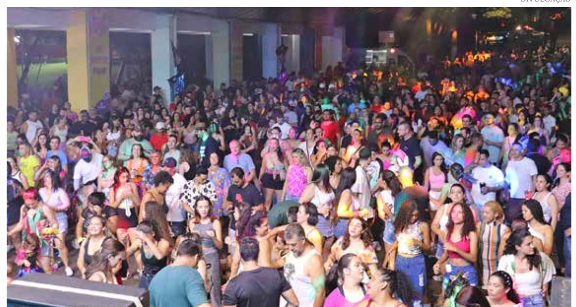
Cerca de 15 mil pessoas prestigiaram o evento