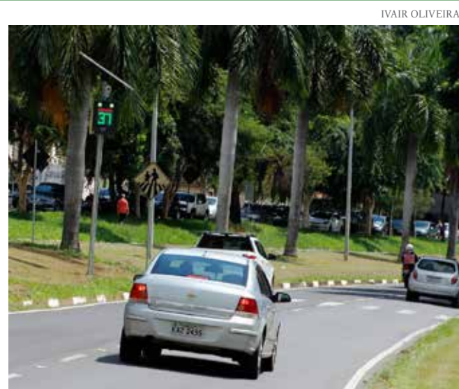
A velocidade máxima permitida é de 50 km/h