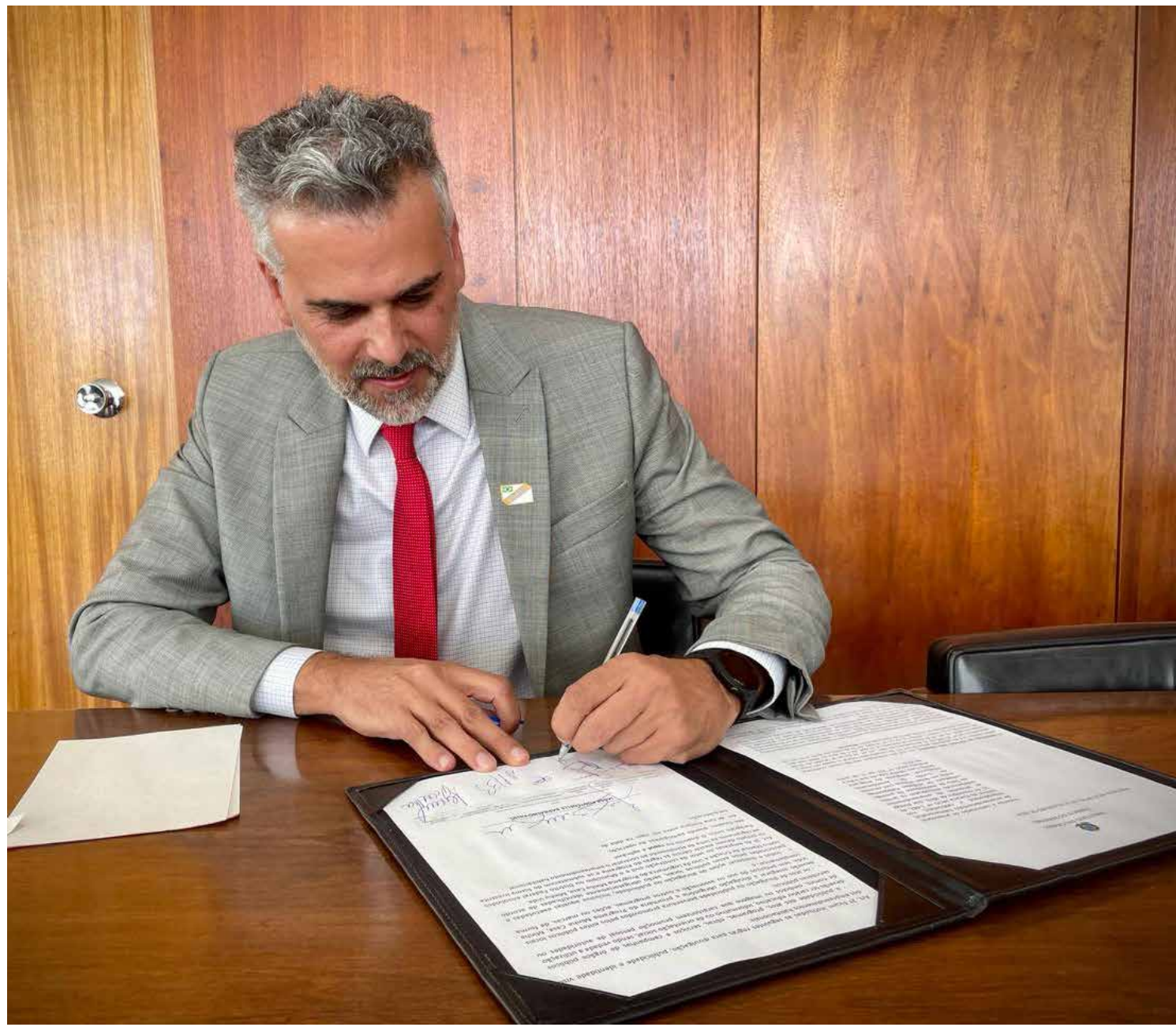
Primeiro contrato para o início das obras foi assinado em Brasília

Os 115 imóveis do futuro residencial terão o Selo Casa Azul da Caixa Econômica Federal, instrumento de classificação ASG (Ambiental, Social e Governança) destinado a propostas de empreendimentos habitacionais que adotem soluções eficientes na concepção, execução, uso, ocupação e manutenção das edificações. As casas de Jaguariúna serão