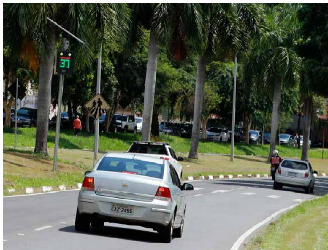
A velocidade máxima permitida é de 50 km/h

A Prefeitura de Jaguariúna, por meio da Secretaria Municipal de Mobilidade Urbana, instalou dois redutores eletrônicos de velocidade, mais conhecidos como lombadas eletrônicas, nesta semana. Os equipamentos foram obtidos sem custo para a Prefeitura, por meio de convênio com o Departamento