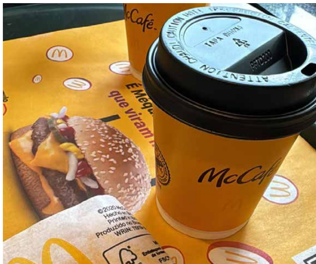
O menu do Mc Café pode ser solicitado todos os dias entre as 8h e às 11h

Ei! Você que é de Jaguariúna ou região já está sabendo? O Mc Donald's inovou mais uma vez, mas agora, para você começar o dia com aquela energia! Está disponível em Jaguariúna “Méqui Café”, para aquele momento do dia em que o café é indispensável para a maioria.