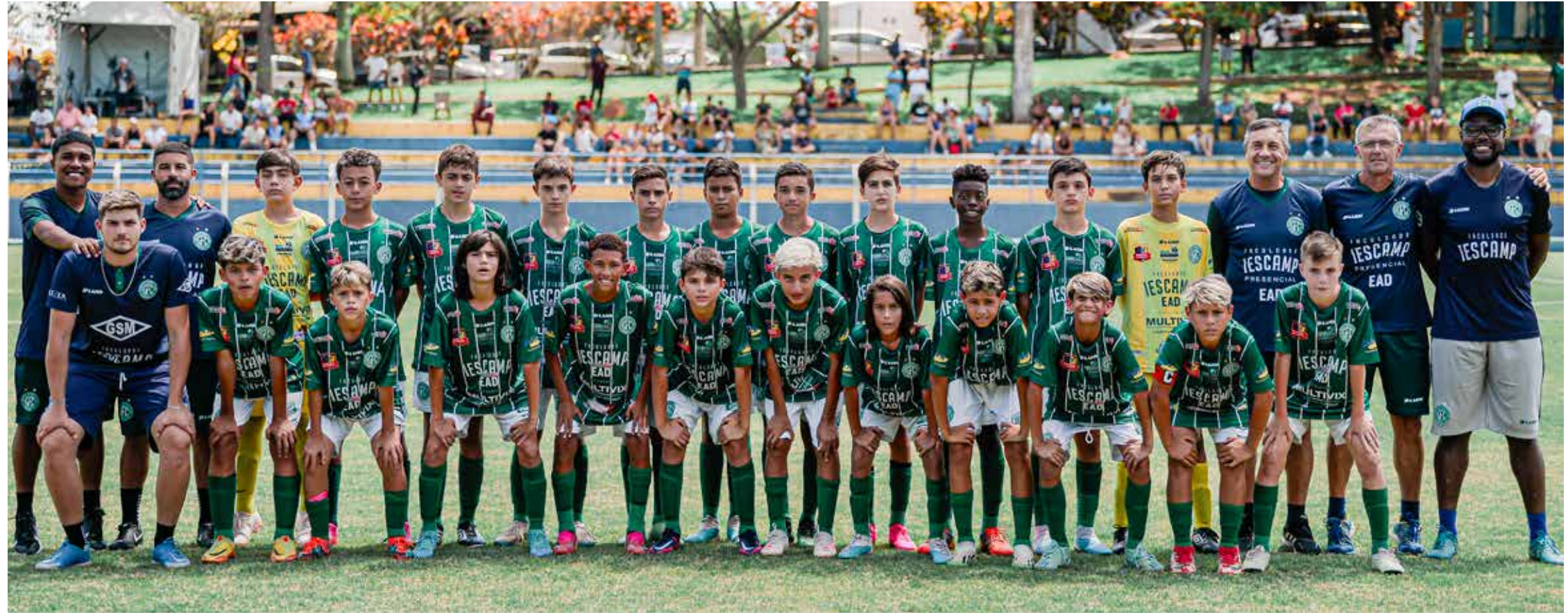
Equipe sub 13 do Guarani FC/campeã

Entre os dias 22 e 27 de janeiro foi realizado o 1º Jaguariúna Cup – Categoria Sub 13, na cidade de Jaguariúna, em mais uma promoção da CEFAM em parceria com a Secretaria de Esportes de Jaguariúna. Participaram 12 equipes, sendo elas, SE Pal-