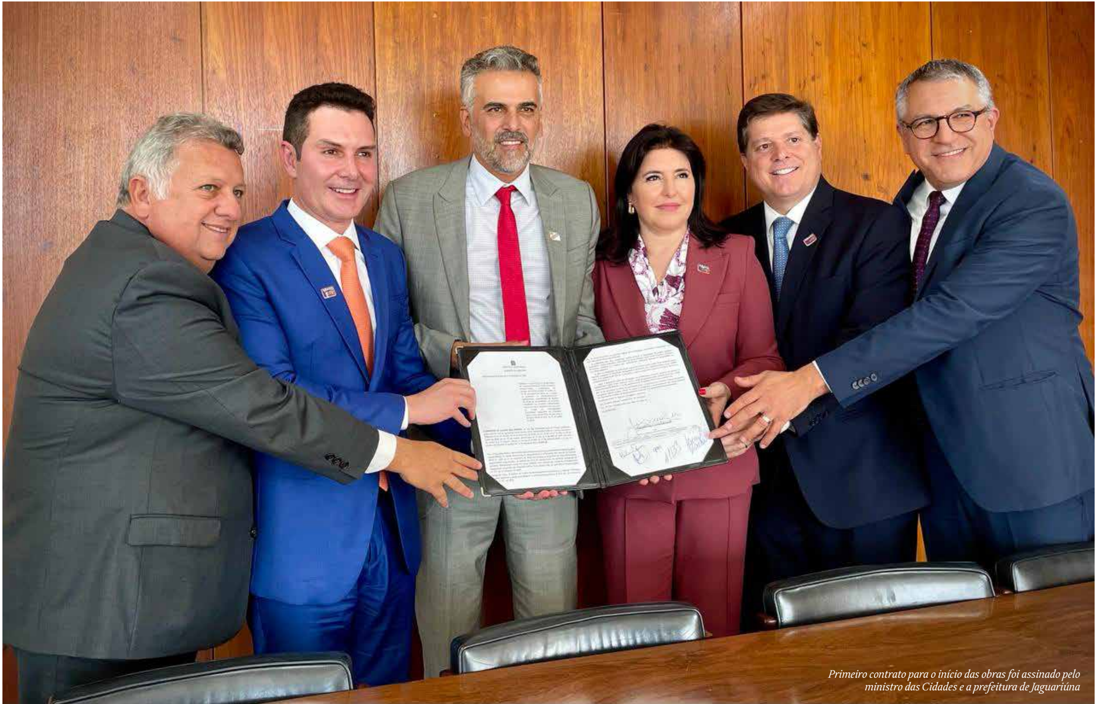
Primeiro contrato para o início das obras foi assinado pelo ministro das Cidades e a prefeitura de Jaguariúna