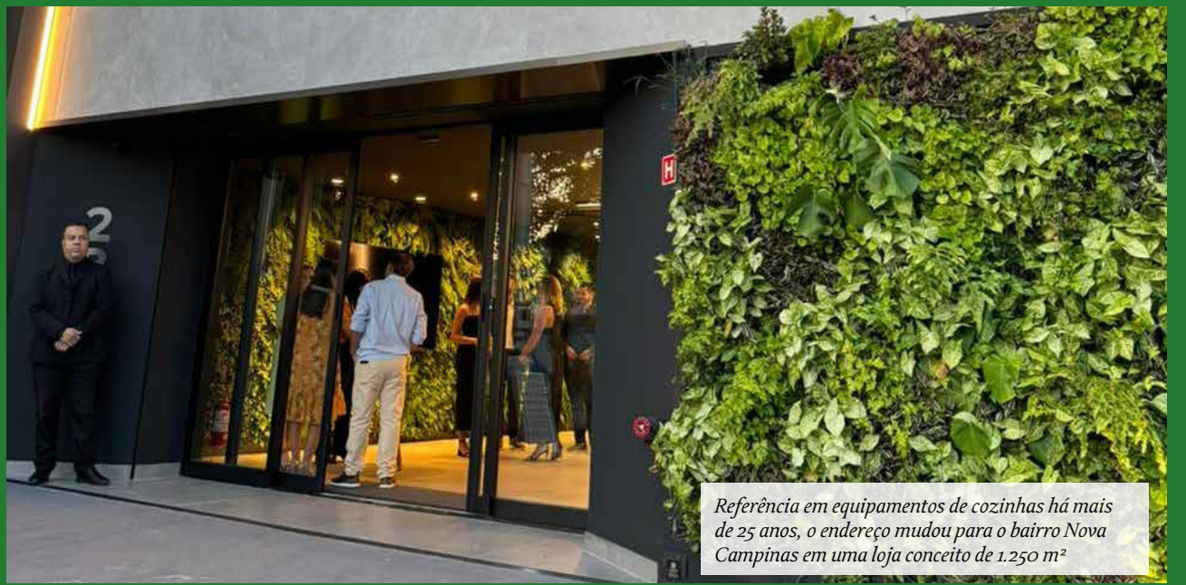
Referência em equipamentos de cozinhas há mais de 25 anos, o endereço mudou para o bairro Nova Campinas em uma loja conceito de 1.250 m 2

expertise em aliar o funcional e o design há mais de 25 anos, desejo de aficionados por cozinhas equipadas e de qualidade, o novo endereço expõe soluções completas em eletrodomésticos de alto padrão para cozinhas e espaços gourmets e prioriza a experiência do cliente.