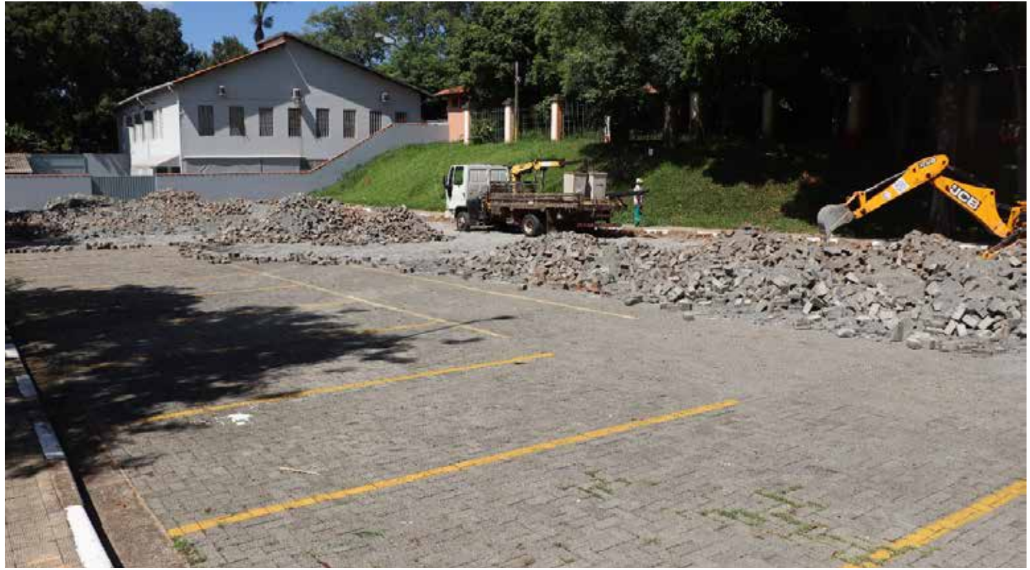
Prefeitura de Morungaba inicia obras do Projeto "Arena Esportiva"

Marquinho ainda agradece ao Governo do Estado, através do governador Tarcsio de Freitas, à secretária de Estado de Esportes Coronel Helena Reis e à deputada estadual Edna Macedo, pois por meio deles que a