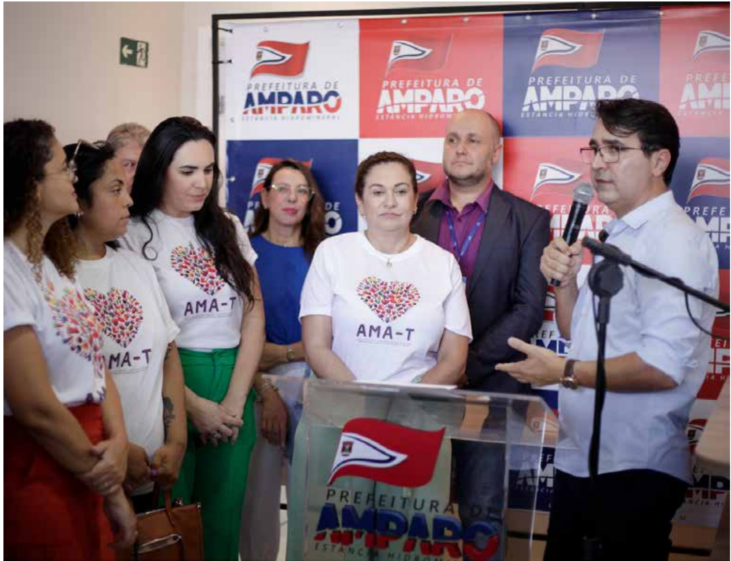
O centro contará com um ensino intensivo das habilidades necessárias para que indivíduos diagnosticados com autismo ou transtornos invasivos do desenvolvimento alcancem a independência