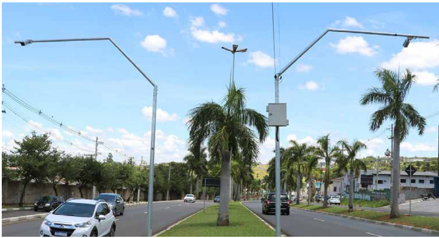
O sistema de câmeras tem tecnologia OCR e estão espalhados pela cidade

Como o novo sistema OCR (sigla em inglês para Optical Character Recognition), Jaguariúna também passa a integrar, a partir desta semana, os sistemas de “Muralha Digital” regional, Cortex (do Ministério da Justiça) e