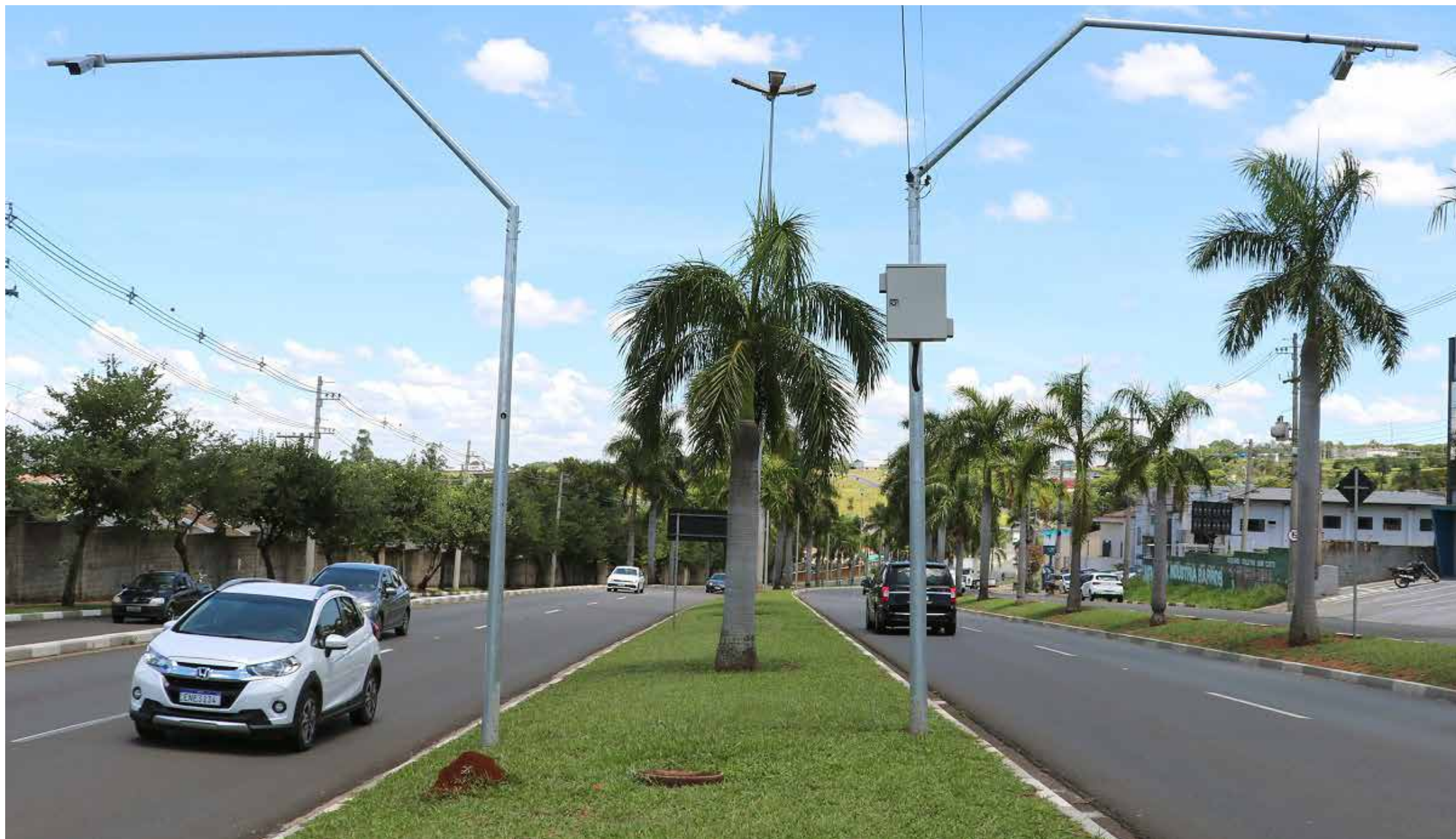
O sistema de câmeras tem tecnologia OCR e estão espalhados pela cidade

A segurança pública de Jaguariúna ganhou mais um importante aliado contra a criminalidade: o sistema de câmeras com tecnologia OCR. Segundo a Secretaria Mu-