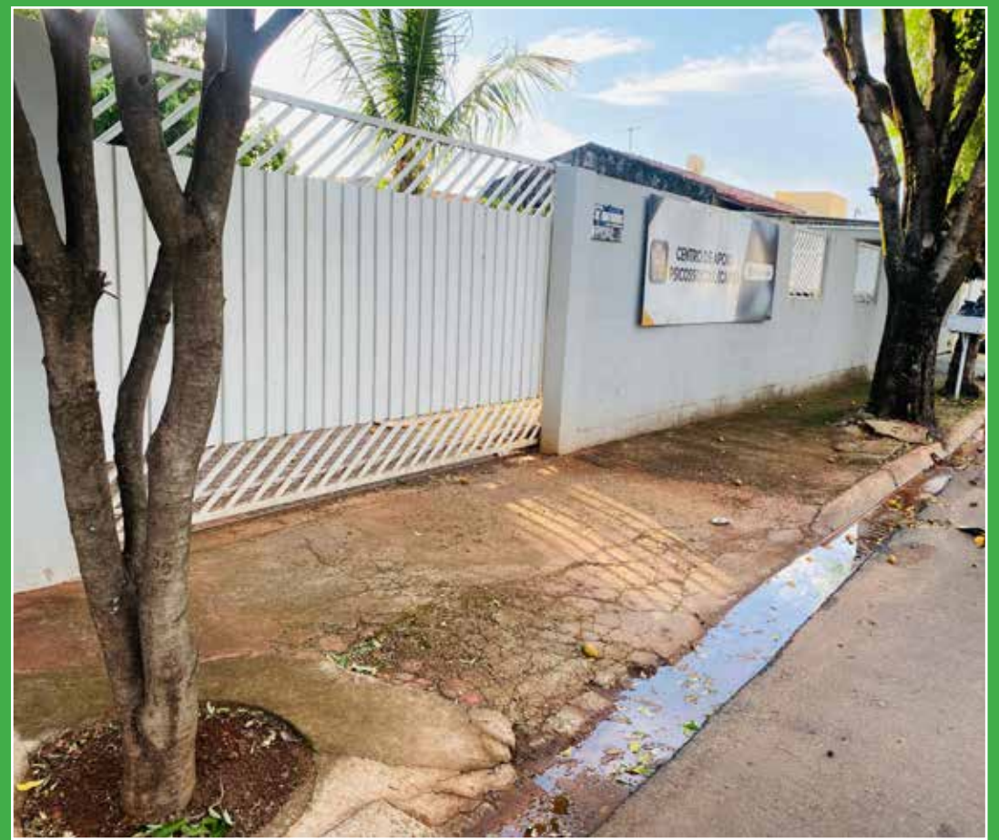
O espaço está localizado na Rua José Amaro Rodrigues, nº 668, Centro