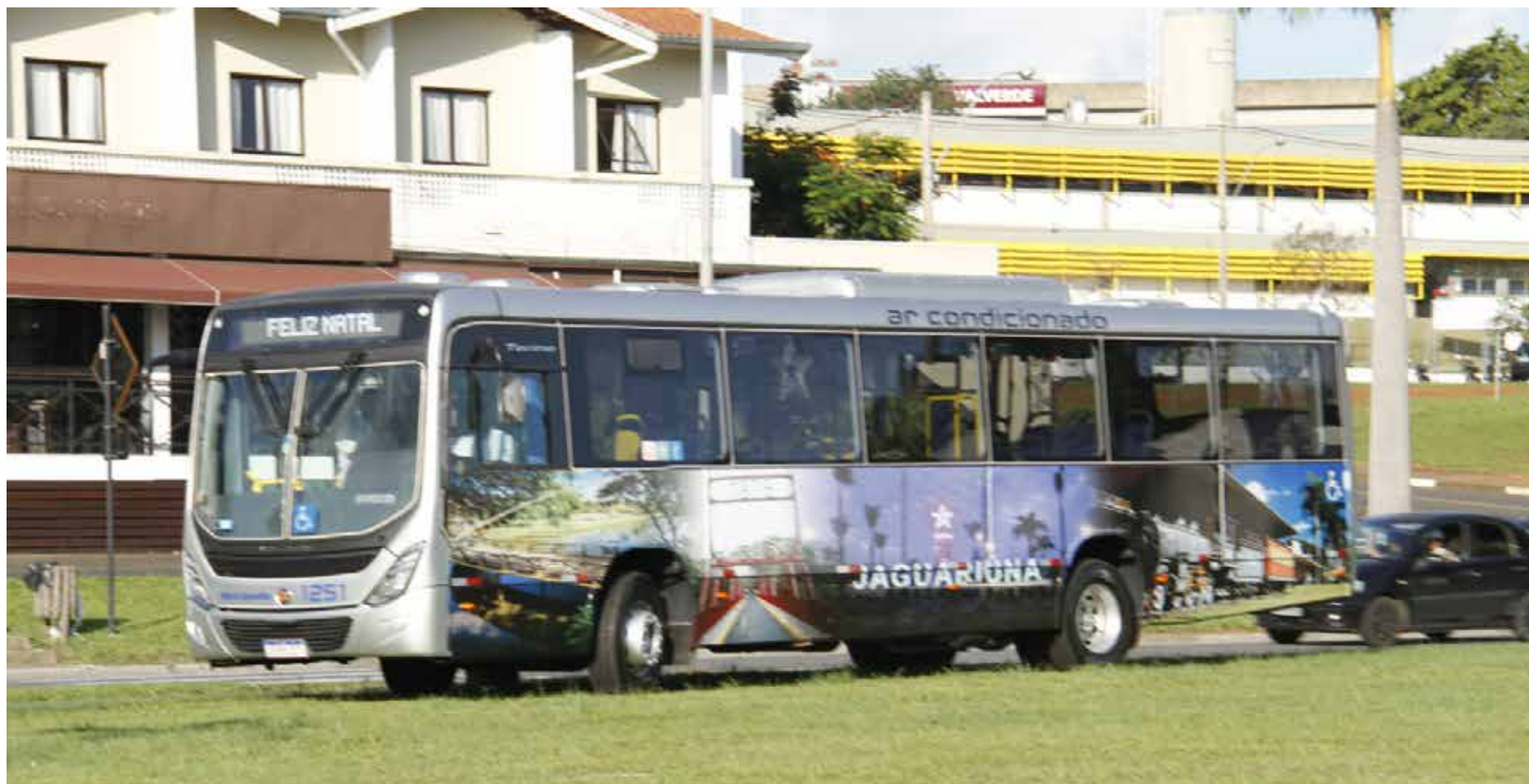
Transporte público de Jaguariúna

Ao contrário de outros municípios, a Prefeitura de Jaguariúna, por meio da Secretaria Municipal de Mobilidade Urbana, decidiu não reajustar a tarifa do transporte público da cidade, que neste início de ano permanece custando R$2,50. A tarifa do transporte coletivo municipal em Jaguariúna não tem nenhum reajuste desde 1º de fevereiro de 2016 e é uma das mais baixas da Região Metropolitana de Campinas (RMC). Segundo a Secretaria de