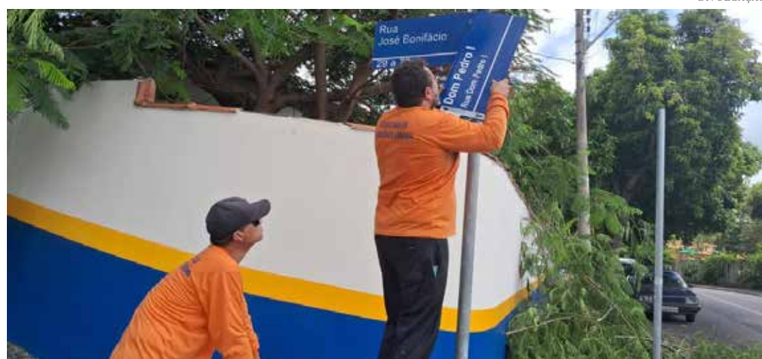
Troca de placas sendo realizada nos bairros de Jaguariúna

A programação da secretaria prevê que todos os bairros da cidade terão as placas de nomes de ruas e de sinalização avaliadas e, se for necessário, substituídas por novas.