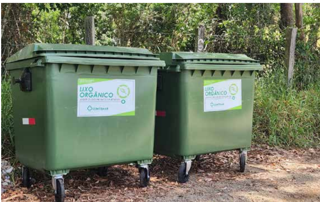
A instalação das novas lixeiras não altera os itinerários da empresa anterior