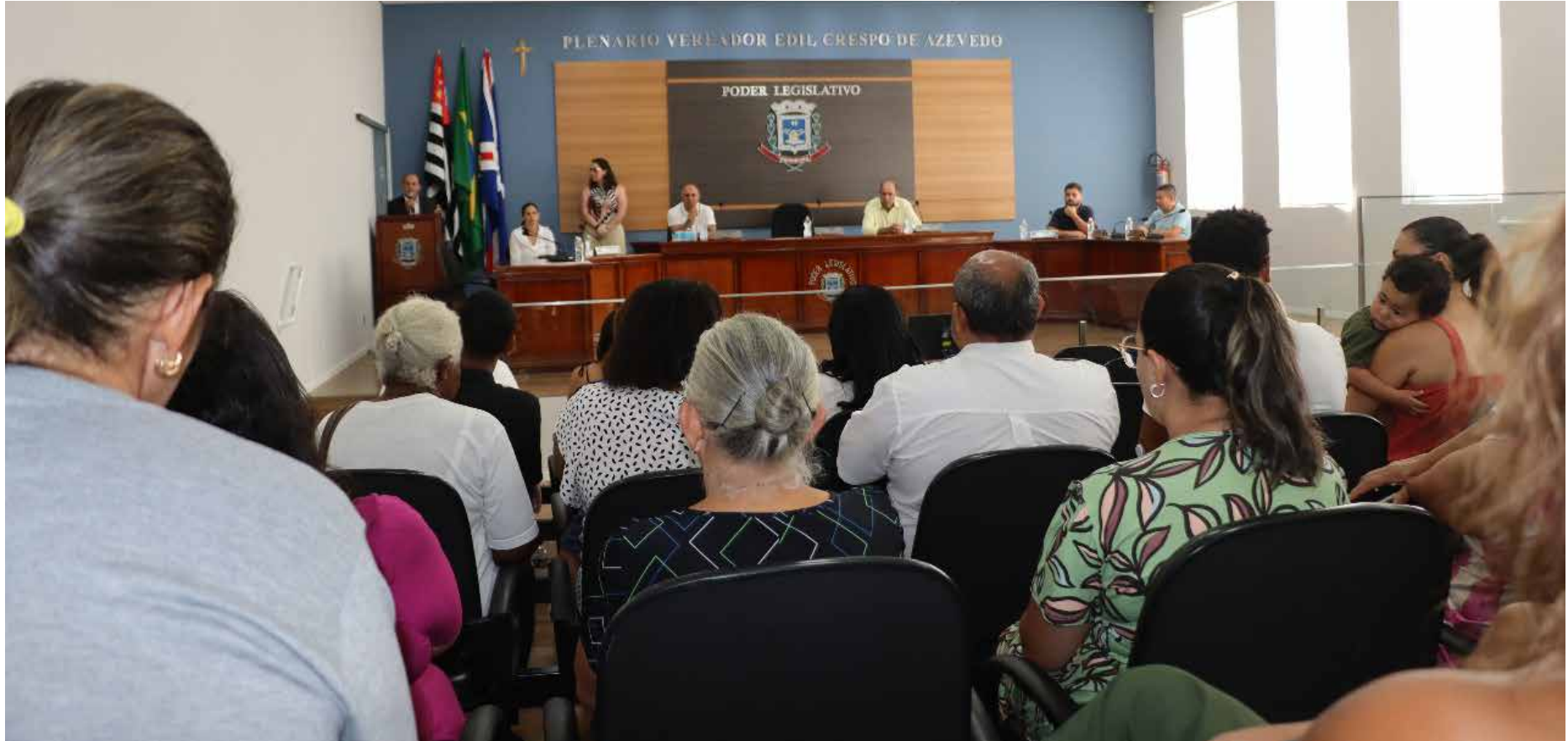
A cerimônia de posse ocorreu na Câmara Municipal

Os eleitos terão um mandato de quatro anos à frente do Conselho Tutelar, que atua na defesa dos