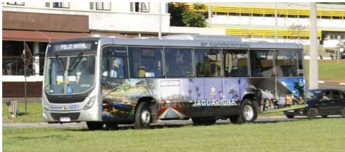
Transporte público de Jaguariúna

Ao contrário de outros municípios, a Prefeitura de Jaguariúna, por meio da Secretaria Municipal de Mobilidade Urbana, decidiu