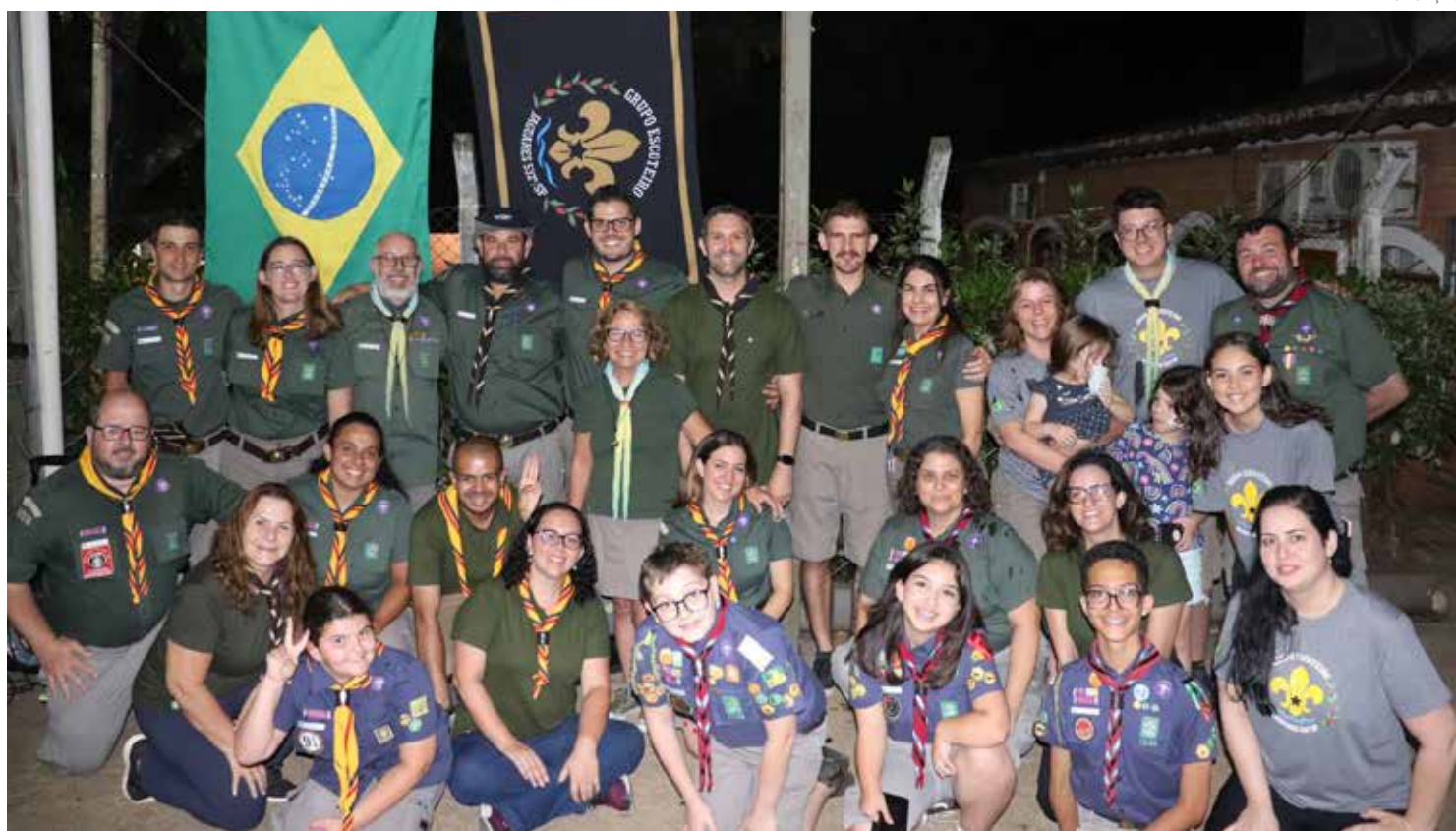
O início das atividades para novos integrantes é 27/01/2024

Ser escoteiro é viver experiências que proporcionam a autonomia, resiliência, autoconfiança, criati-