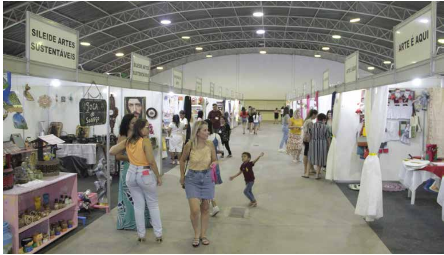
A feira ocorre de 14 a 16 de dezembro (quinta-feira a sábado), das 14h às 22h e domingo, 17, das 10h às 19h