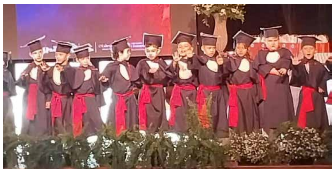
A turminha do Jardim 2 - Formandos