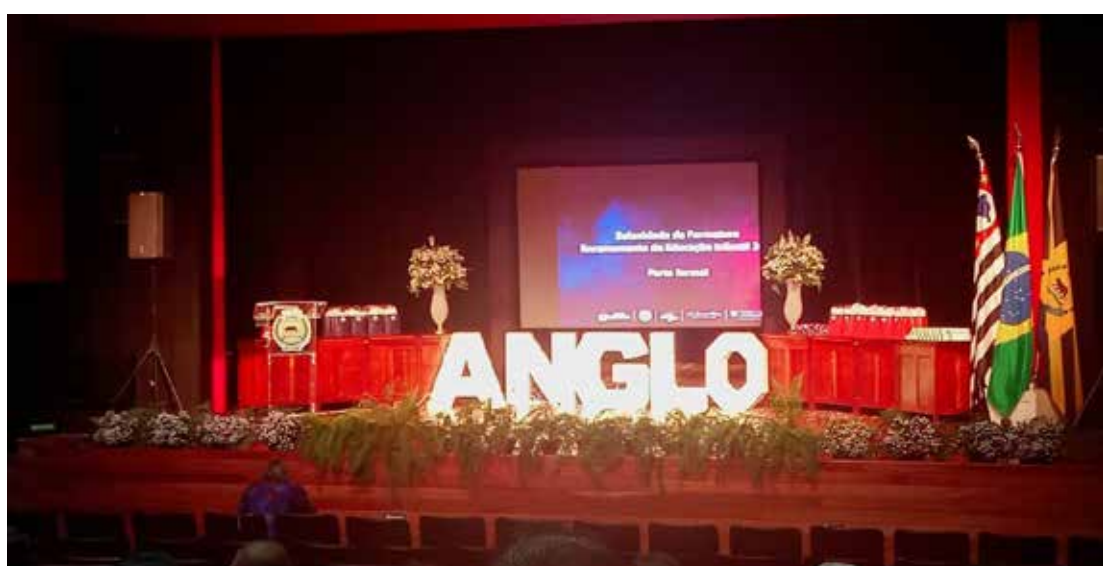
O palco do Teatro D. Zenaide de Jaguariúna