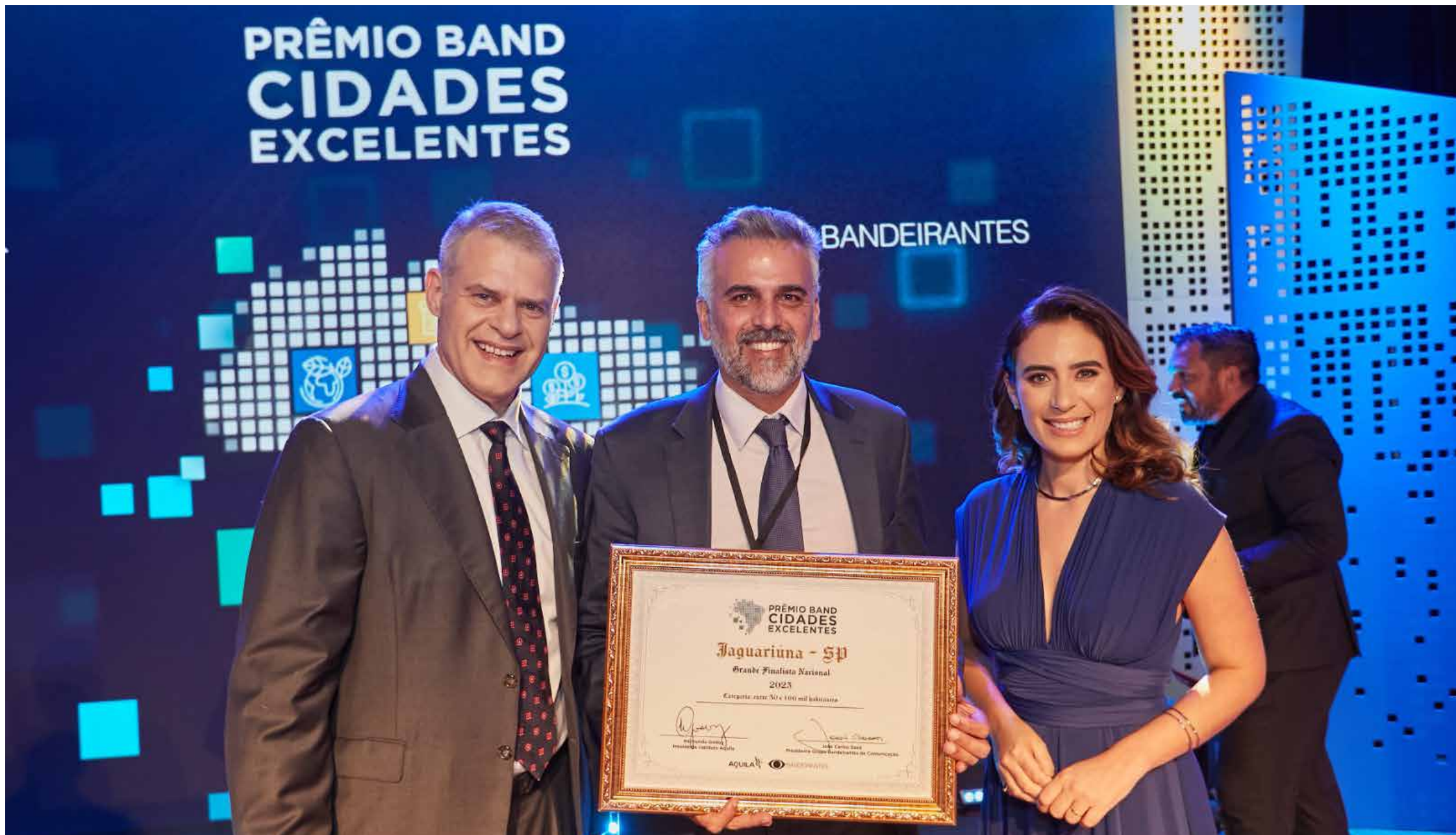
A premiação nacional aconteceu nesta segunda-feira, 11, em Brasília

Jaguariúna conquistou o segundo lugar na edição nacional do Prêmio Band Cidades Excelentes 2023 na principal categoria, o Índice de Gestão Municipal Aquila (IGMA),