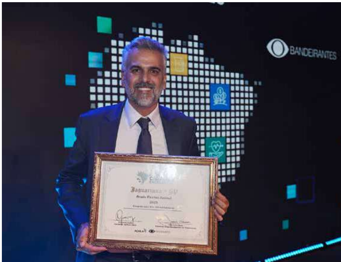
A premiação nacional aconteceu nesta segunda-feira, 11, em Brasília

O Índice de Gestão Municipal Aquila utiliza dados