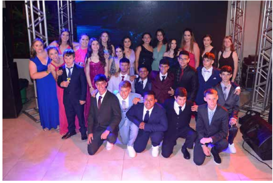
Comissão de mães junto aos formandos do 9º ano do Ensino Fundamental 2