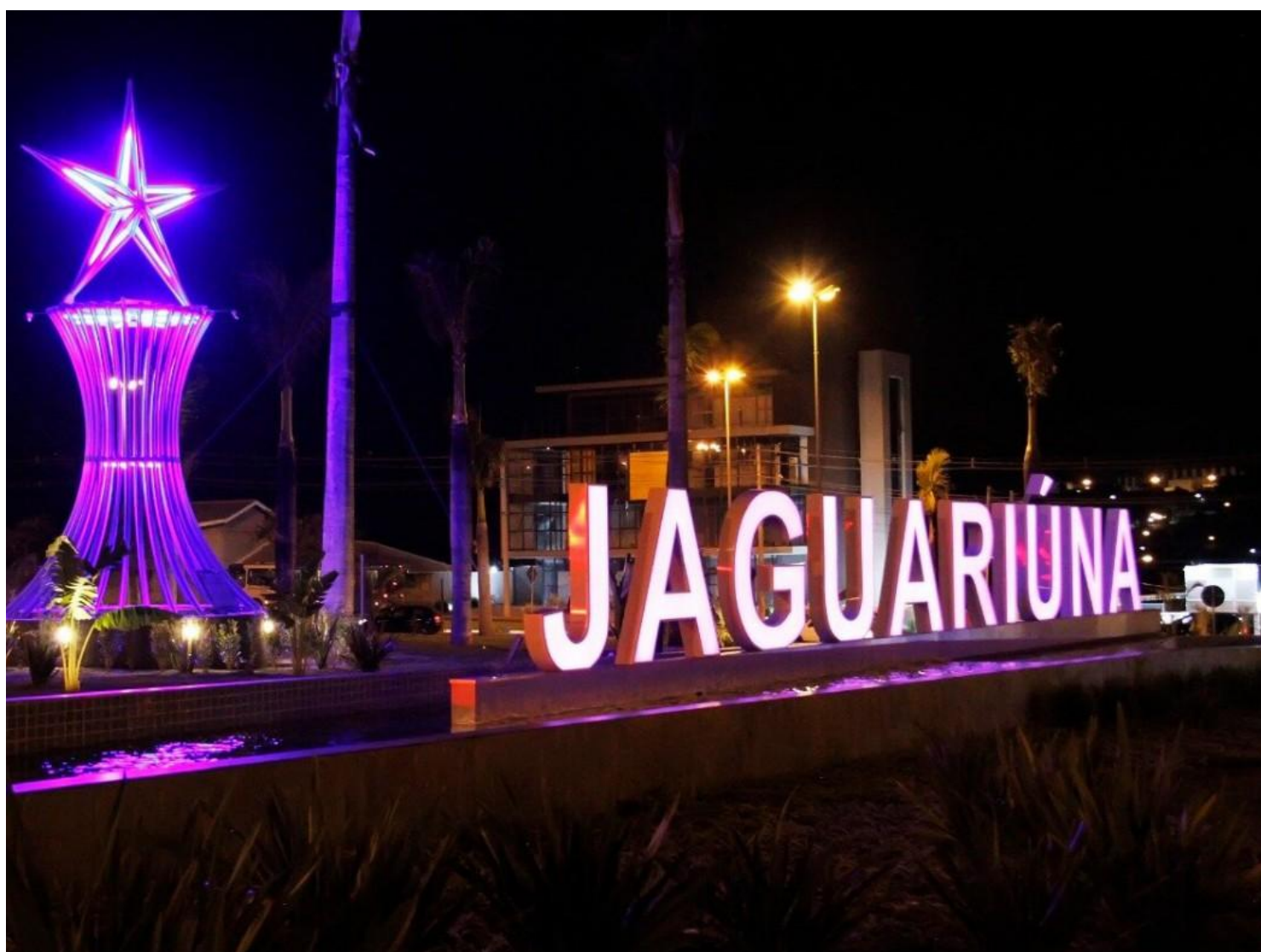
Portal de Jaguariúna

ge Caruso já apoiava esta ideia. “Jaguariúna sendo elevada a Município de Inter-