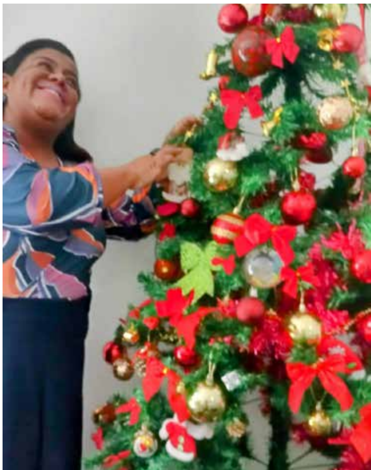
Montando a árvore de Natal

Consulte mais dicas em nosso Instagram: @mih_casamesaposta por Giuliana Murer