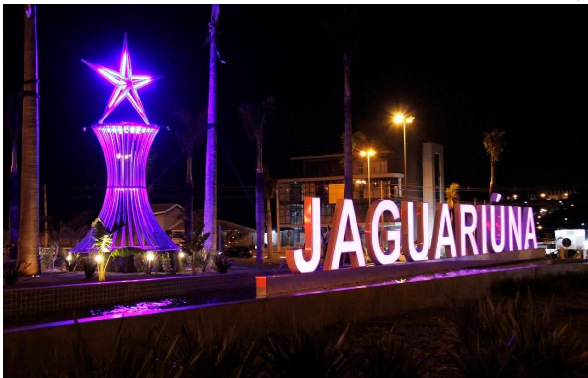
Portal de Jaguariúna