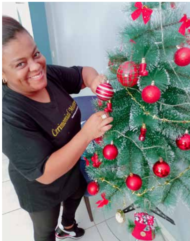
Para lojistas, residências ou empresas