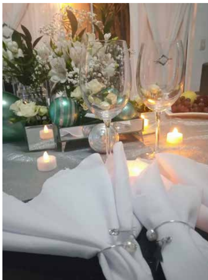
Mesa posta para réveillon