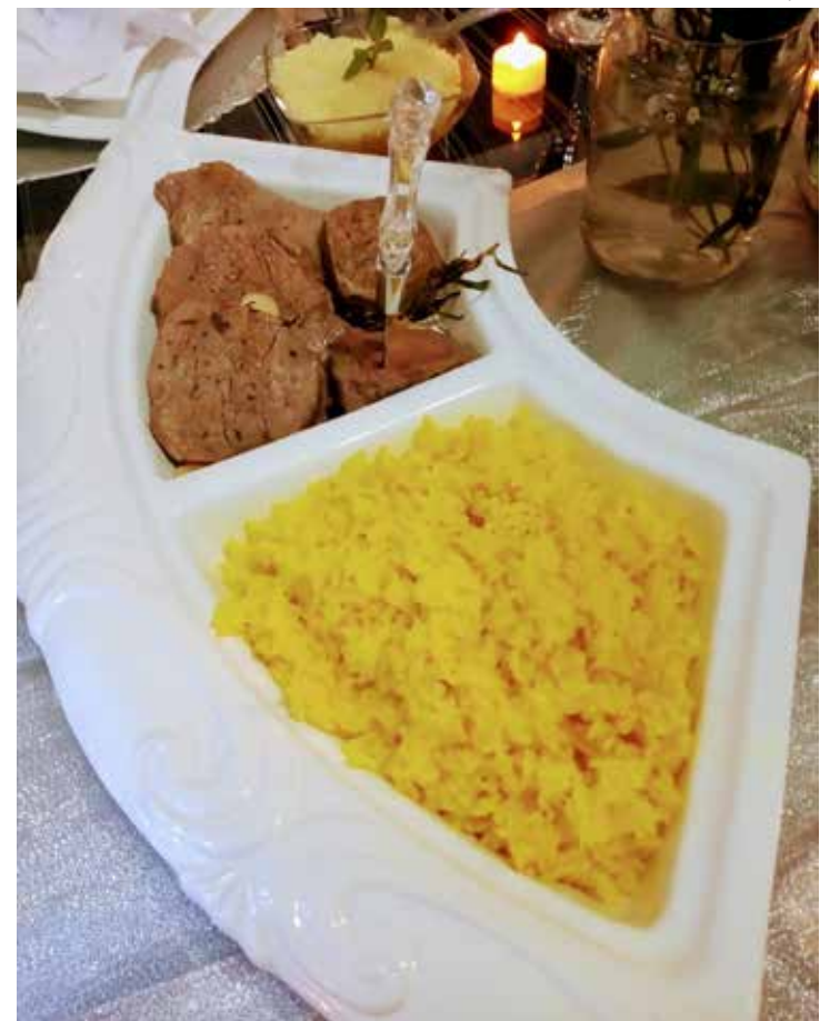
Como distribuir os pratos a mesa