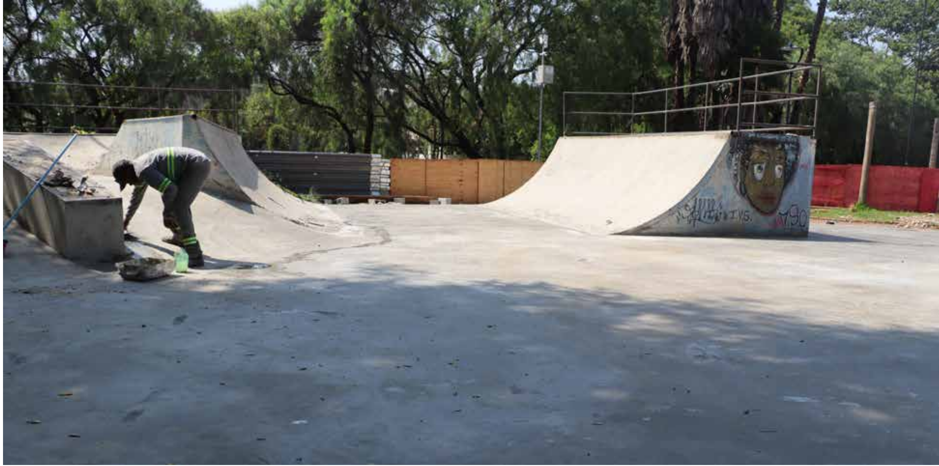
A previsão é que a reforma seja concluída ainda neste ano

As obras tiveram início em maio deste ano e por estarem em pleno vapor nestas últimas semanas, a previsão é que a reforma seja concluída ainda neste ano.