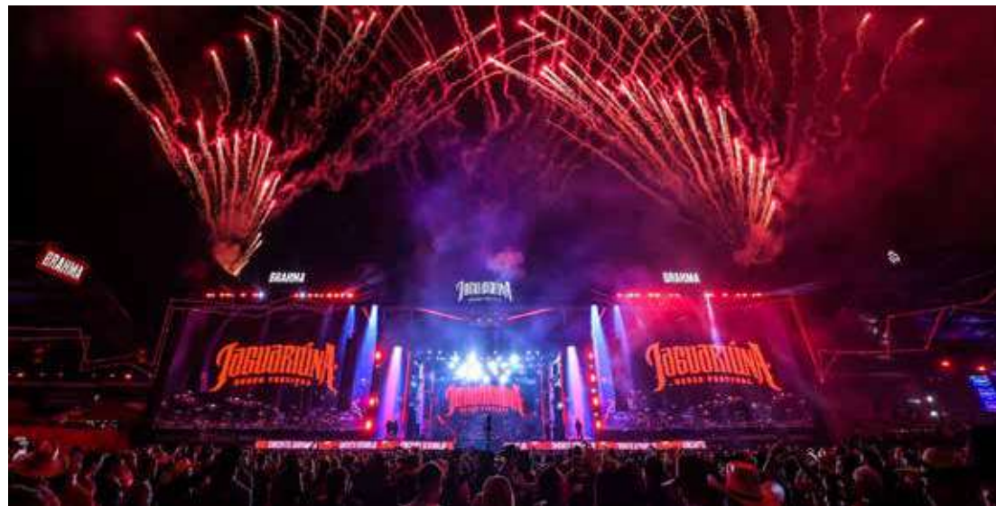
Jaguariúna Rodeo Festival segue até o dia 30 de setembro