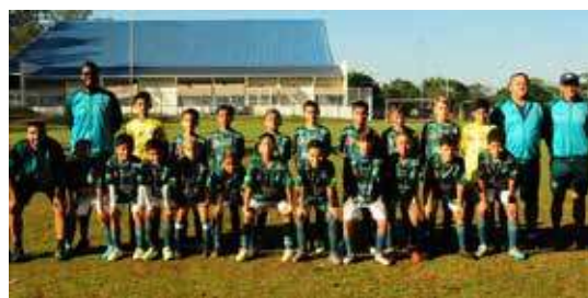
Equipe sub 10 do Guarani FC

mais conhecido como campo do Bandeirantes que fica localizado no Bairro da Ponte, próximo à rodovia Dom Pedro.