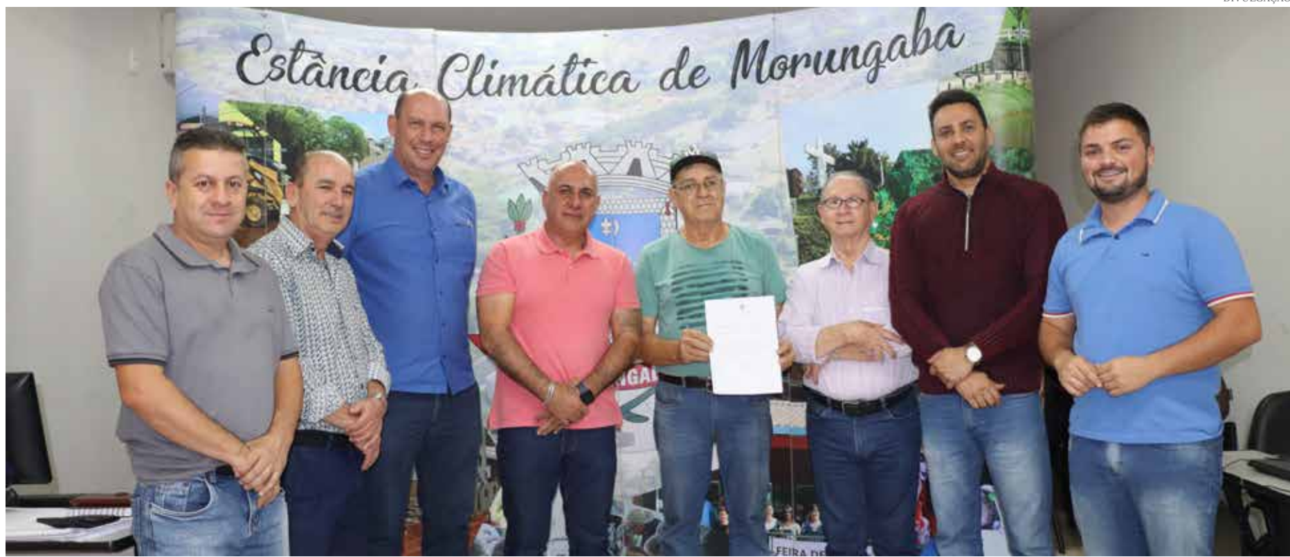
Autoridades comemoram conquista