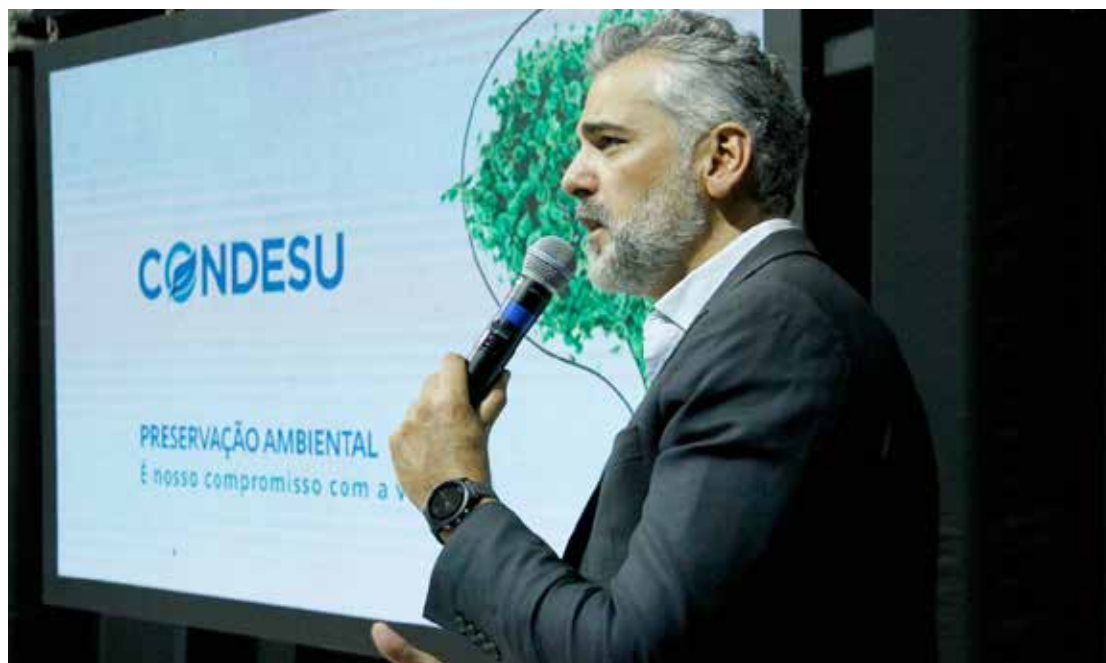
Evento do Condesu ocorreu no Teatro Municipal de Holambra

O Consórcio Intermunicipal para o Desenvolvimento Sustentável (CONDESU) promoveu nesta sexta-feira, 22, o 1º seminário com o tema Desafios e Oportunidades para a Gestão de Resíduos no Século XXI. O evento ocorreu no Teatro Municipal de Holambra. Página 11