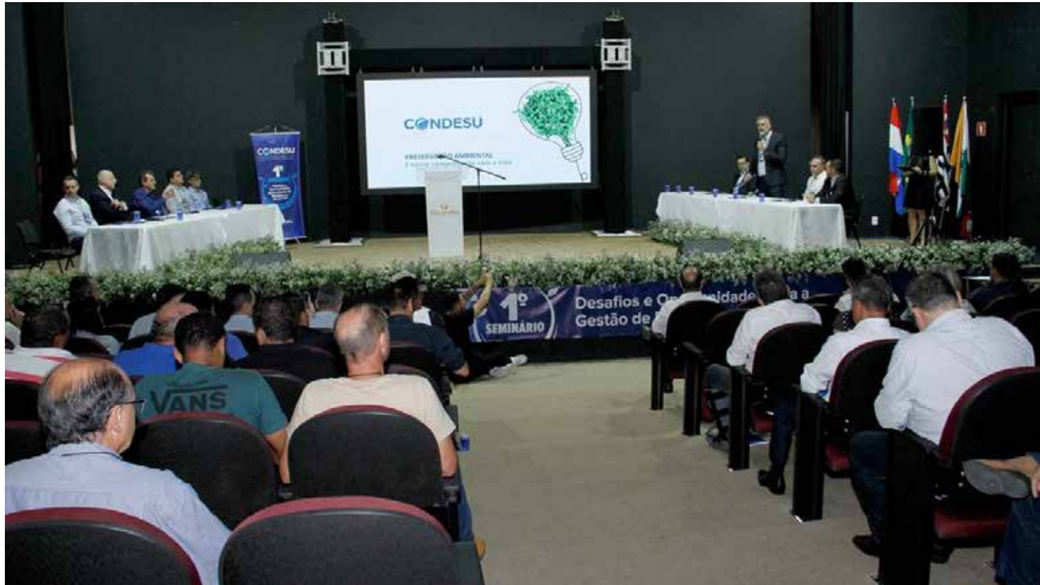
Evento do Condesu ocorreu no Teatro Municipal de Holambra

O seminário seguiu durante toda a manhã de sexta, e neste evento o Condesu conseguiu atingir seu objetivo mais uma vez: a cooperação intermunicipal com a busca de soluções para gestão integrada e gerenciamento de resíduos sólidos.