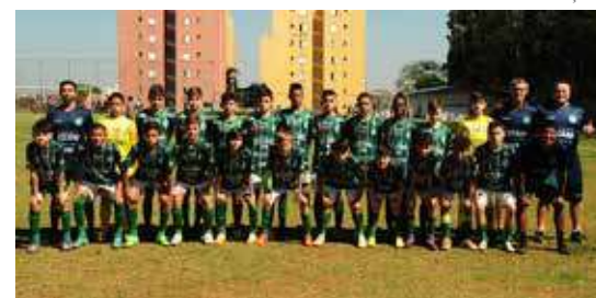
Equipe sub 12 do Guarani FC

08h - Guarani FC x SC Paulínia (S10) 09h - Guarani FC x SC Paulínia (S11) 10h - Guarani FC x SC Paulínia (S12) 11h - Guarani FC x SC Paulínia (S13) 12h - Guarani FC x SC Paulínia (S14)