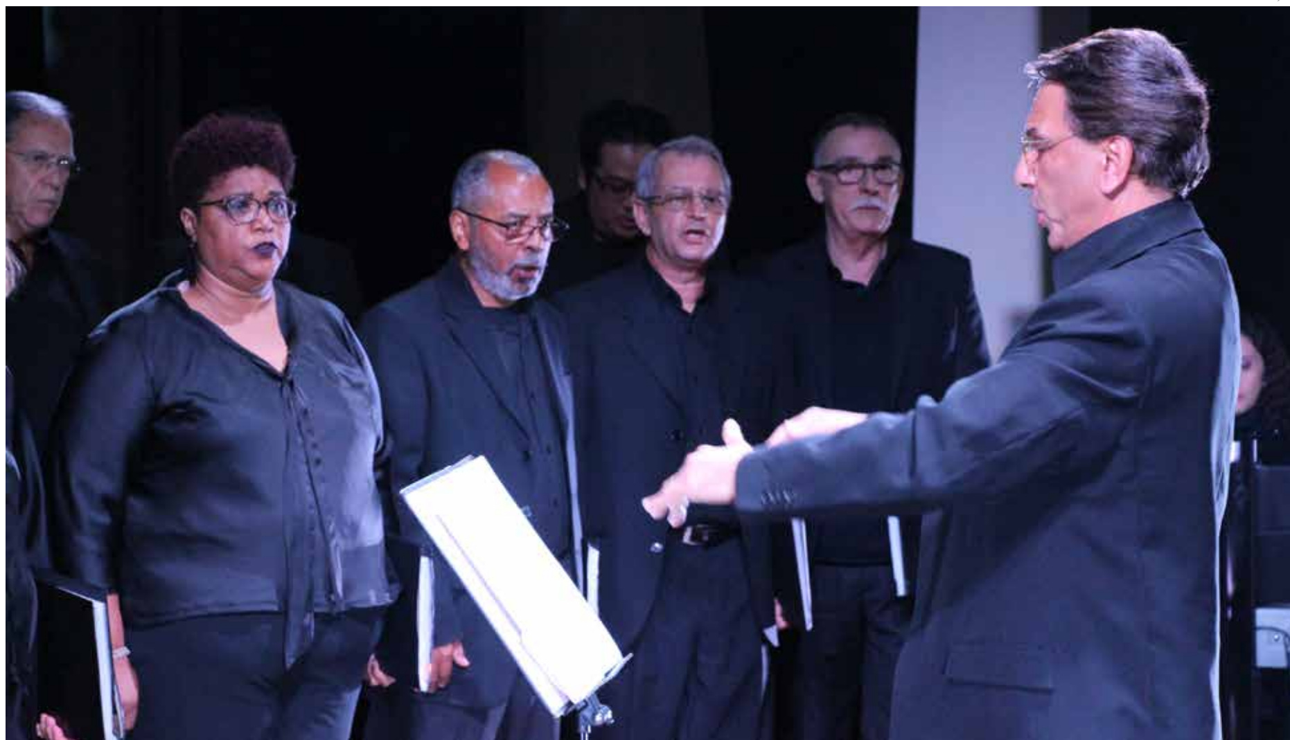
Evento realizado a partir das 20h30 na Igreja Matriz

Eles próprios se definem como abertos a uma grande