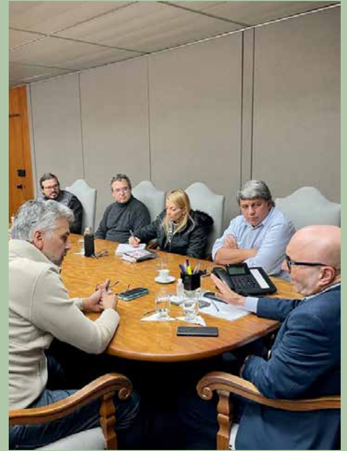
Reunião ocorreu na segunda-feira, 10

As prefeituras de Jaguariúna e de Campinas ratificaram nesta semana a retomada do projeto de ampliação do trajeto da Maria Fumaça até a Praça Arautos da Paz, em Campinas. O projeto prevê o