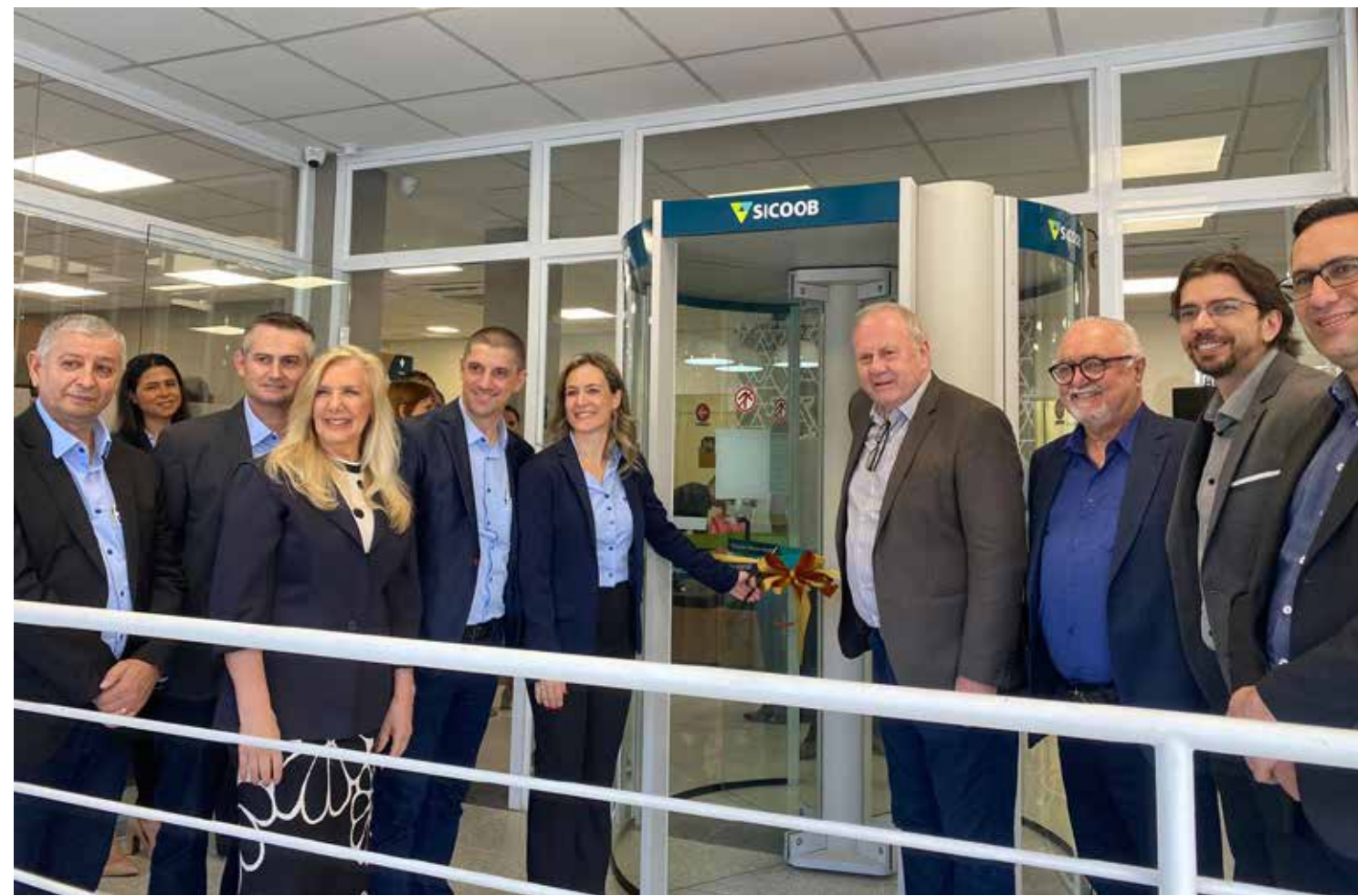
Inauguração do Sicoob Integrado reuniu autoridades na manhã de quinta-feira, 13

Instalado na cidade há cerca de três anos apenas com escritório para negócios, o Sicoob teve suas atividades expandidas