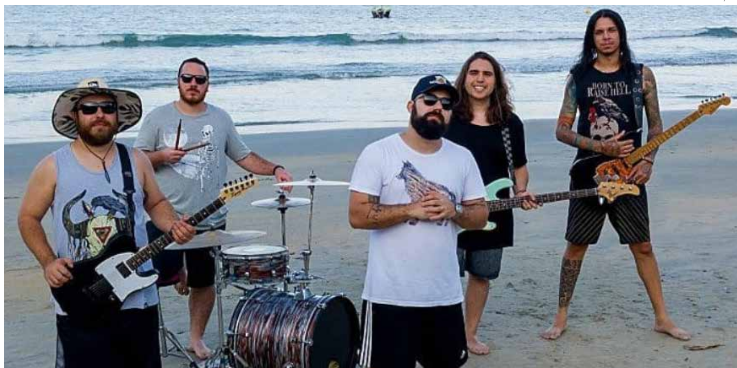
A Banda Valquíria já se apresentou em Jaguariúna, Campinas, Americana, Amparo, Pedreira, Mogi Mirim, Mogi Guaçu, Pirassununga, sul de Minas Gerais e outros

A data é especial, sobretudo, porque o rock posiciona-se como o terceiro gênero musical mais ouvido no Brasil no primeiro semestre deste