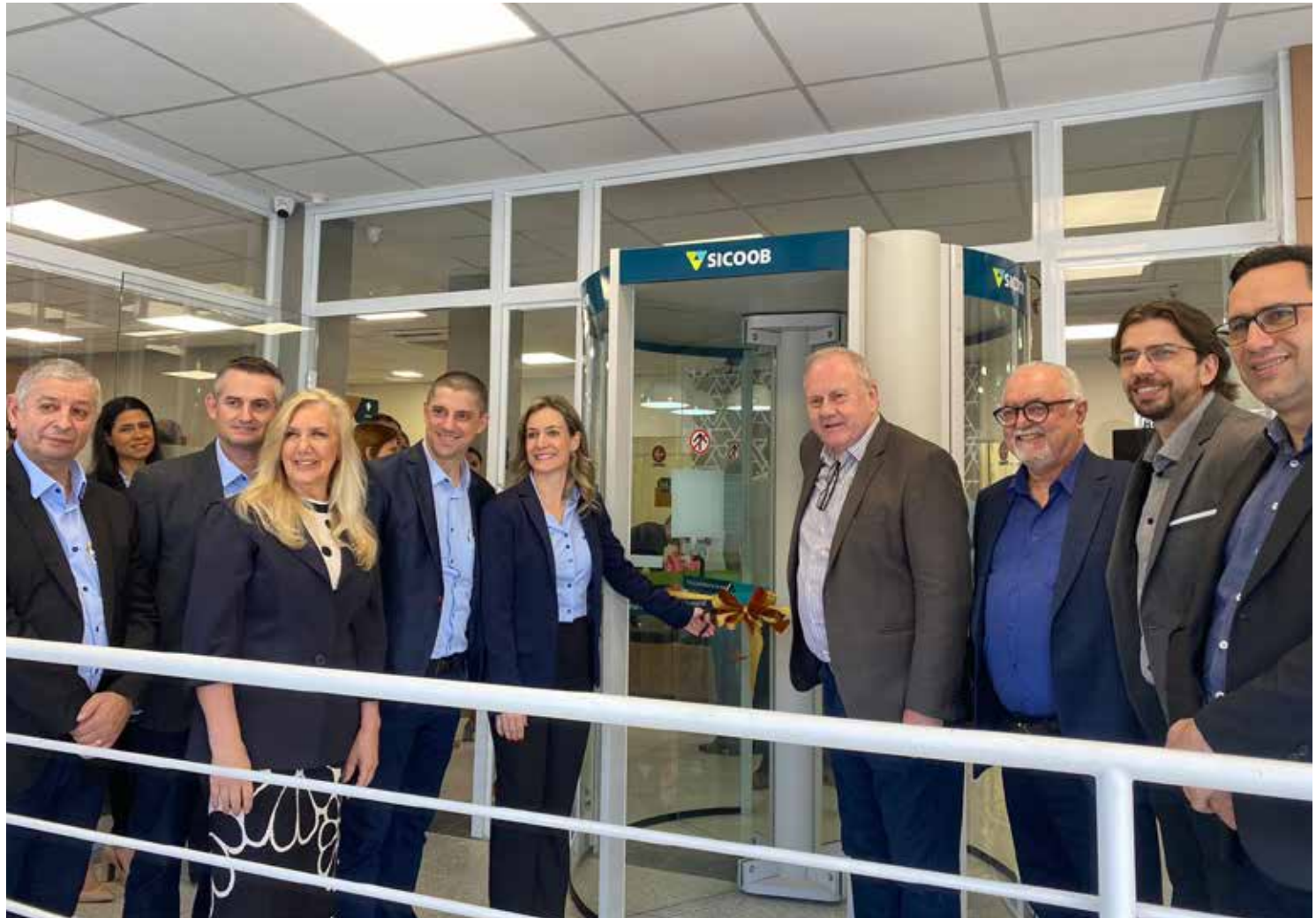
Inauguração do Sicoob Integrado reuniu autoridades na manhã de quinta-feira, 13

Na agência inaugurada, supermoderna, o cooperado tem acesso ao atendimento personalizado, autoatendimento e possibilidades de outros serviços, como transferências e pagamentos. A gestora da agência, Fran-