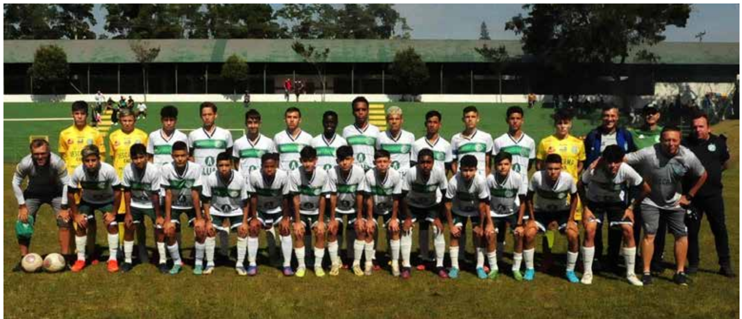
Equipe sub 14

A comissão organizadora: Aproveitamos a oportunidade para agradecer a todas as agremiações, seus respectivos jovens atletas, integrantes de comissões técnicas, familiares, parceiros, colaboradores pela confiança em nossa competição e parabenizamos a todos pela excelente competição que realizaram nessa edição, onde o equilíbrio prevaleceu em todas as categorias graças ao belo trabalho e profissionalismo de todos os envolvidos, pois só quem comanda essa garotada sabe com o é difícil porém gratificante, sendo assim, fica aqui nossos parabéns e nossos agradecimentos.