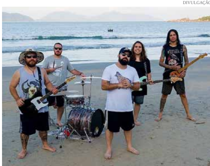
A Banda Valquíria já se apresentou em Jaguariúna, Campinas, Americana, Amparo, Pedreira, Mogi Mirim, Mogi Guaçu, Pirassununga, sul de Minas Gerais e outros