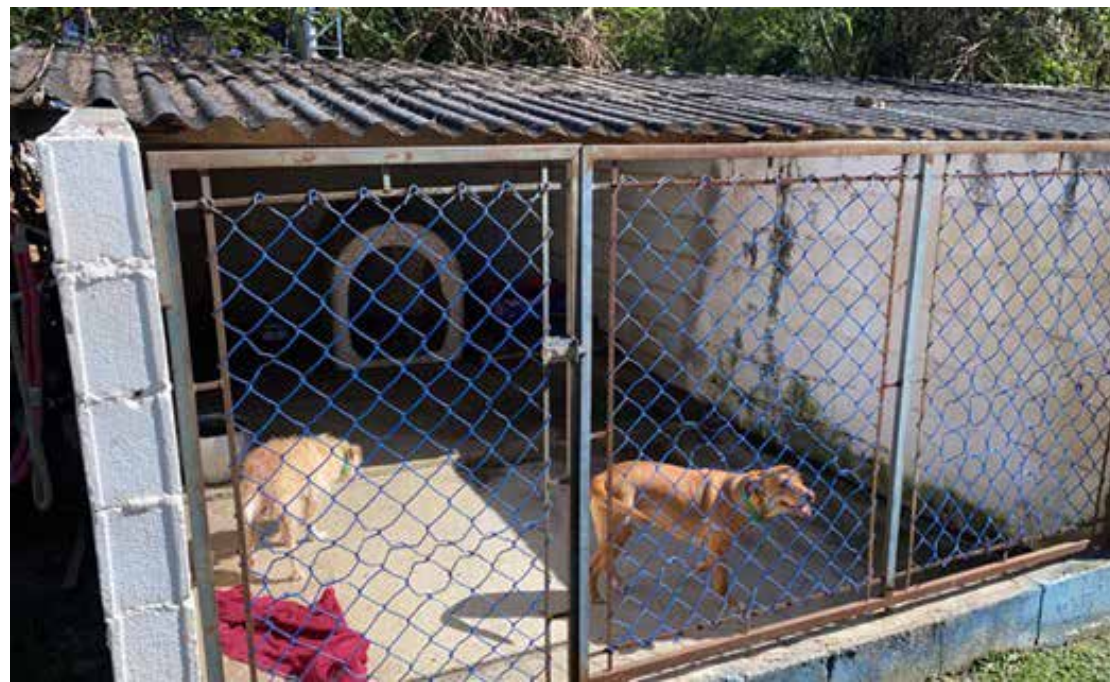
Abrigo de cães em pedreira

panha “Minha Sorte é Animal”, é necessário ser Cliente Bem-Estar, programa de fidelidade gratuito do Covabra, e se identificar no momento da compra. A cada 50 pontos em compras realizadas entre 1º de julho e 03 de