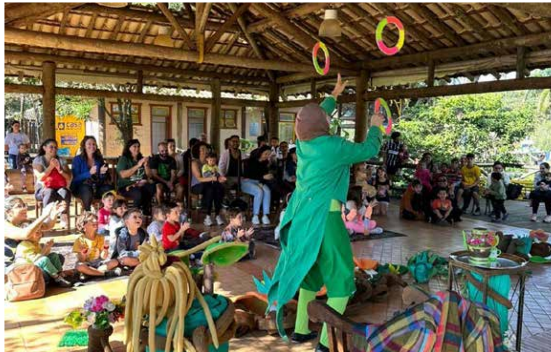
Diversas oportunidades de distrair a criança com atividades culturais

Quem ainda não curtiu ou já está aproveitando o Festival de Férias de Jaguariúna vai ter mais motivos para não perder a programação recheada de atrações e eventos gratuitos. A Secretaria Municipal de Turismo e Cultura de Jaguariúna divulgou a programação da segunda quinzena de julho, com opções de entretenimento e lazer para