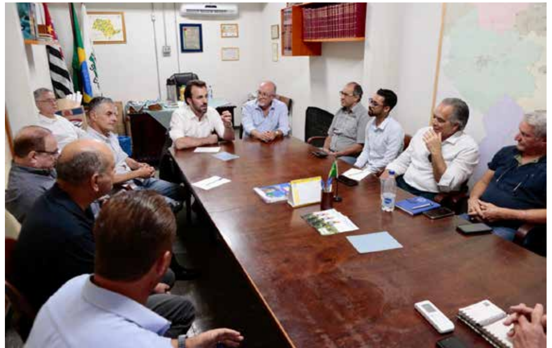
Visita ocorreu na terça-feira, 11

O Deputado Estadual Lucas Bove (PL) esteve em Jaguariúna na terça-feira, 11, para encontro com lideranças políticas e do agronegócio da Região Metropolitana de Campinas (RMC). A agenda começou cedo, quando Lucas visitou Holambra e retornou para o almoço em Jaguariúna.