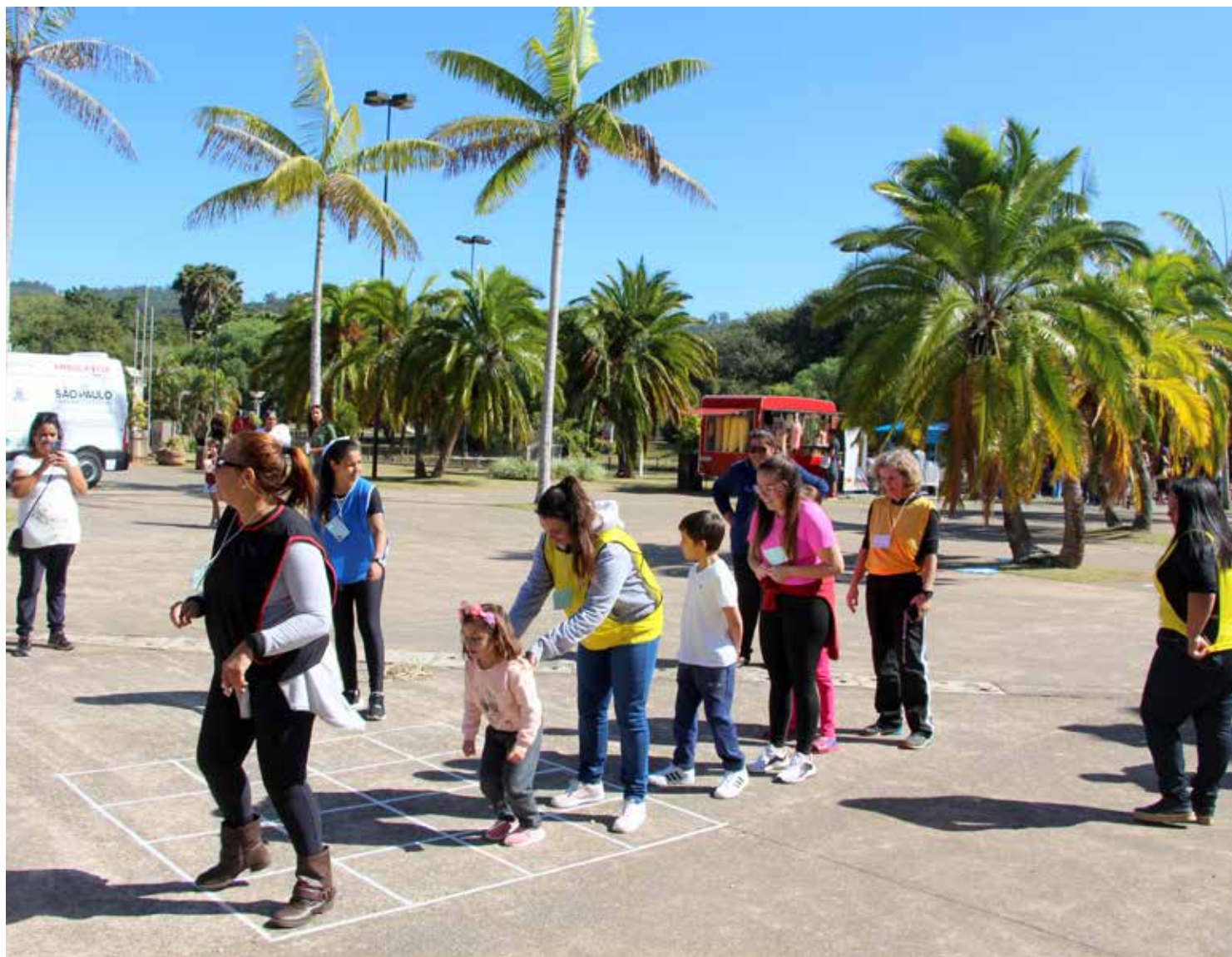
As brincadeiras em grupo facilitam o convívio social

- 22 a 24 de maio: Café com Conversa para os pais