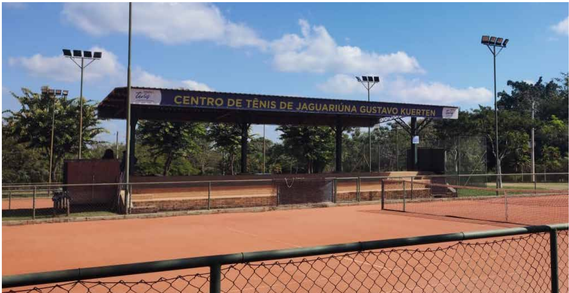
O Centro de Tênis de Jaguariúna fica no bairro de Guedes

A tecnologia LED (diodo emissor de luz) é a uma das formas mais funcionais do mundo eletrônico. A lâmpada de LED é muito mais eficiente que as demais, pois utiliza 95% de sua energia para geração de luz. Ou seja, apenas 5% da energia é desperdiçada. Já as lâmpadas incandescentes dispersam 50% da energia em forma de calor. Por isso aquecem muito mais o ambiente, diferentemente das