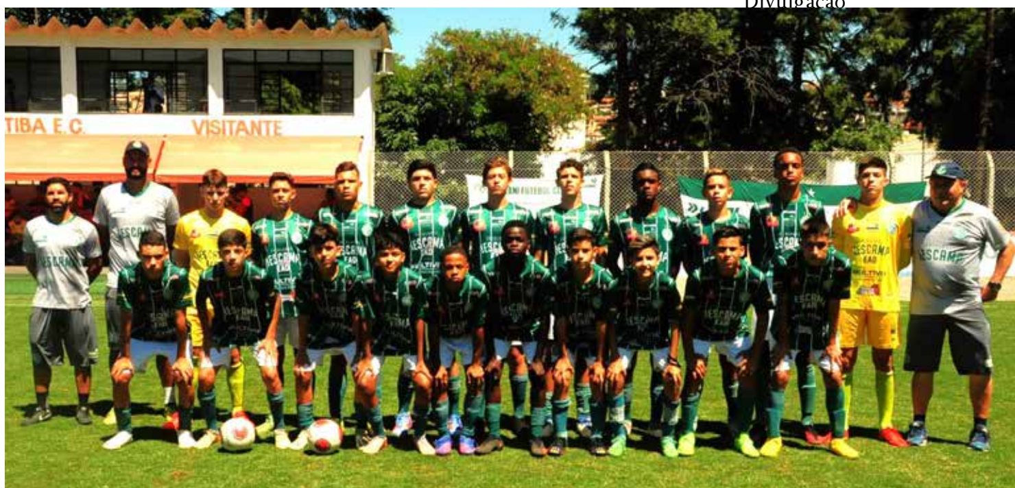
Equipe sub 14 do Guarani FC

Na manhã deste sábado, 13, as equipes do Guarani FC recebem as equipes do SC Paulínia pelas categorias sub 10, 11, 12 e 13 e na categoria sub 14 o adversário será a equipe do Velo Clube de Rio Claro. Todos os jogos serão realizados no campo do Rio Branco em Amparo e em caso de vitórias, as cinco categorias bugrinas poderão assumir a liderança dos respectivos grupos e ainda garantirem a classificação para a segunda fase da competição entre os quatro