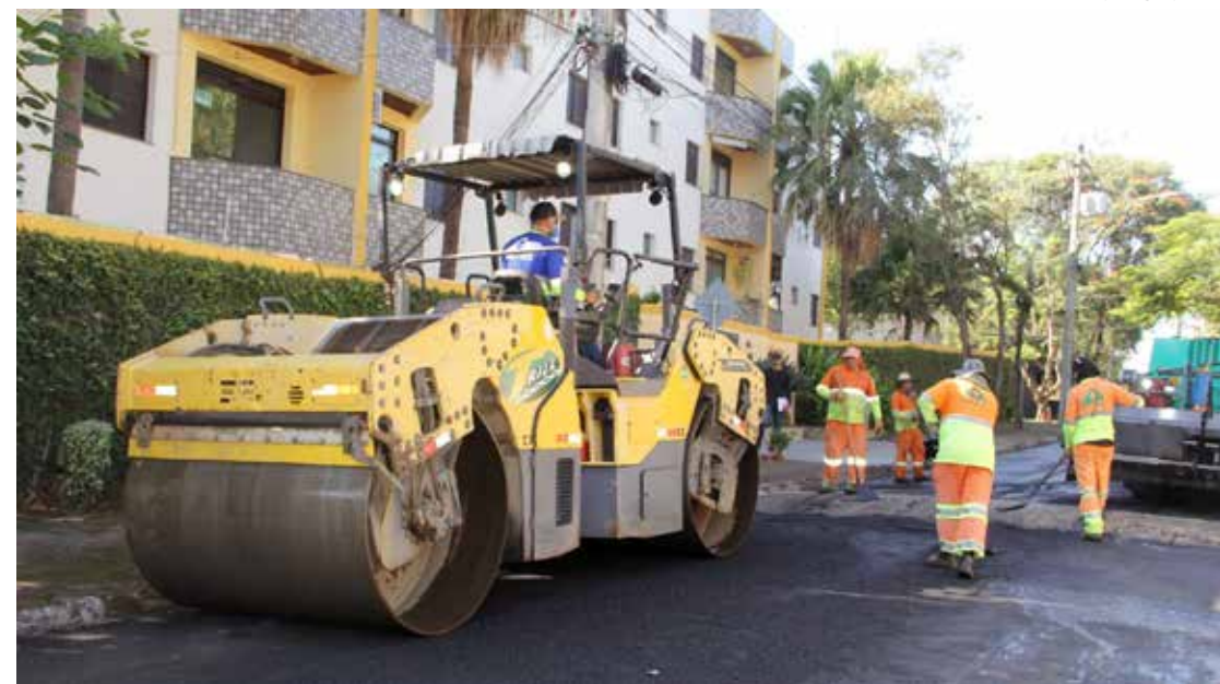
O trabalho de recapeamento teve início nesta semana

terça-feira, 09, e devem impactar o trânsito nos locais. Por isso, a orientação é para que os motoristas evitem a região das obras. Segundo a Secretaria de Obras e Serviços, a previsão para a conclusão do trabalho nos três bairros é de até 30 dias.