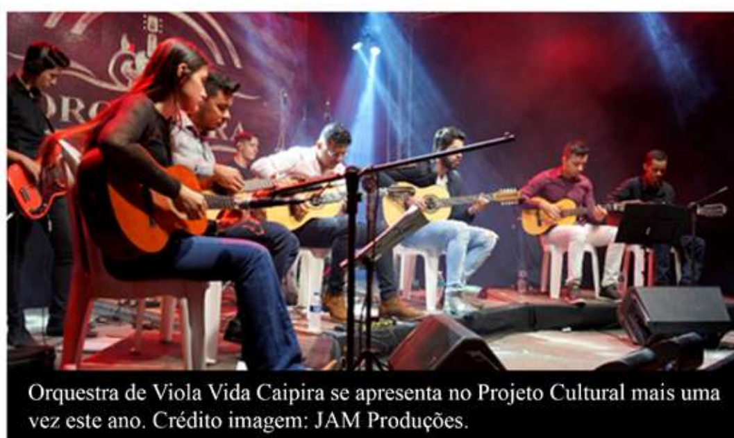
Orquestra de Viola Vida Caipira se apresenta no Projeto Cultural mais uma vez este ano. Crédito imagem: JAM Produções.

O Projeto Cultural Vida Caipira é gratuito, aberto ao público e traz toda a acessibilidade necessária para atender a população: banheiros químicos, banheiros adaptados para cadeirantes, intérpretes de libras para traduzir o evento ao vivo, além de segurança para que as famílias curtam o evento com tranquilidade na véspera do Dia das Mães.