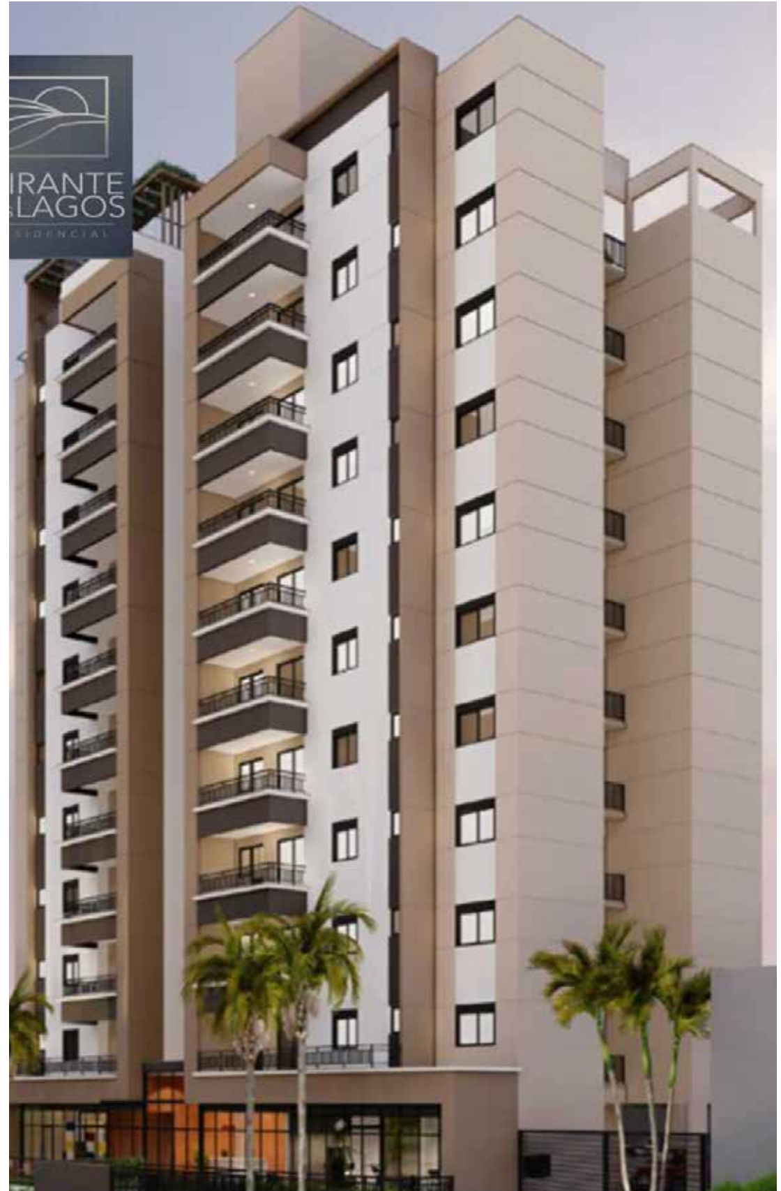
Fotos mostram como está a construção e como ficará ao término

A imobiliária Solvanil está coordenando as vendas dos apartamentos do Mirante dos Lagos, edifício na Av. Antônio Pinto Catão, 642, no Jardim dos Ipês, um dos bairros mais nobres da cidade. O Mirante terá torre única com 10 andares, apartamentos com 3 dormitórios, sen-