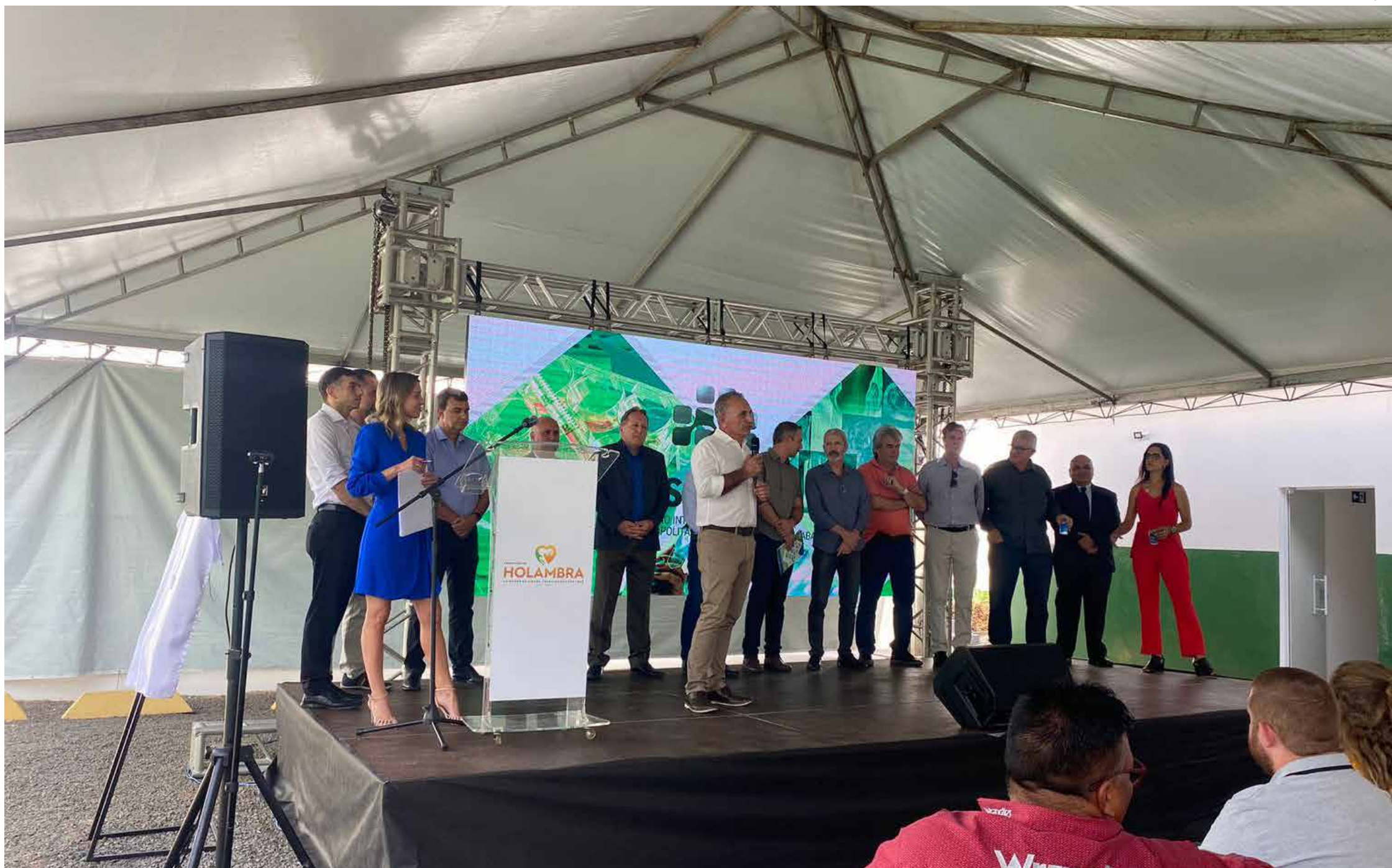
A cerimônia de inauguração contou com autoridades e convidados

O Consórcio Intermunicipal de Saúde da Região Metropolitana de Campinas (Cismetro) começou em 2014 com três municípios consorciados e funcionando em um local emprestado. Nove anos depois, contando com 34 localidades, a expansão foi consagrada com uma grande conquista: sua primeira sede própria, inaugurada