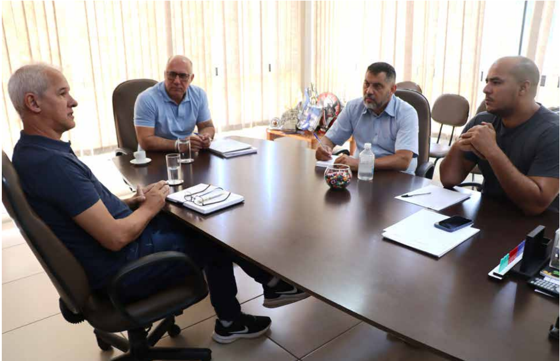
Reunião entre autoridades morungabenses e representante da empresa responsável por parte da troca do parque de iluminação

“Estamos honrando mais um compromisso firmado com a população. O programa ‘Morungaba 100% LED’ vai resultar em segurança e economia. As cidades mais iluminadas têm menos índices de criminalidade, além de ampliar o aproveitamento dos espaços públicos pela população no período noturno. São fatores que acabam por melhorar a qualidade de vida e fazem também com que o comércio seja beneficiado, principalmente em épocas com mais movimento”,