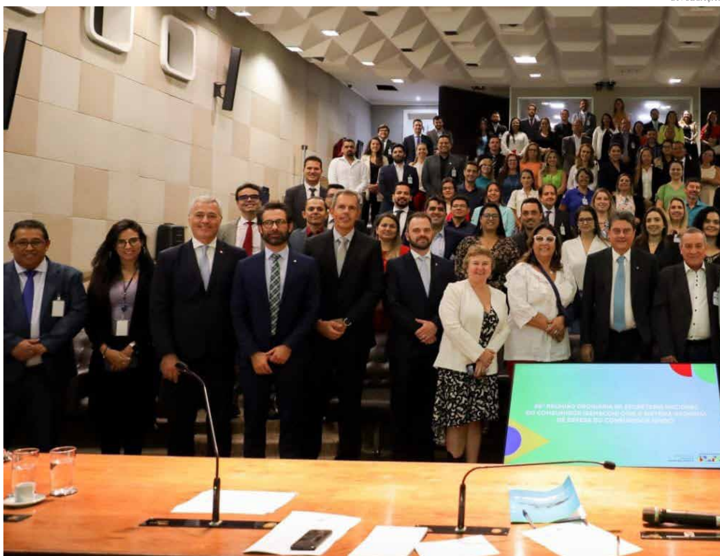
Reunião ocorreu nos dias 02 e 03 de março em Brasília

A Senacon tem o poder de autuar (multar), e, é responsável pelas políticas públicas federal no âmbito das relações de consumo, além de fazer convênios com os Estados e Municípios no envio de recursos para investimentos em capacitação e de mobiliários para fortalecimentos dos Procons em todo o território nacional.