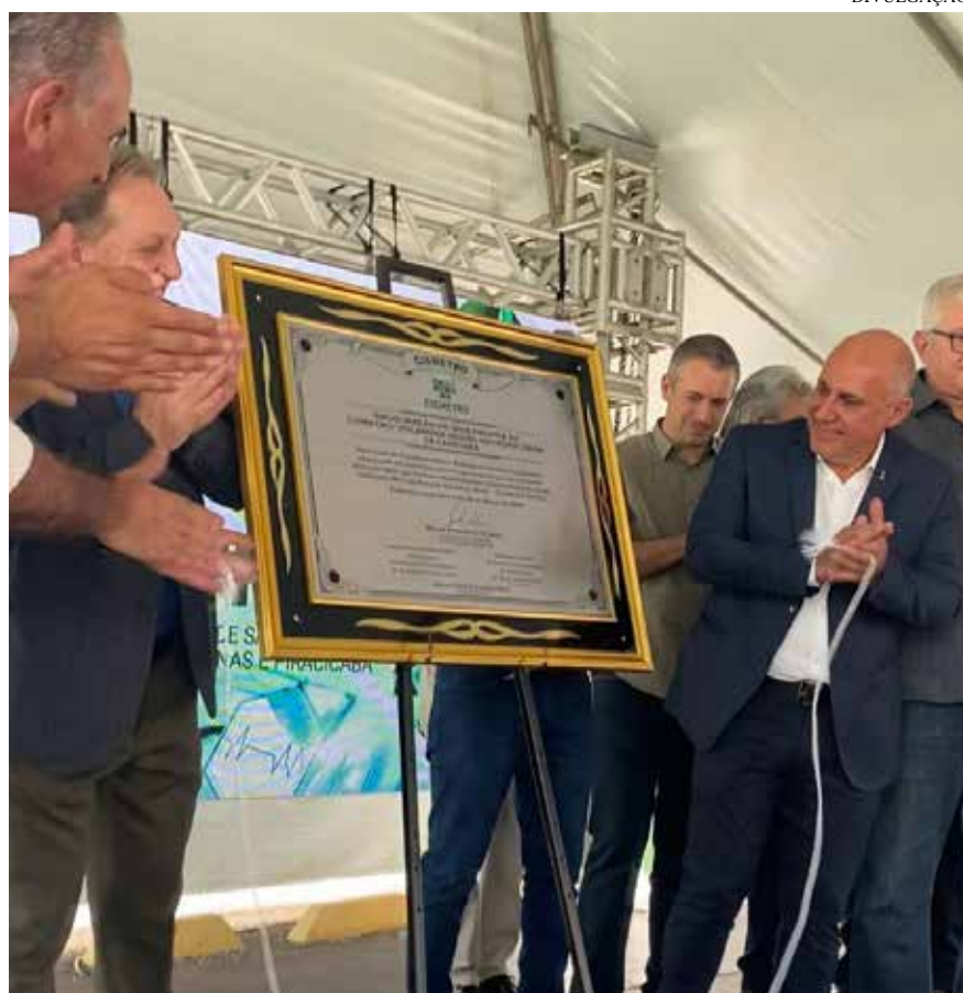
A cerimônia de inauguração contou com autoridades e convidados

O Consórcio Intermunicipal de Saúde da Região Metropolitana de Campinas (Cismetron) começou em 2014 com três municípios consorciados e funcionando em um local emprestado.