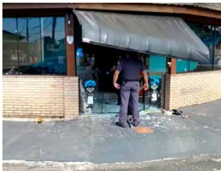
Polícia atende ocorrência de furto em Jaguariúna

Na madrugada de quinta-feira, 09, uma pizzaria localizada na Rua Coronel Amâncio Bueno, esquina com Rua Prudente de Moraes, foi vítima de furtos. Além da porta estourada,