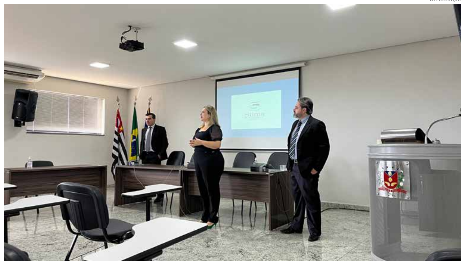
O encontro foi organizado pela Secretaria de Administração e ocorreu no salão nobre da Câmara Municipal

municipais e diretores de departamentos, entre outros servidores da Prefeitura. Material descartado Por meio de outro decreto municipal, uma comissão permanente será criada para avaliar quais documentos possuem ou não valor histórico e de uso. Dessa forma, após decisão, alguns papéis oficiais poderão ser descartados. A Comissão possuirá integrantes do Departamento de Planejamento e Administração, Departamento de Finanças e Gabinete do Prefeito. Os representantes ficarão responsáveis por separar os documentos para análise de prazos de prescrição e precaução. Exemplo de documentos com potencial de serem eliminados: guias de tramitação, cadastro de