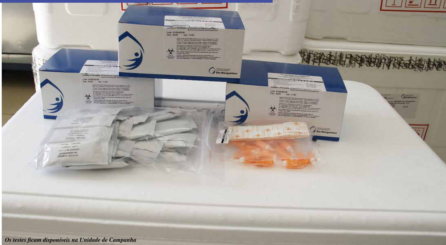
Os testes ficam disponíveis na Unidade de Campanha