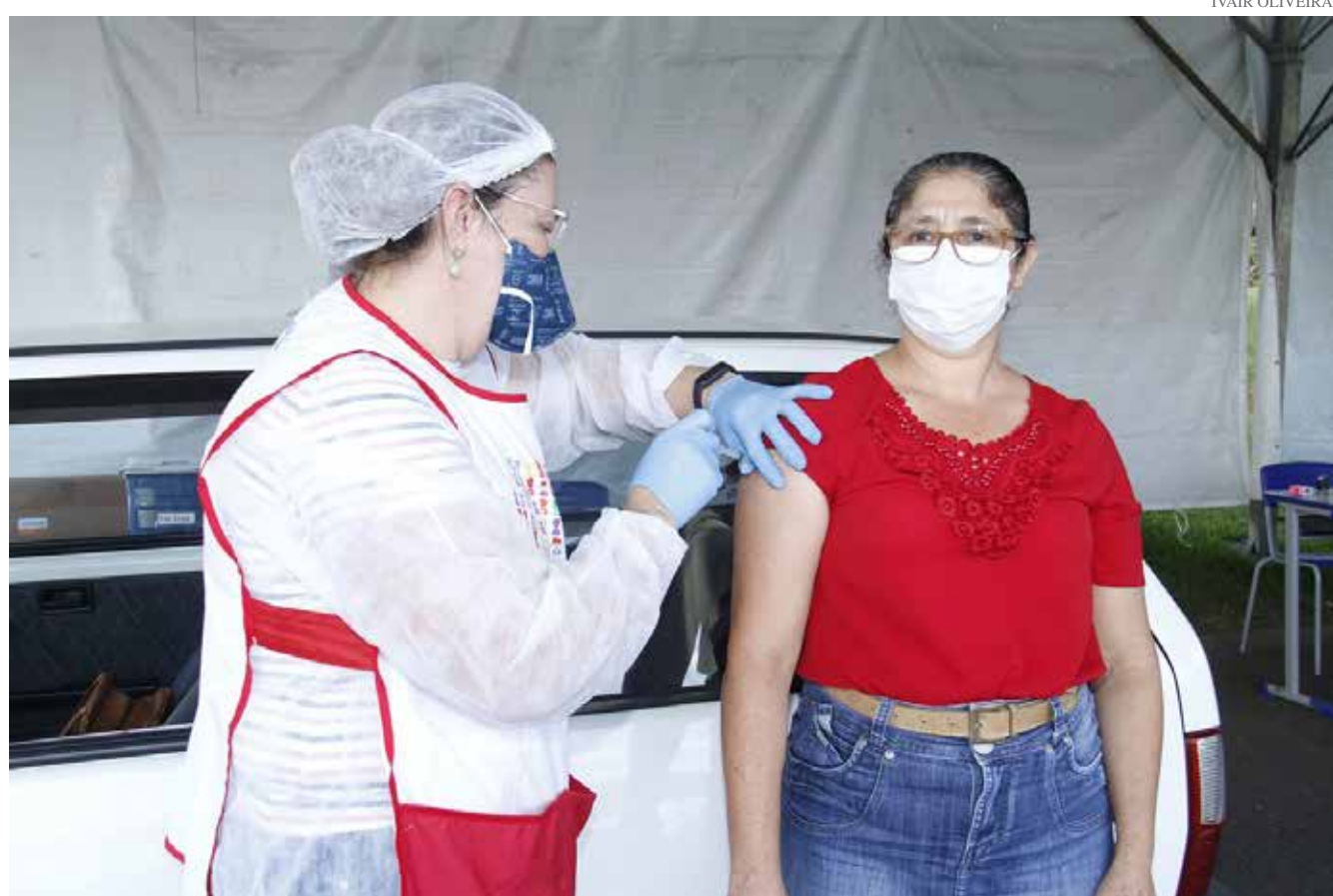
Município já aplicou 23.746 doses de vacina contra Covid-19

A Secretaria de Saúde de Jaguariúna vacinou um total de 2.249 pessoas na quarta-feira, 16, primeiro dia da imunização con-