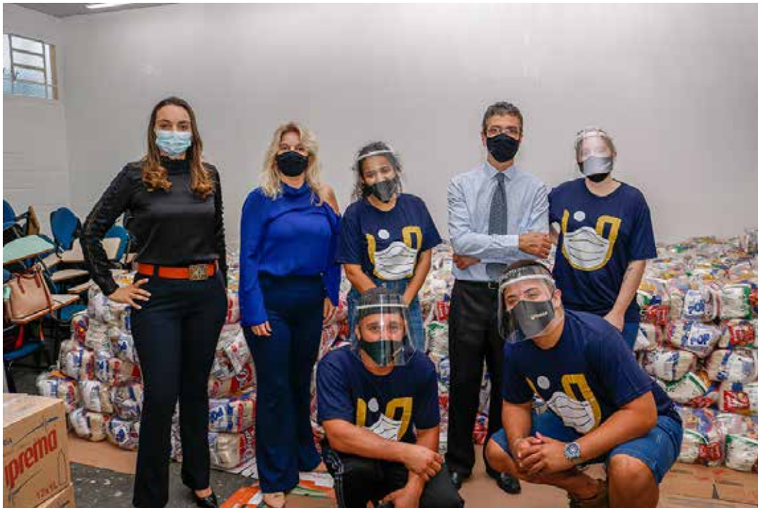
A distribuição ocorre em oito municípios

A proposta do projeto é contribuir para diminuir os impactos negativos causados pela pandemia da Covid-19. A distribuição acontece em oito municípios,