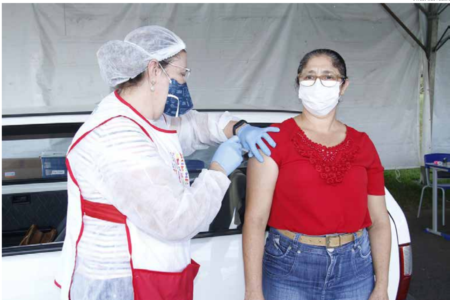
Município já aplicou 23.746 doses de vacina contra Covid-19

A vacinação continua das 9h às 19h, no Parque Santa Maria, localizado na Rua José Alves Guedes, 1.003, no Jardim Sonia. Para facilitar o atendimento, a pessoa deve fazer o pré-cadastro no site da Prefeitura (jaguariuna.sp.gov.br) no link “Cidadão” e apresentar documento com