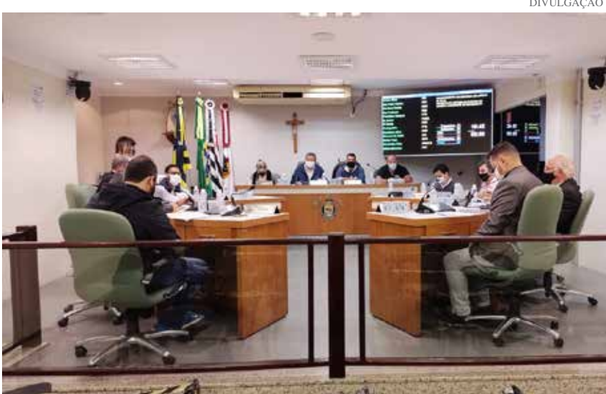
Vereadores de Jaguariúna reunidos na Câmara Municipal

A mesa diretora e os vereadores da Câmara Municipal de Jaguariúna se uniram em uma ação histórica: solicitar ao Executivo Municipal que o saldo do duodécimo não utilizado no primeiro semestre de 2021, devolvido à Prefeitura