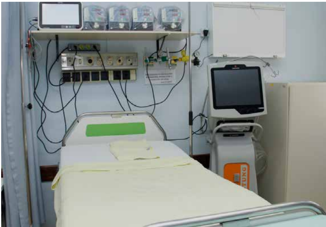
O Hospital Municipal tem, agora, oito leitos de UTI

O Hospital Municipal Walter Ferrari, em Jaguariúna, ampliou o número de leitos de Unidade de Terapia Intensiva (UTI). A unidade hospitalar recebeu mais dois leitos de UTI, passando de seis para oito leitos – um aumento de 33%. Um maior número de UTIs é essencial para a reabilitação de pacientes com problemas graves de saúde, como as síndromes respiratórias e outras complicações provocadas pelo