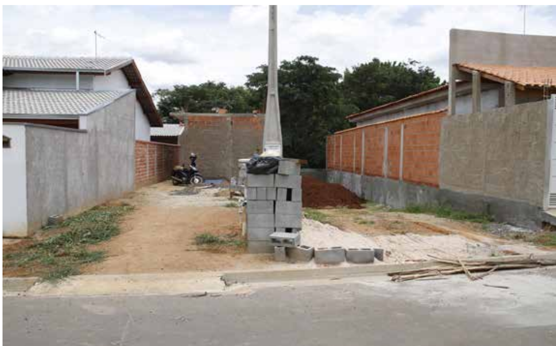
Os benefícios estão previstos na Lei Complementar Municipal nº 322/2018

A prorrogação do prazo foi aprovada no final do ano passado pela Câmara Municipal