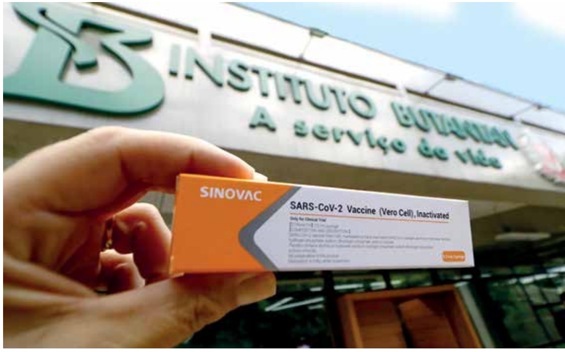
O Plano Estadual de Imunização prevê início da campanha em 25 de janeiro, após autorização da Anvisa

Esses dados de eficácia foram apresentados em uma reunião com a Agência Nacional de Vigilância Sanitária (Anvisa), que é o responsável pela aprovação da vacina para uso no País. A taxa