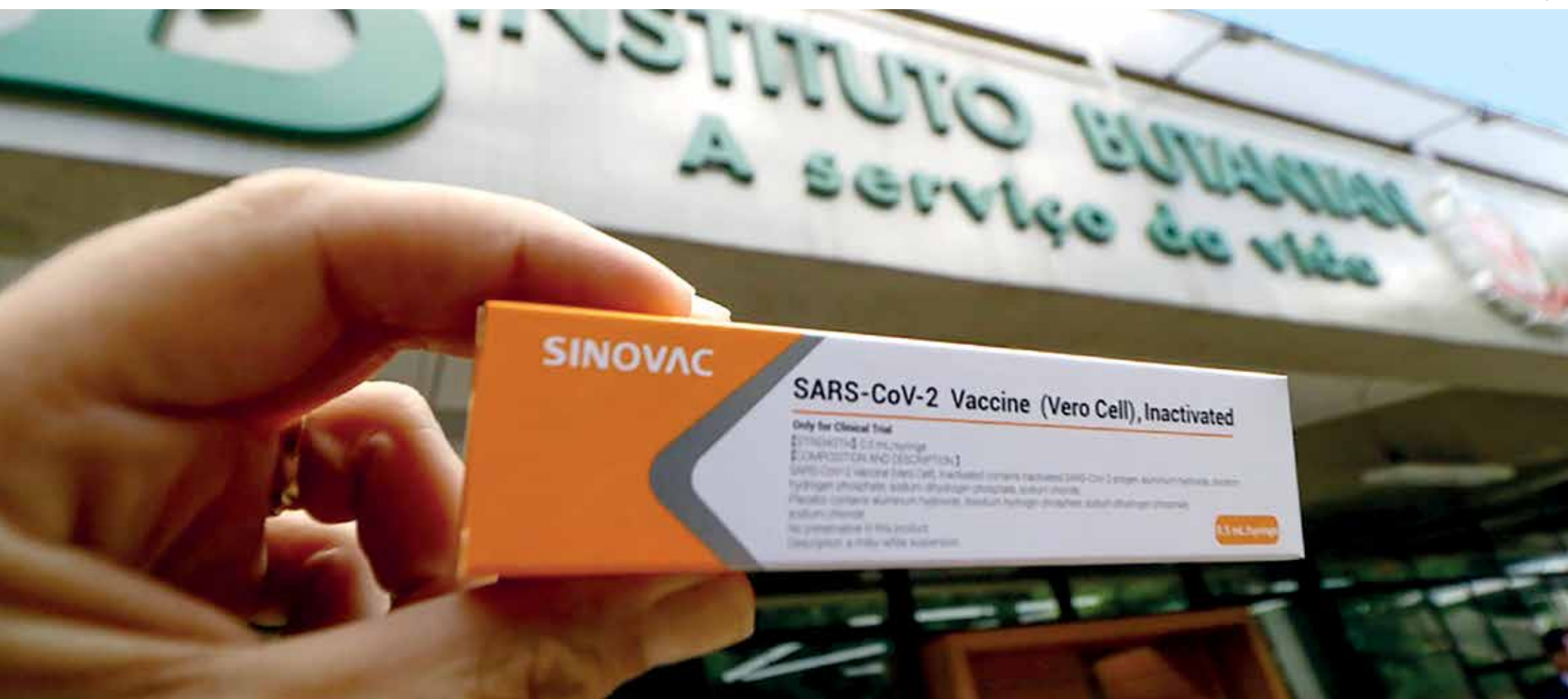
O Plano Estadual de Imunização prevê início da campanha em 25 de janeiro, após autorização da Anvisa

A CoronaVac, vacina contra o novo coronavírus que é produzida pelo Instituto Butantan