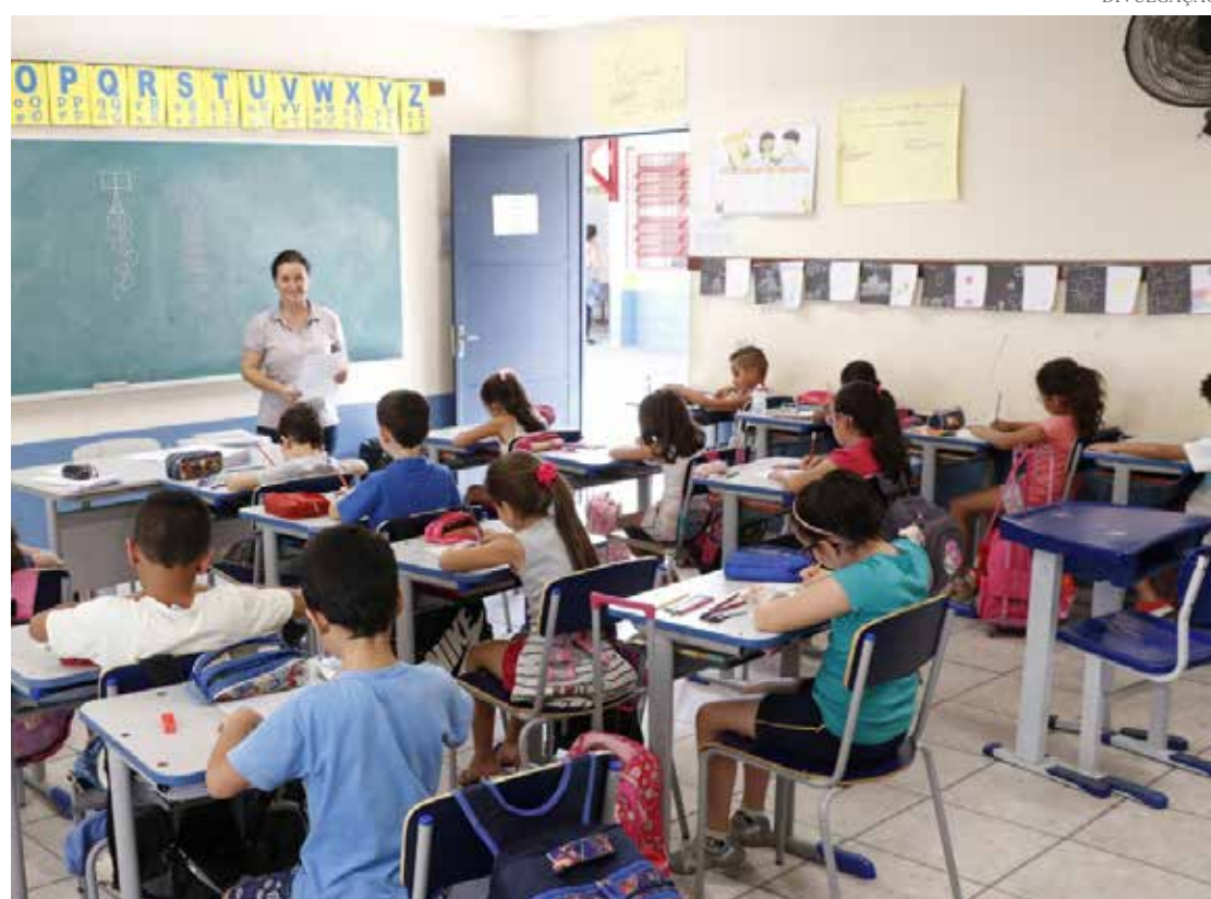
A cidade apresenta desempenho crescente no estudo