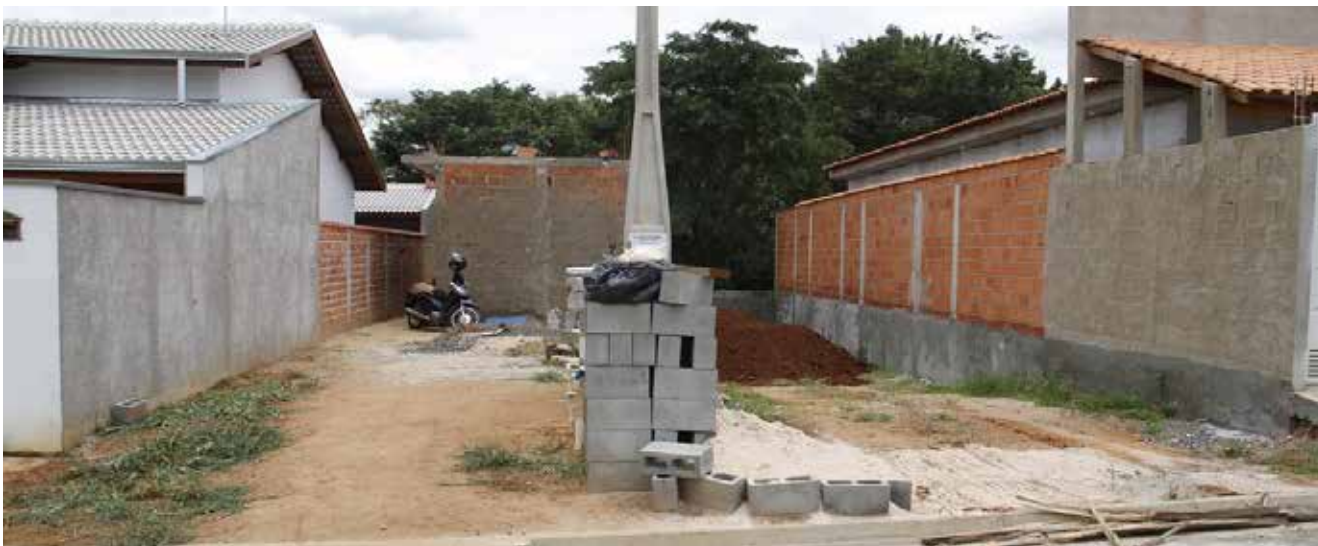
Os benefícios estão previstos na Lei Complementar Municipal nº 322/2018

A Prefeitura de Jaguariúna prorrogou até o dia 17 de dezembro deste ano o prazo para aprovação de projetos construtivos residenciais em lo-