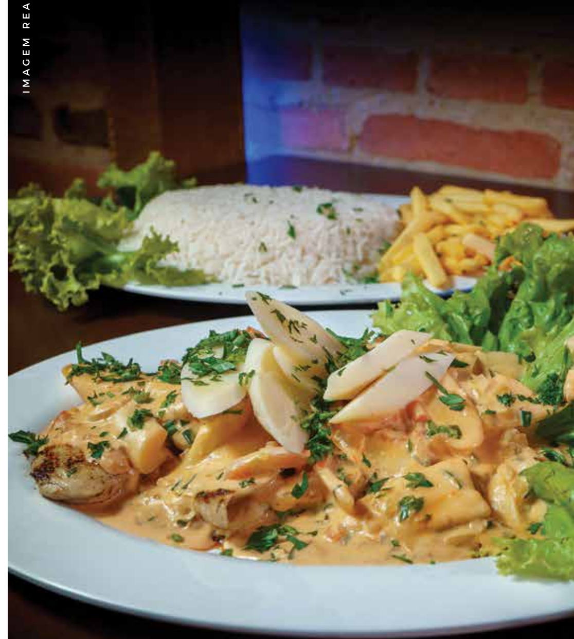
IMAGEM REAL DO PRODUTO