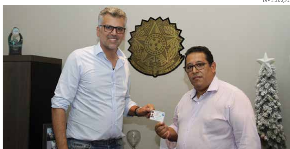
Prefeito Gustavo Reis e Edison Cardoso de Sá

duto e serviços aos consumidores de acordo com o Código de Defesa do Consumidor (CDC). “As fiscalizações e autuações são regidas pelas leis vigentes em nosso País e seguindo as orientações da Fundação Procon do Estado de São Paulo”, explica o diretor.