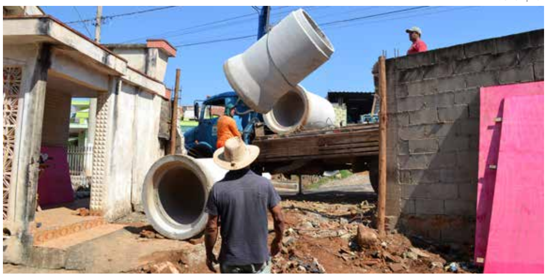
Os serviços se fazem necessários para atender a demanda

tramos uma chuva muito forte na noite da segunda-feira, 09, e a rede existente na Rua Tercília Trevisan não deu conta e infelizmente a água invadiu parte das casas. Com essa nova rede, estaremos solucionando este grave problema”, explica.