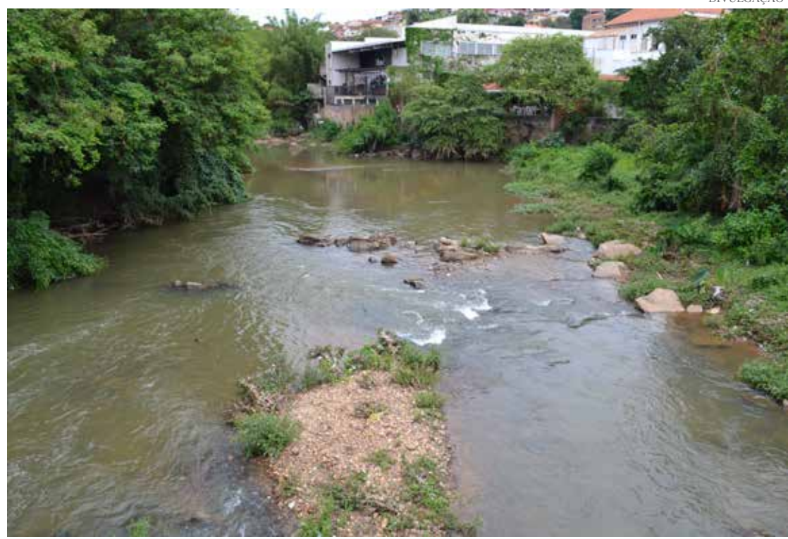
Amparo, Artur Nogueira, Campinas, Holambra, Jaguariúna e Santo Antônio de Posse são alguns municípios que integram a bacia PCJ

O Departamento de Água e Energia Elétrica, do Governo do Estado, informou que a construção da Barragem de Duas Pontes, em Amparo, continua paralisada por causa de uma decisão da Justiça Federal e que já recorreu. Sobre a Barragem de Pedreira, disse que as obras estão em andamento e devem ser concluídas em 2022.