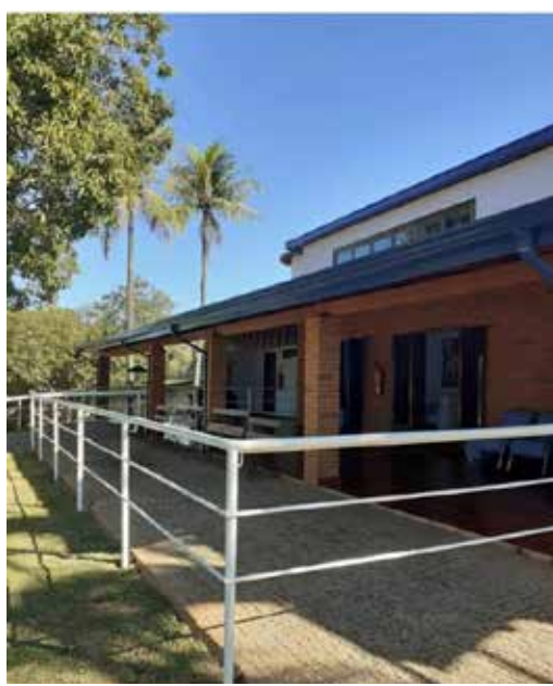
Bosque Jaguaribe Hospedagem Geriátrica

E o terceiro ponto diferencial da Casa, é a equipe multiprofissional. “Contamos com toda uma equipe de saúde voltada para o acolhimento e cuidados