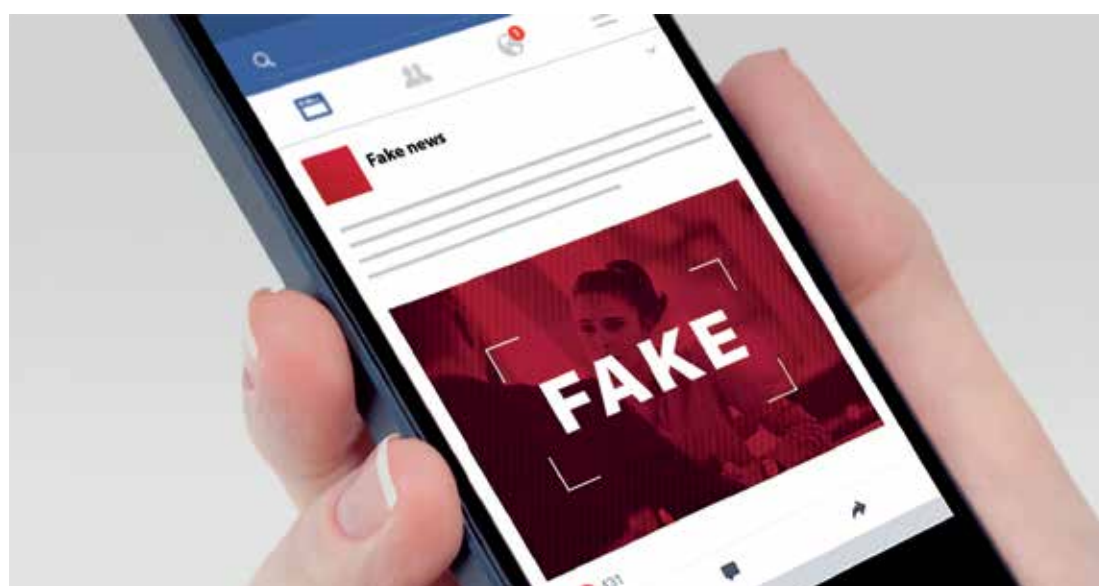
As liminares foram concedidas pelo juiz eleitoral da 333ª Zona Eleitoral de Pedreira

do e transcrito na inicial notícia fatos referentes à atual administração do