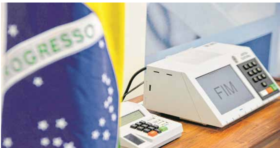
As eleições municipais de 2020 devem mobilizar milhões de brasileiros em 5.568 cidades

Neste domingo, 15, é dia de escolher quem vai ocupar as cadeiras de prefeito e vereador pelos próximos quatro anos. Em todo Estado, segundo a posição do Cadastro de Eleitores de outubro de 2020, há 33.565.292 pessoas aptas a votar. O eleitorado da zona 333ª – Pedreira, que abrange os municípios de Pedreira, Jaguariúna e Santo Antônio de Posse, é de aproximadamente 94.714.