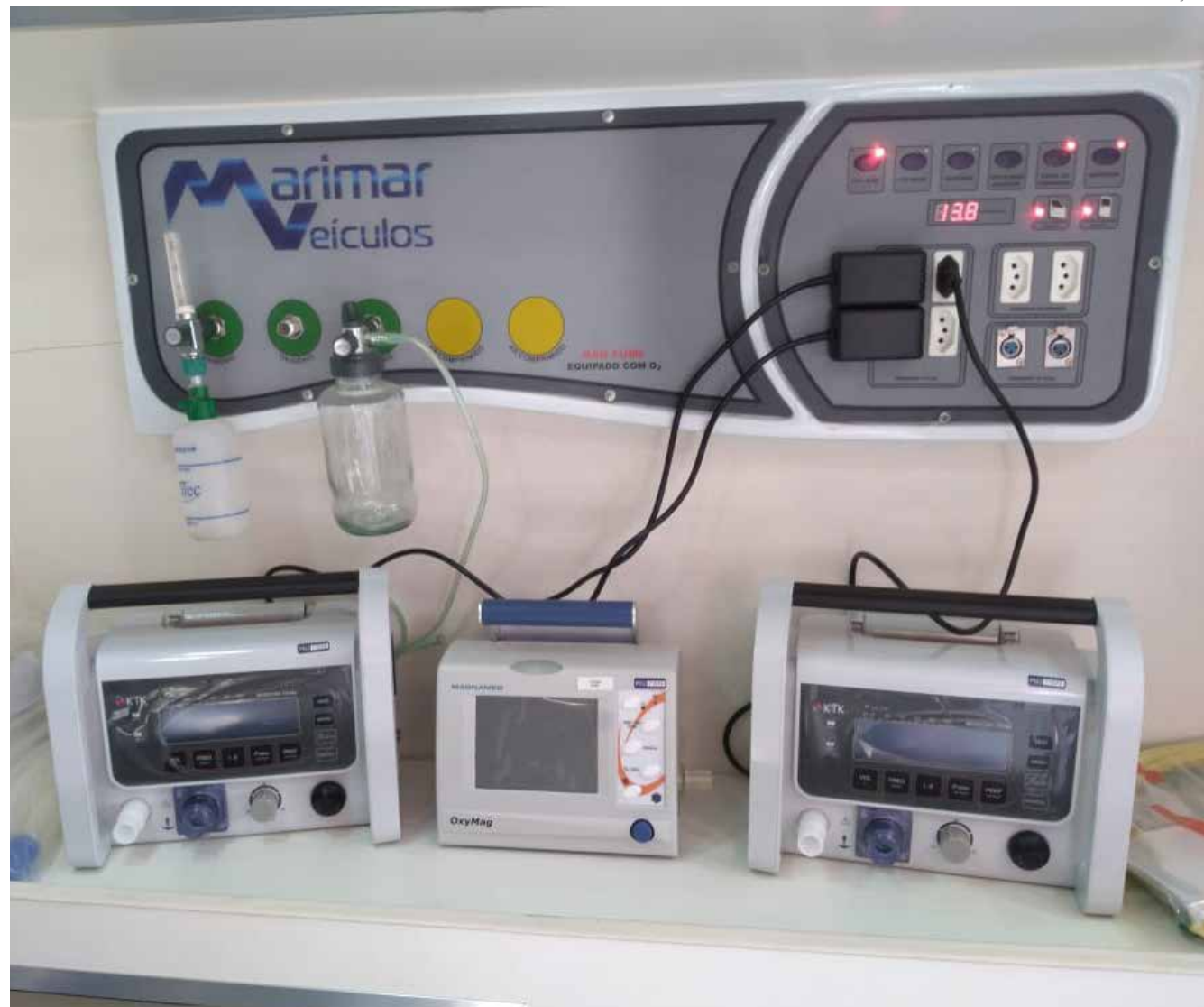
Aparelhos foram recebidos do Ministério da Saúde e do Estado

Com o aumento da demanda por causa da pandemia do novo coronavírus, o setor de urgência e emergência da saúde pública de Jaguariúna recebeu um refor-