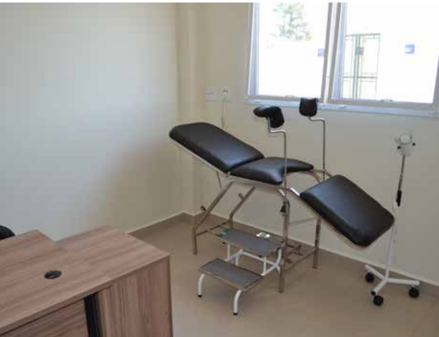
Nova unidade iniciou suas atividades nesta semana

A Prefeitura de Pedreira e o Governo do Estado de São Paulo, por meio do Programa “Saúde em Ação”, financiado pelo Banco Interamericano de Desenvolvimento (BID), construíram uma nova Unidade Básica de Saúde no município. O