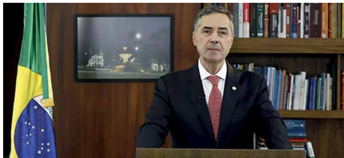
Presidente do TSE, Luís Roberto Barroso

O presidente do TSE destaca ainda a importância de os eleitores exercerem seu direito ao voto e seu dever de lutar pela democracia. “O Brasil é a quarta maior democracia do mundo. Na democracia, somos todos livres e iguais. Ou, pelo menos, devemos lutar para que seja assim. Não abra mão da sua chance de fazer diferença”, afirma.