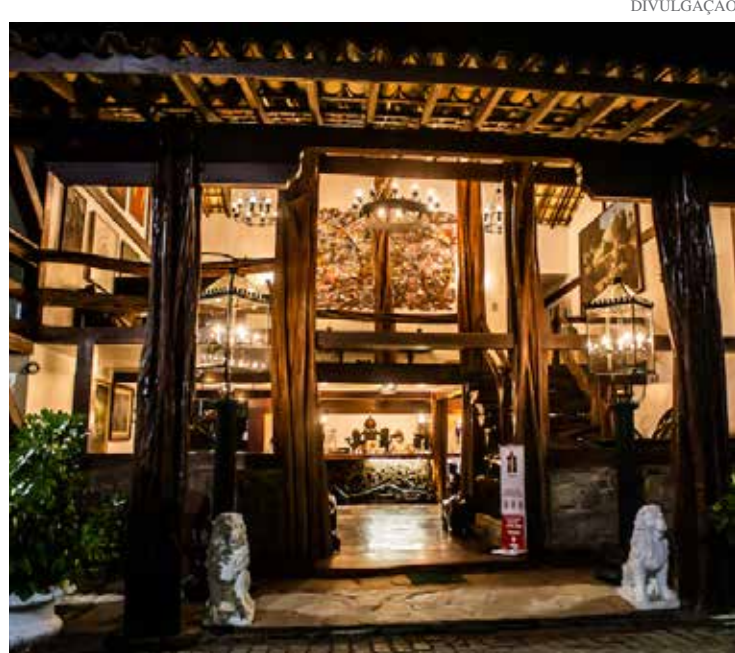
Amparo, Artur Nogueira, Campinas, Holambra, Jaguariúna e Santo Antônio de Posse são alguns municípios que integram a bacia PCJ

Segundo Grimm, a reestruturação das áreas turísticas e os investimentos em