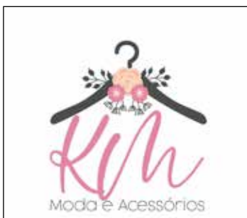
Loja de moda feminina

A loja física não conseguiu manter-se um mês devido a queda significativa de vendas. Com isso, Keli recorreu as redes