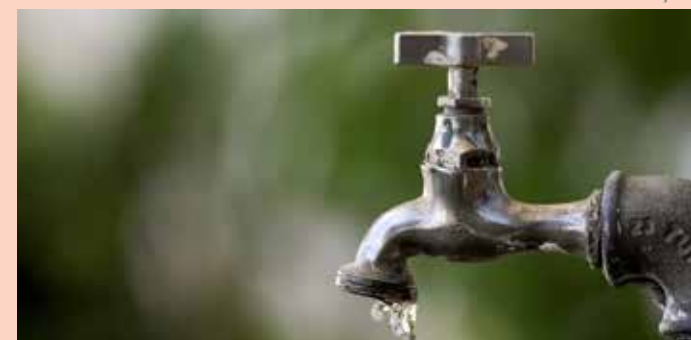
Qualidade da água em Santo Antônio de Posse

A Agência Reguladora dos Serviços de Saneamento das Bacias dos Rios Piracicaba, Capivari e Jundiá (Ares-PCJ) emitiu os resultados de mais uma coleta de amostras que certificam a qualidade da água distribuída nos municípios associados a PCJ.