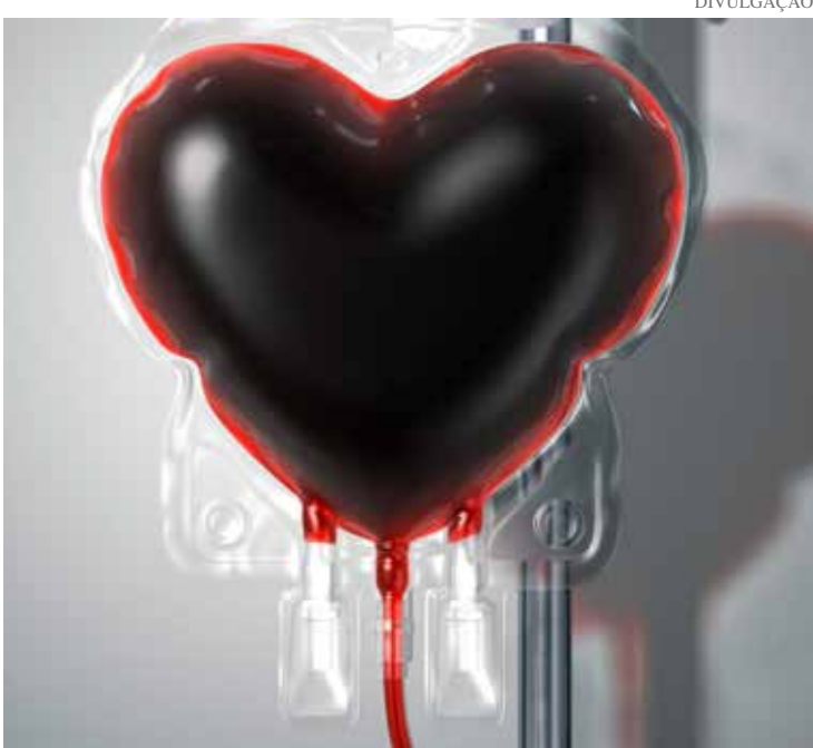
A secretária pede para que o doador não leve acompanhantes

A Secretaria de Saúde de Pedreira e o Hemocentro da Universidade de Campinas (Unicamp) realizam na quinta-feira, 02, a Campanha de Coleta de Sangue nas dependências do Salão Paroquial da Igreja Matriz de Sant'Ana. A distribuição de senhas tem início às 7h e das 8h30 às 12 horas são realizados os procedimentos de preenchimento das fichas e a coleta.