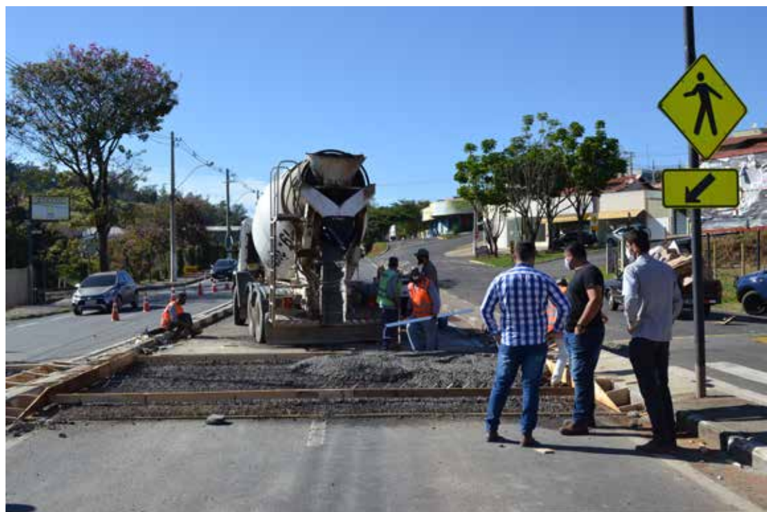
Devem ser instaladas 30 lombofaixas na cidade

Os serviços estão sendo coordenados pelas secretarias municipais de Obras e Vias Públicas, Segurança e Cidadania, contando com o apoio da Divisão de Trânsito (DITRAN).