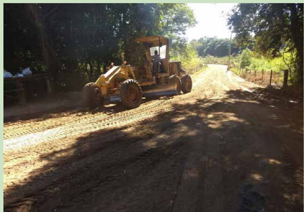
O trabalho tem por objetivo dar condições para o escoamento agrícola na região

A Prefeitura de Amparo, por meio da Secretaria de Infraestrutura e Serviços, realizou nesta semana serviços de manutenção nas estradas rurais do bairro do Brumado. O trabalho tem por objetivo dar condições para o escoamento agrícola na região.