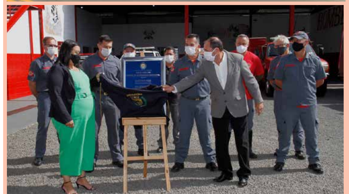
A nova sede está localizada na Rua Maranhão, nº 1.808, no bairro Capotuna

A Prefeitura de Jaguariúna inaugurou nesta semana, a nova sede da Defesa Civil e do Corpo de Bombeiros do município. A cerimônia oficial de entrega do espaço foi transmitida ao vivo pelas redes sociais da administração.