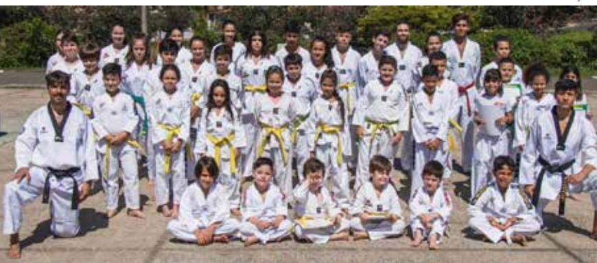
O taekwondo é uma arte marcial e esporte olímpico