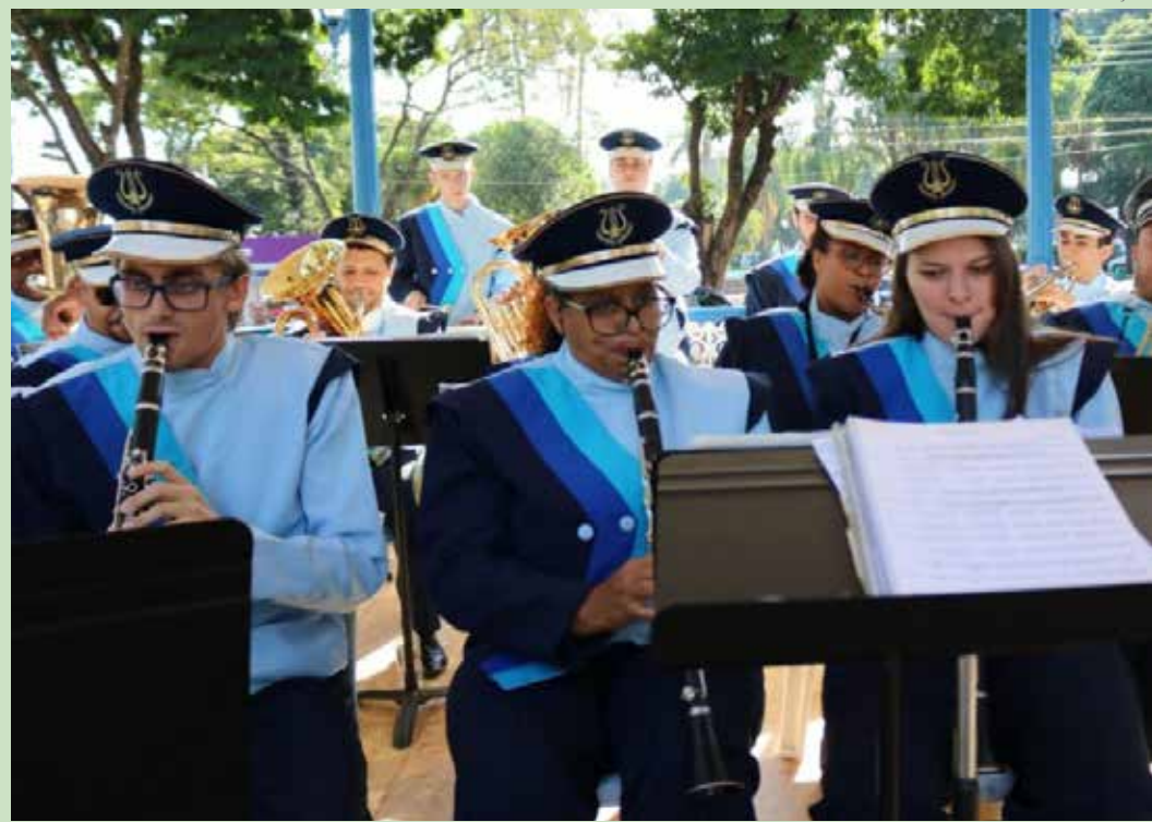
União entre corporação e Prefeitura oferece aulas de música para mais de 3 mil alunos

A Corporação Musical 24 de Junho completa 96 anos e é motivo de orgulho para a Prefeitura de Artur Nogueira. Tal sentimento tem motivo: a corporação é parceira do Poder Executivo em um projeto que muda a vida de milhares de pessoas, o Projeto Retreta.