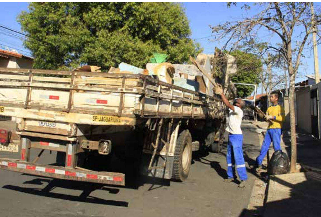
Diversos trabalhos foram realizados

A equipe da Secretaria de Obras e Serviços Urbanos da Prefeitura de Jaguariúna realizou nesta semana, diversos trabalhos de manutenção e conservação na cidade. Nos bairros Florianópolis, Pinheiros, Capela Santo Antônio e Jardim