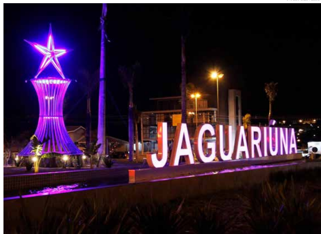
Portal Turístico localizado na rodovia João Beira

Segundo a titular da pasta municipal de Turismo e Cultura, o novo roteiro inclui ainda o Boulevard, um grande espaço cultural e de eventos – que também deve ser inaugurado em breve -, que forma um polo turístico em conjunto com o Centro Cultural, a Maria Fumaça e a nova estrutura da Feira de Artesanato (Feart).