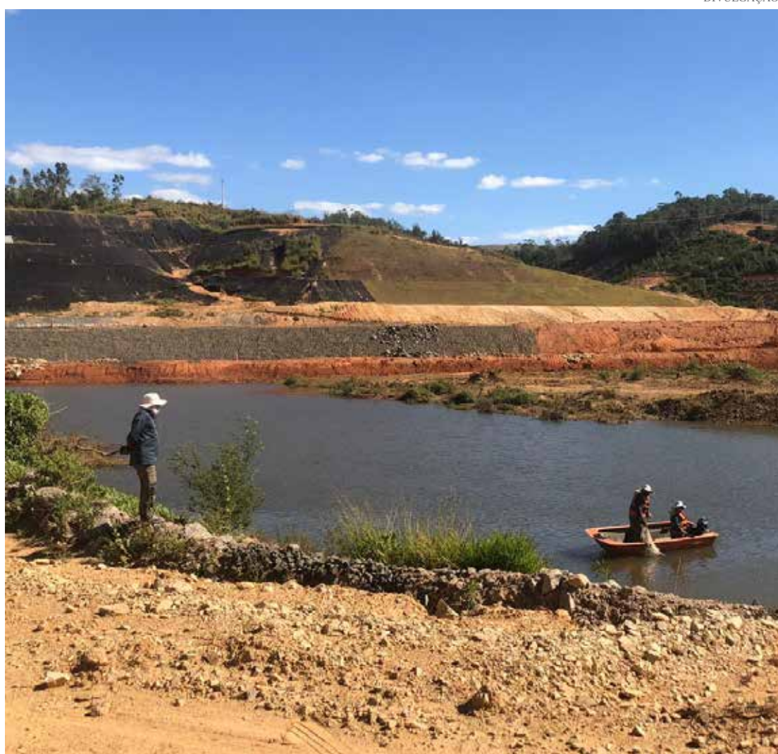
A campanha faz parte de um conjunto de ações de preservação ambiental

tica (incluindo peixes e outros organismos vivos) responde diretamente pela qualidade da água, ou seja, quando há uma mudança brusca na qualidade da água, como quantidade elevada de fósforo e nitrogênio, por exemplo, a comunidade aquática é afetada, diminuindo assim a diversidade de peixes em determinado ponto. Em caso de variação dos resultados entre campanhas é possível correlacionar