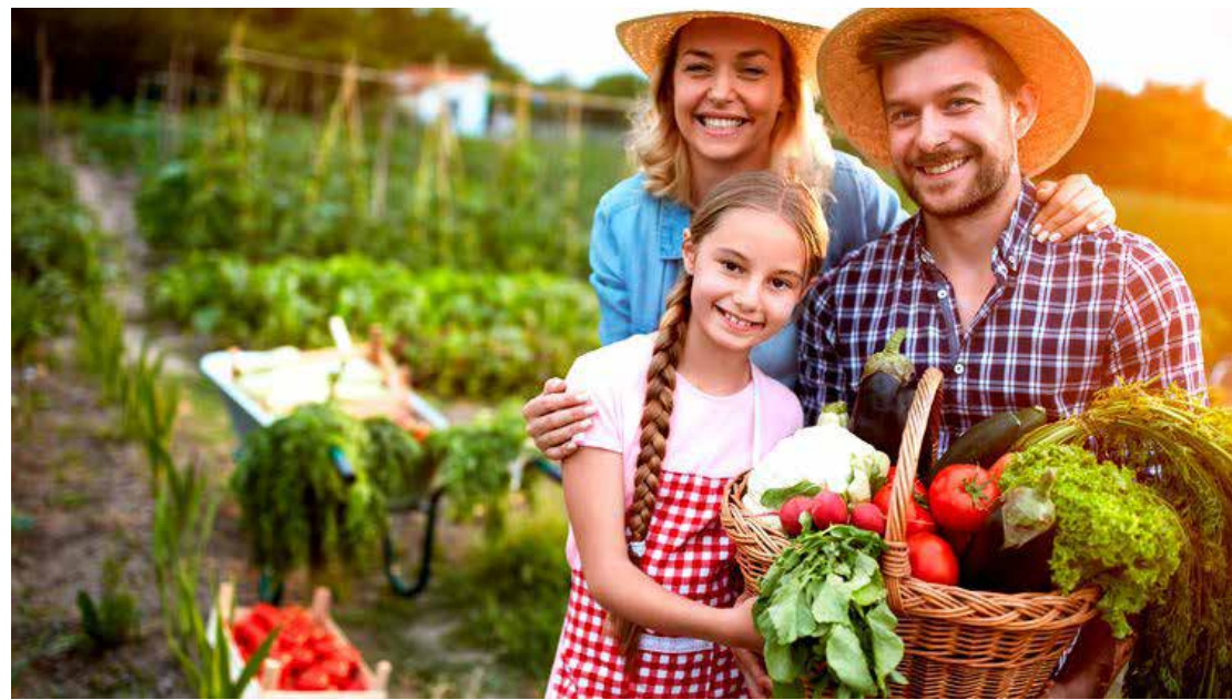
A Cooprefan fica localizada no início da vicinal entre Artur Nogueira e Limeira

A Cooperativa de Produção Agro Industrial Familiar (Cooprafan) de Artur Nogueira deve ter sua estrutura melhorada em breve. Uma cozinha industrial será instalada no local, possibilitando aos produtores mais possibilidades no manufaturamento de seus produtos. O secretário de Agri-