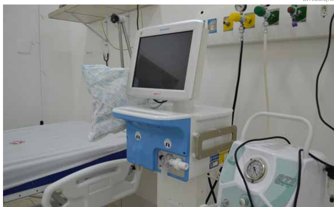
Investimentos na área da Saúde