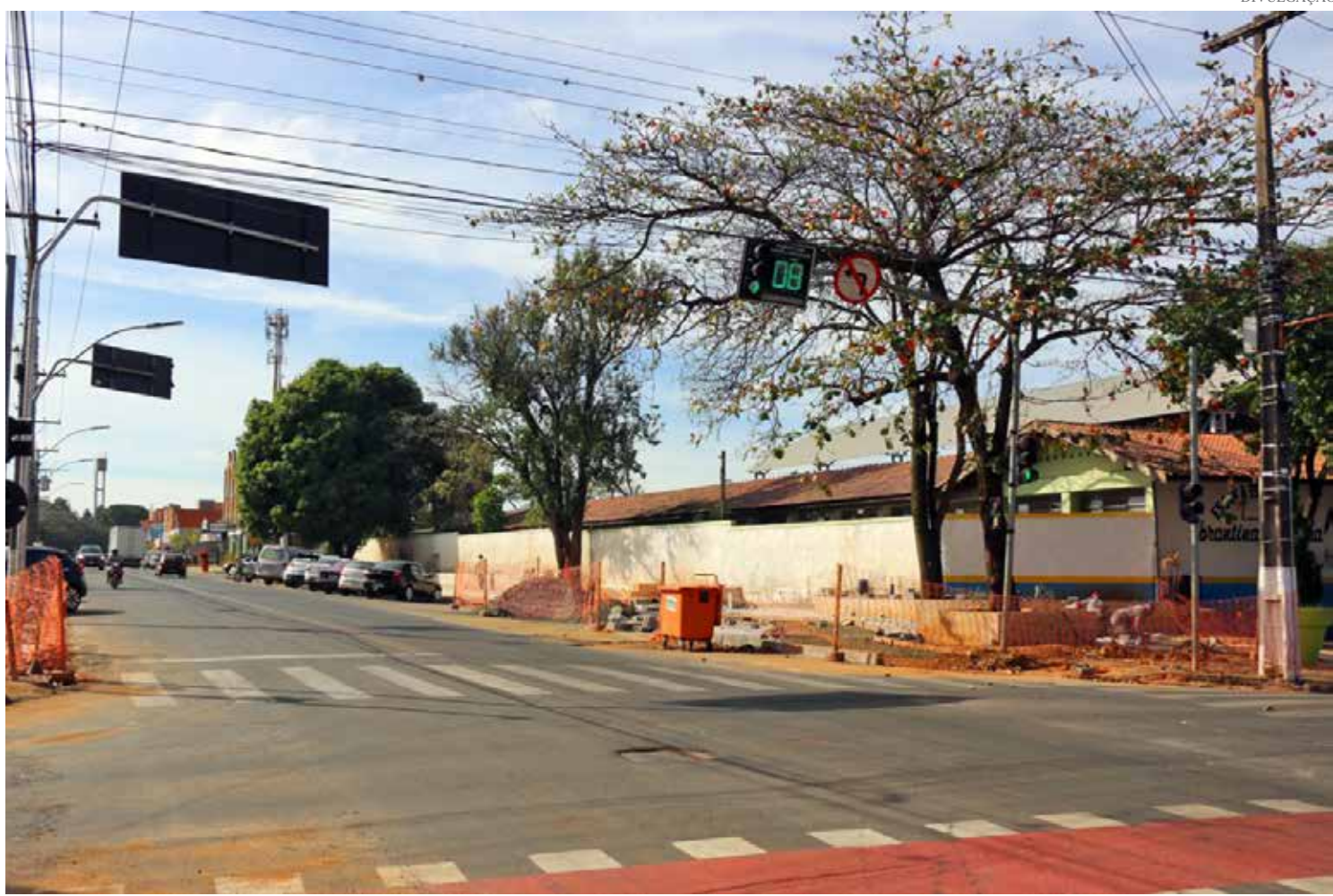
O trabalho deve durar cerca de 30 dias

Perto dali, em outro trecho da mesma via, a Prefeitura inicia também no dia 29 obras de mobilidade no trecho compreendido entre o Memorial do Imigrante e o Portal. Principal acesso à cidade, o local recebe ciclovias, passagens elevadas e iluminação ornamental. Nesta área não há interrupção ou mudanças no tráfego de veículos.