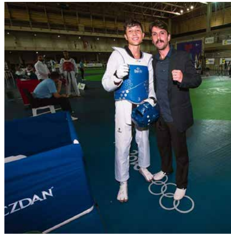
O taekwondo é uma arte marcial e esporte olímpico

“Tenho certeza que não é a primeira vez que a humanidade passa por algo assim e não vai ser a última. “Vamos nos recuperar, mas a gente depende da consciência da população e de nossos governantes. A gente sente que existe uma crise política muito grande, mas ficamos na torcida para que tudo se resolva o mais rápido possível para voltar a trabalhar”.